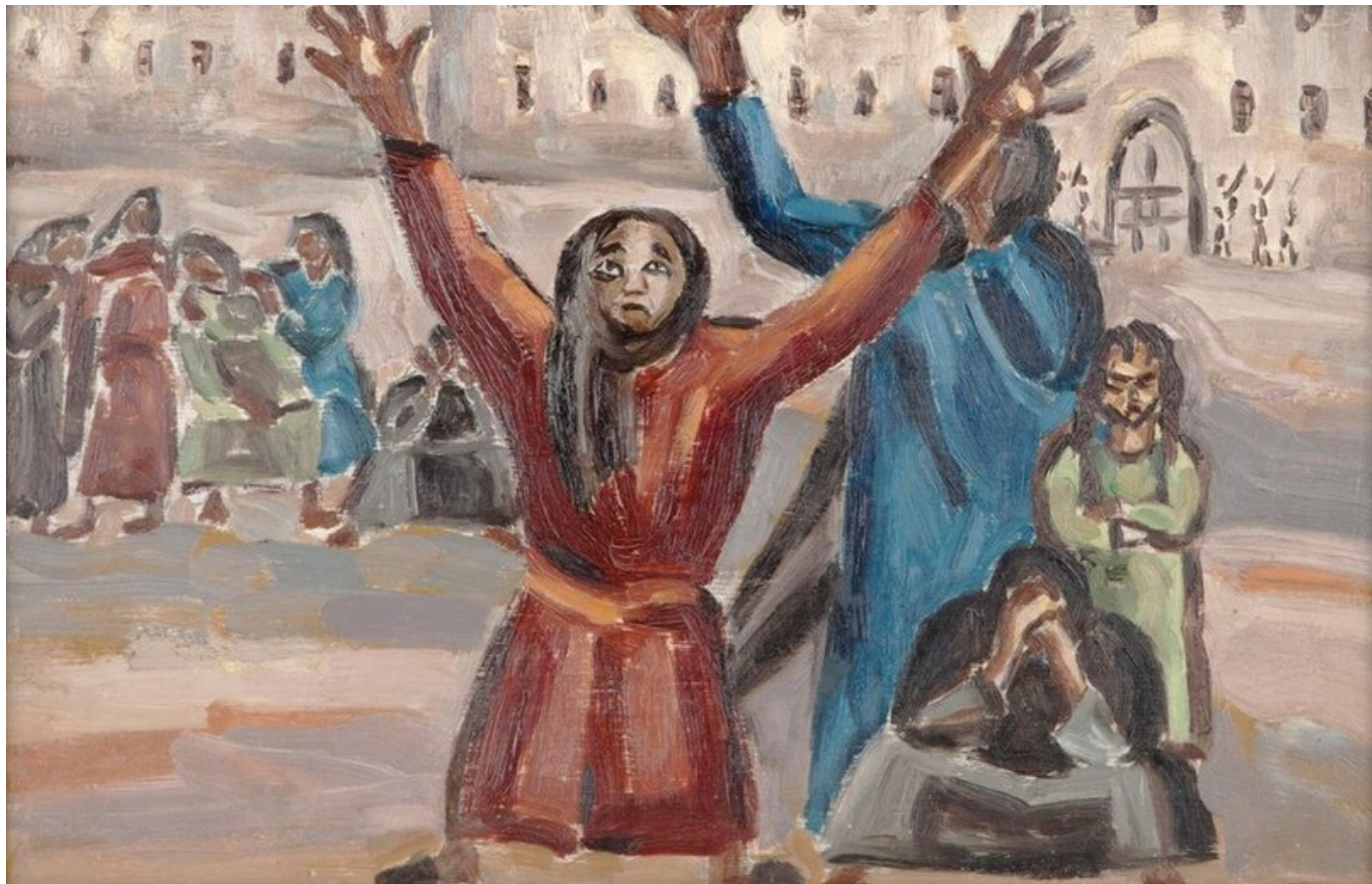
Prisoners / Заключенные, 1957. Inji Efflatoun / Инджи Эффлатун.