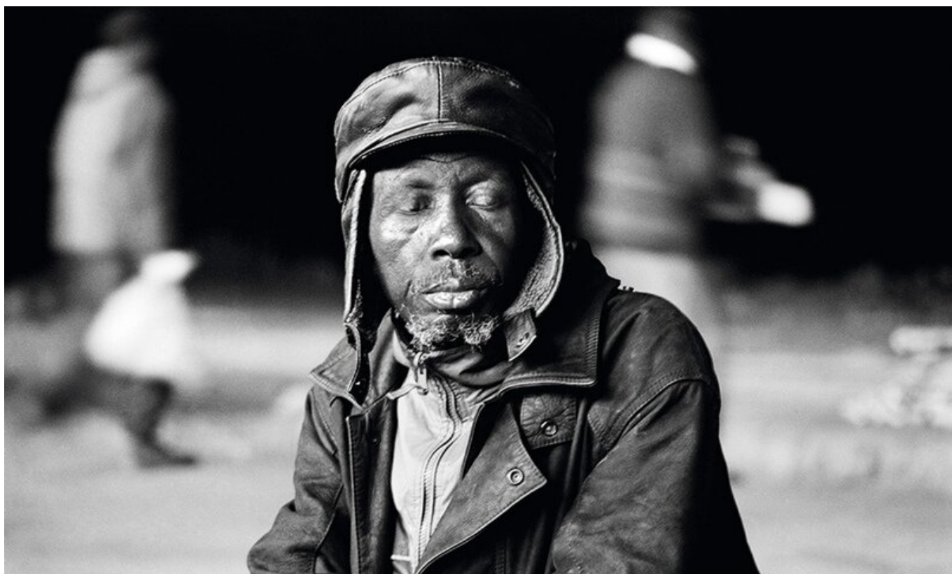
Eyes Wide Shut, Motouleng Cave, Clarens - Free State / Накрепко закрытые глаза, Мотоуленг Кейв, Кларенс — Свободный Штат, 2004. Santu Mofokeng / Санту Мофокенг.