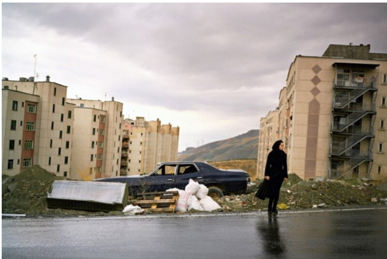
Again me standing in the cold, alone / Снова я стою на холоде, одна, 2010. Newsha Tavakolian / Ньюша Таваколян.