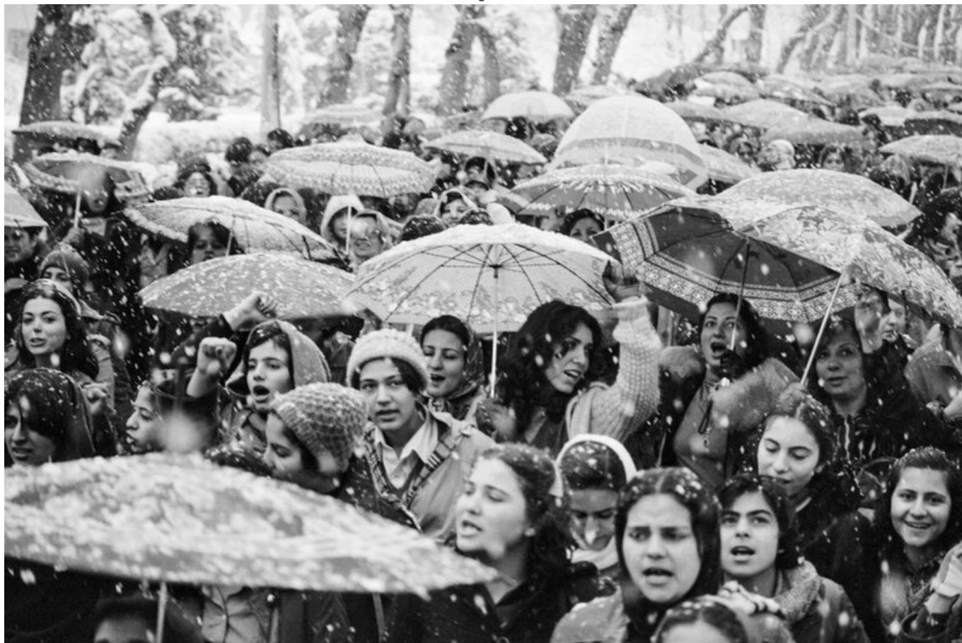
Witness 1979 / Свидетельство 1979, 1979. Hangameh Golestan / Хенгаме Голестан.