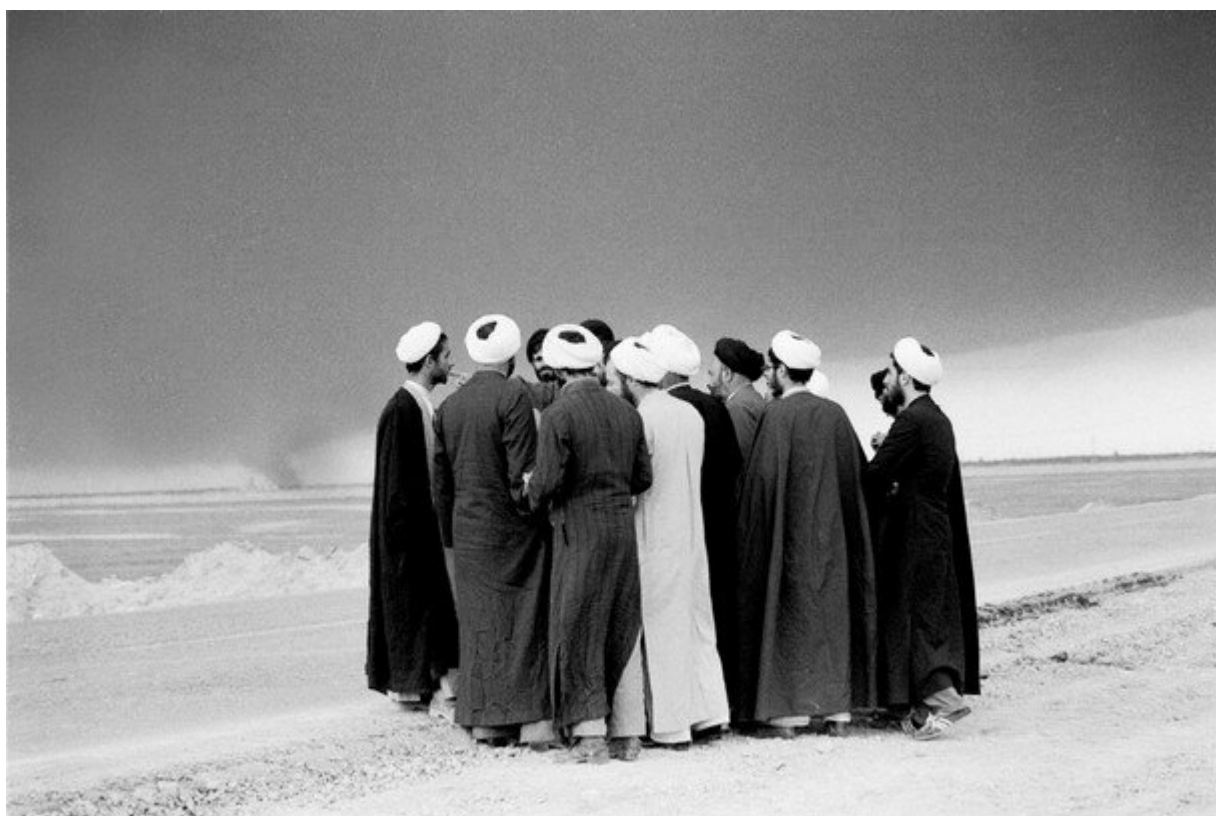
Mullahs at the front near Abadan, Iraq-Iran War / Муллы на фронте под Абаданом. Ирако-иранская война, 1983. Kaveh Golestan / Кавех Голестан.

Сирией через Закон Об Ответственности Сирии (Syria Accountability Act) 2005 года (и войной против Сирии с 2011 года), и пытались уничтожить ливанскую политическую силу Хезболла через израильскую атаку на Ливан в 2006. Ни то, ни другое не сработало. В 2006 году, США сфабриковали кризис вокруг иранской ядерной энергетической программы; они разработали санкции против иранской экономики со стороны ООН, Европейского Союза и США. Это тоже не сработало, и поэтому в 2015 году США согласились на ядерную сделку (которую Трамп сейчас отверг). Неужели это конец зимы, пели тогда в Иране? Но это не было концом зимы. Гибридная война продолжалась.