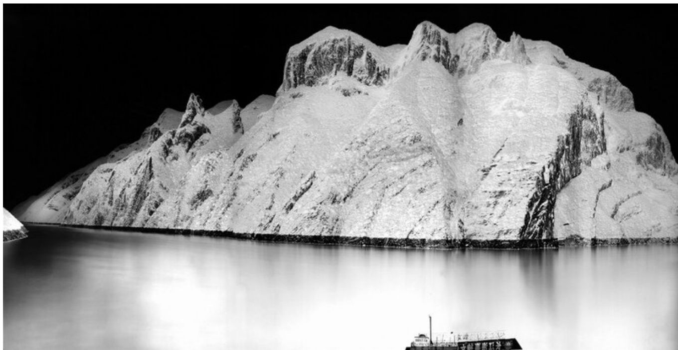
The Yangtze River / Река Янцзы, 2013. Shi Guorui / Ши Горуй.

В досье номер 24 Института социальных исследований Tricontinental — Мир колеблется между кризисами и протестами — есть важный раздел о новом «биполярном мире». Является широко признанным фактом то, что могущество США начало истощаться после незаконного нападения на Ирак в 2003 году и после мирового финансового кризиса 2007-08 годов; в то же время трудно отрицать стремительный рост экономики Китая, и растущее значение Китая на мировой арене. Десятилетие назад, когда Китай и Россия присоединились к Бразилии, Индии и Южной Африке, чтобы сформировать БРИКС, казалось, что глобальная архитектура смещается от однополярности во главе с США (с ее союзниками в качестве спиц вокруг американского центра) к многополярности; но с углублением кризиса в таких странах, как Бразилия и Индия, новая глобальная архитектура, согласно Институту международных отношений Университета Цинхуа, станет биполярной, с США и Китаем в качестве двух полюсов глобального порядка.