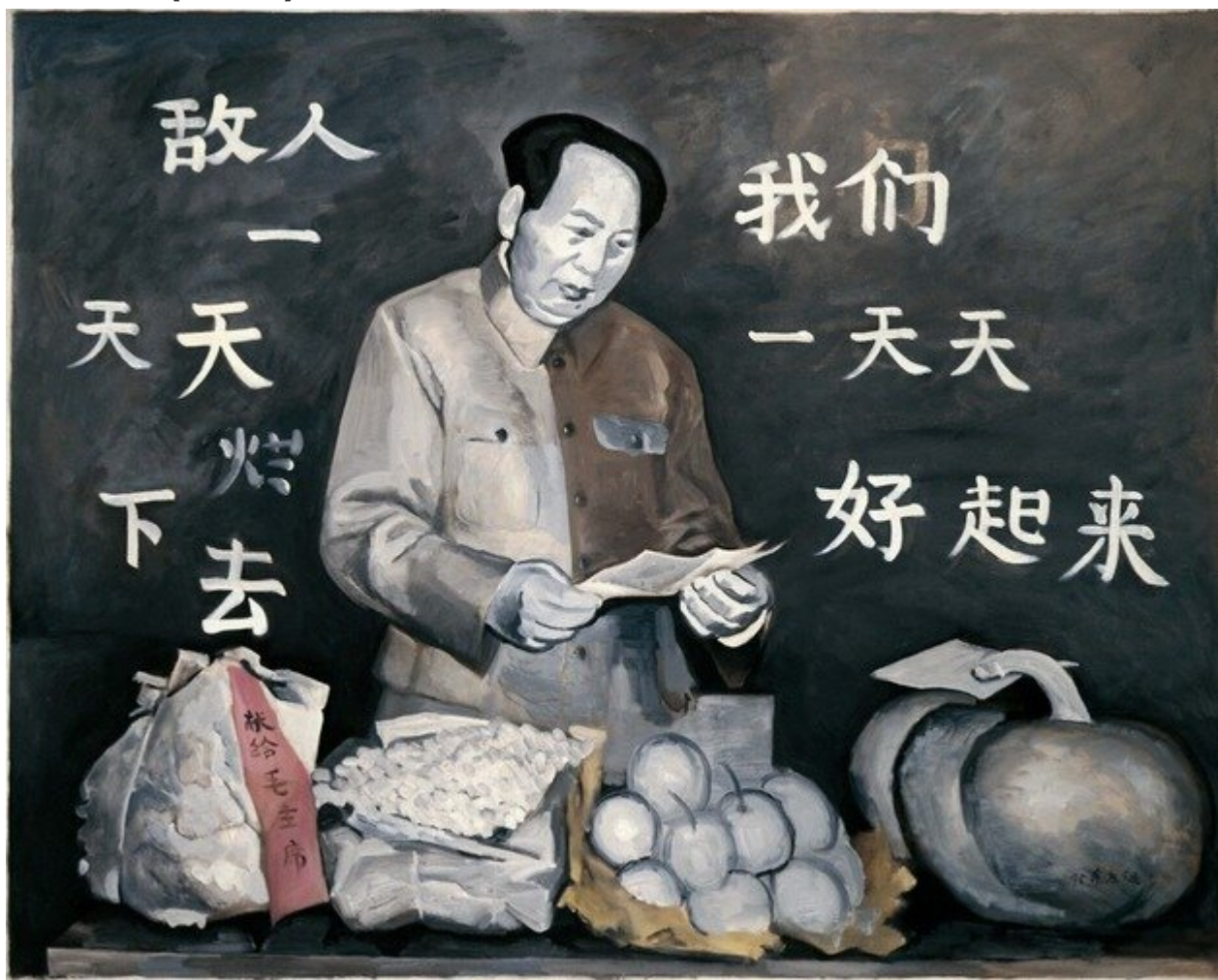
We Will Be Better / Мы будем лучше, 1995. Yu Youhan / Ю Юхан.

Ваша стрела достигла неба, а наша вышла на орбиту: третье письмо (2020).