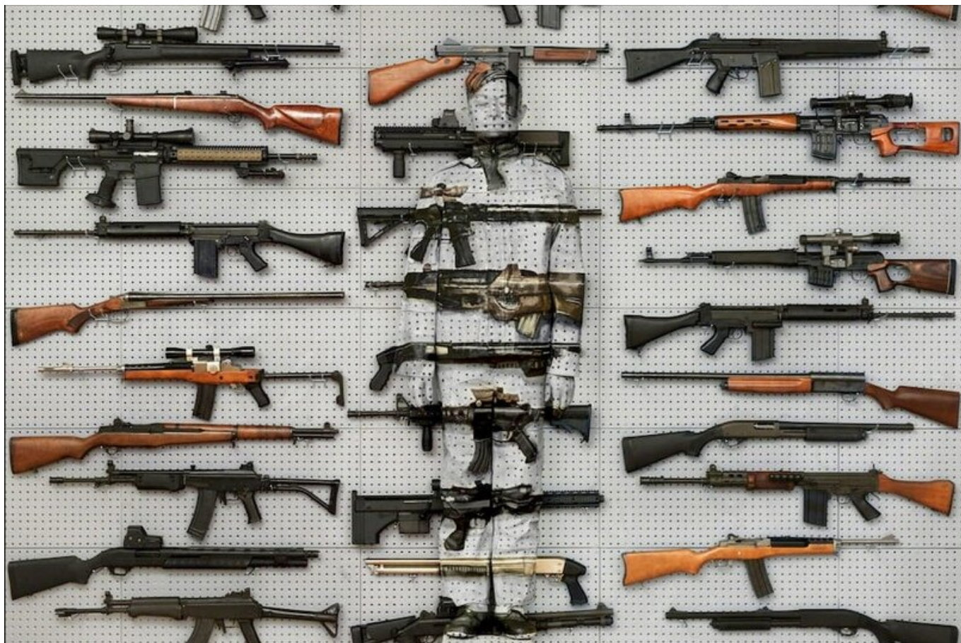
Hiding in New York No. 9 — Gun Rack / Скрывающийся в Нью-Йорке №9 — оружейный стеллаж, 2013. Liu Bolin / Лю Болин.