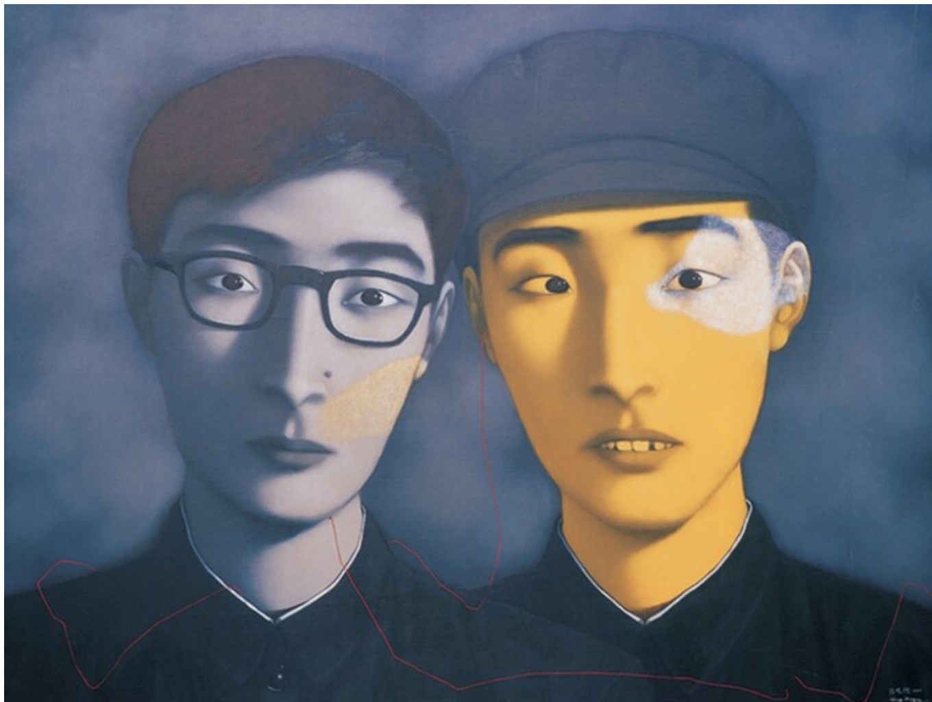
Bloodline - Big Family no. 4 / Родословная - большая семья № 4, 1995. Zhang Xiaogang / Чжан Сяоган.

Хуэй предупреждает, что стрессы рыночной экономики начали порождать новые — и опасные — противоречия для Китая. Одним из подавляющих противоречий является угроза со стороны Соединенных Штатов.