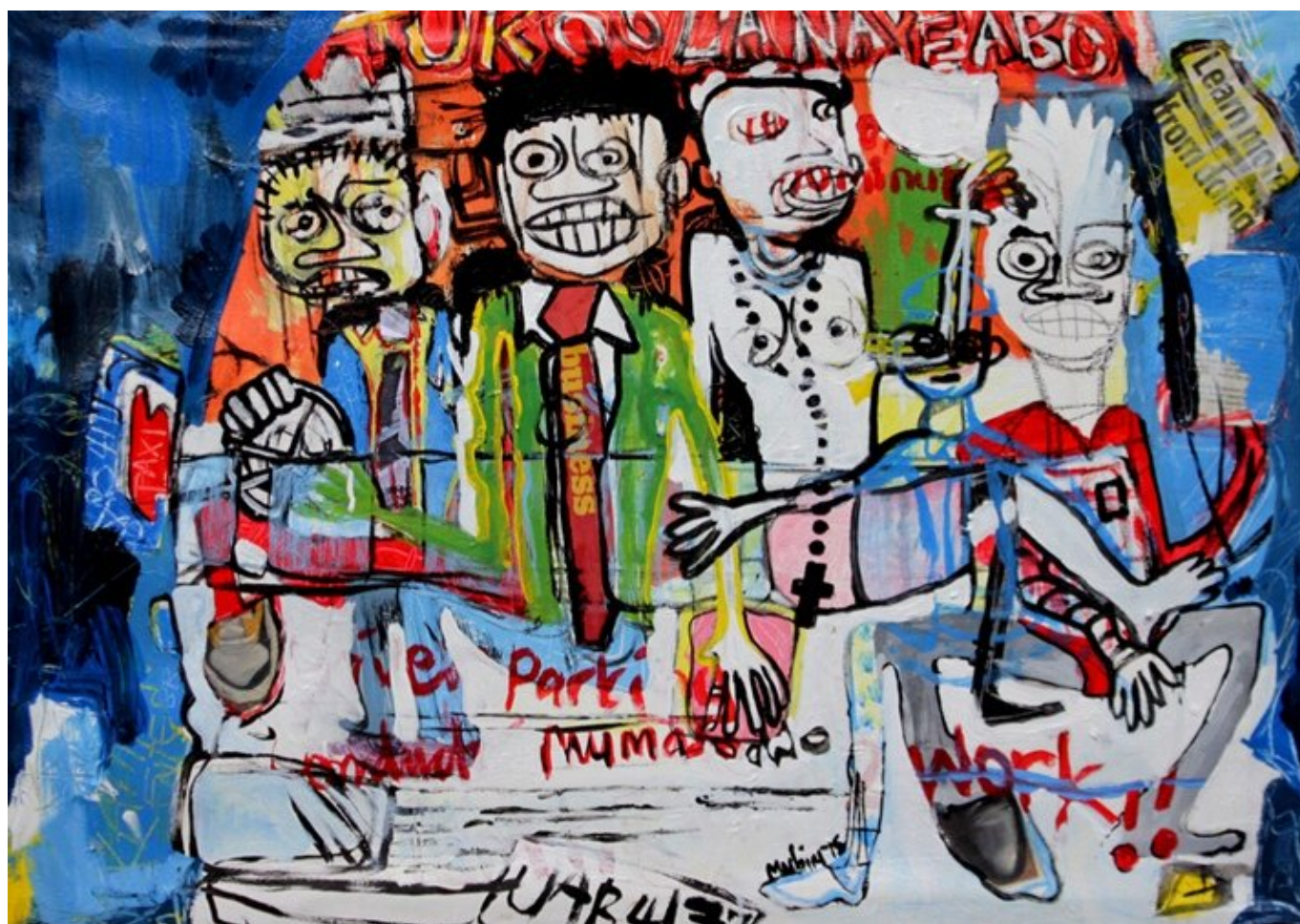
Tukoola Bagaya?! (My Work Goes Unnoticed) / Tukoola Bagaya?! (Моя Работа Остается Незамеченной), 2015. Denis Mubiru / Денис Мубиру.

начинают все больше полагаться на аутсорсинговое производство, неустойчивую занятость и постоянный режим низкооплачиваемой оплаты труда. Другими словами, фирмы каннибализируют общество — оказывая огромное давление на хрупкие сети семьи и общины, усиливая консервативные импульсы в обществе и снижая здоровье и благосостояние общества.