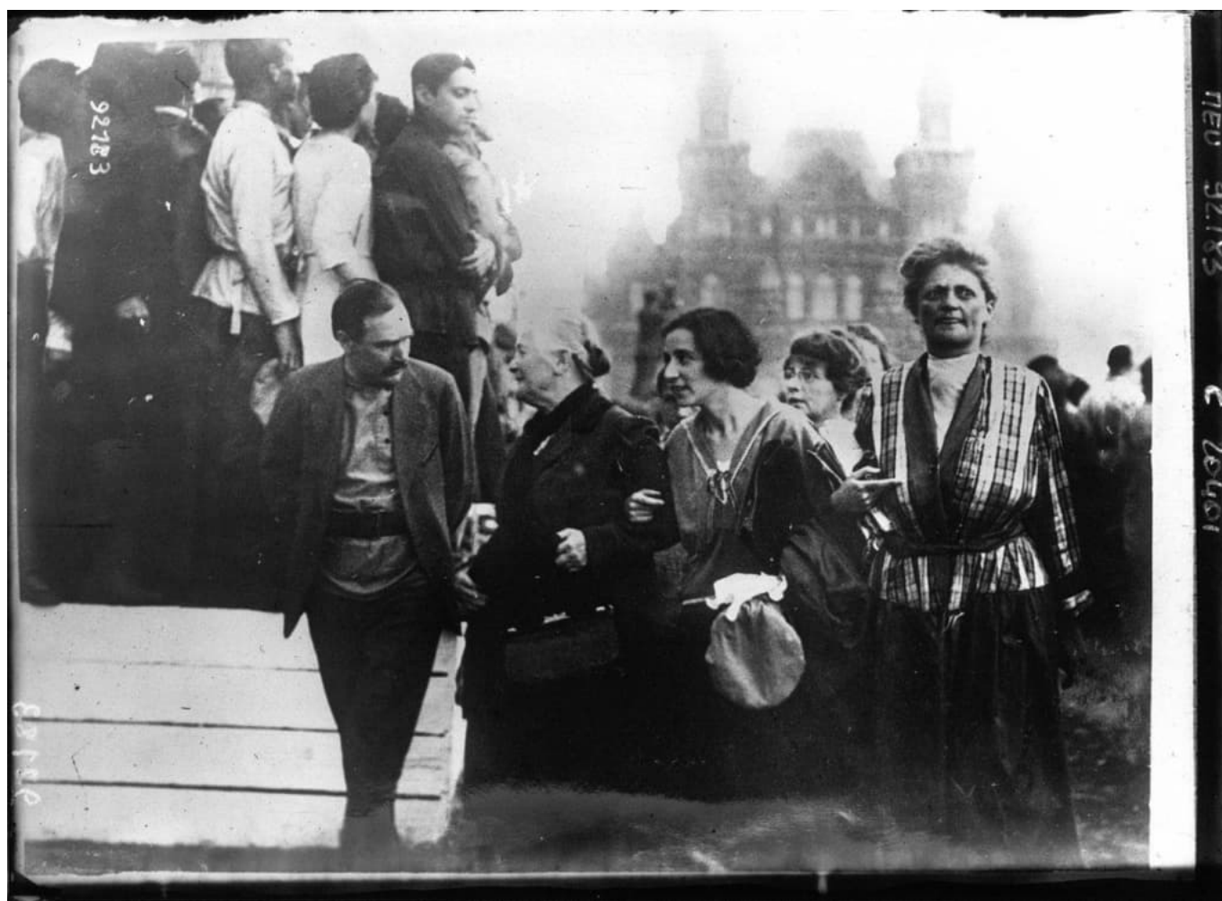
Клара Цеткин и ее товарищи на Второй международной конференции женщин-коммунисток, Москва, 1921.

В 1920 году, лидер большевиков, Александра Коллонтай писала, что женщины в советской республике имеют права и могут голосовать, но что “сама жизнь совершенно не изменилась. Мы находимся только в процессе борьбы за коммунизм, и нас окружает мир, который мы унаследовали от темного и репрессивного прошлого”. Настоящая борьба была впереди. В следующем году Вторая международная конференция женщин-коммунисток установила 8 марта в качестве даты Международного женского дня. Со временем, в 1977 году, эта дата была принята Организацией Объединенных Наций во многом благодаря работе Международной демократической федерации женщин.