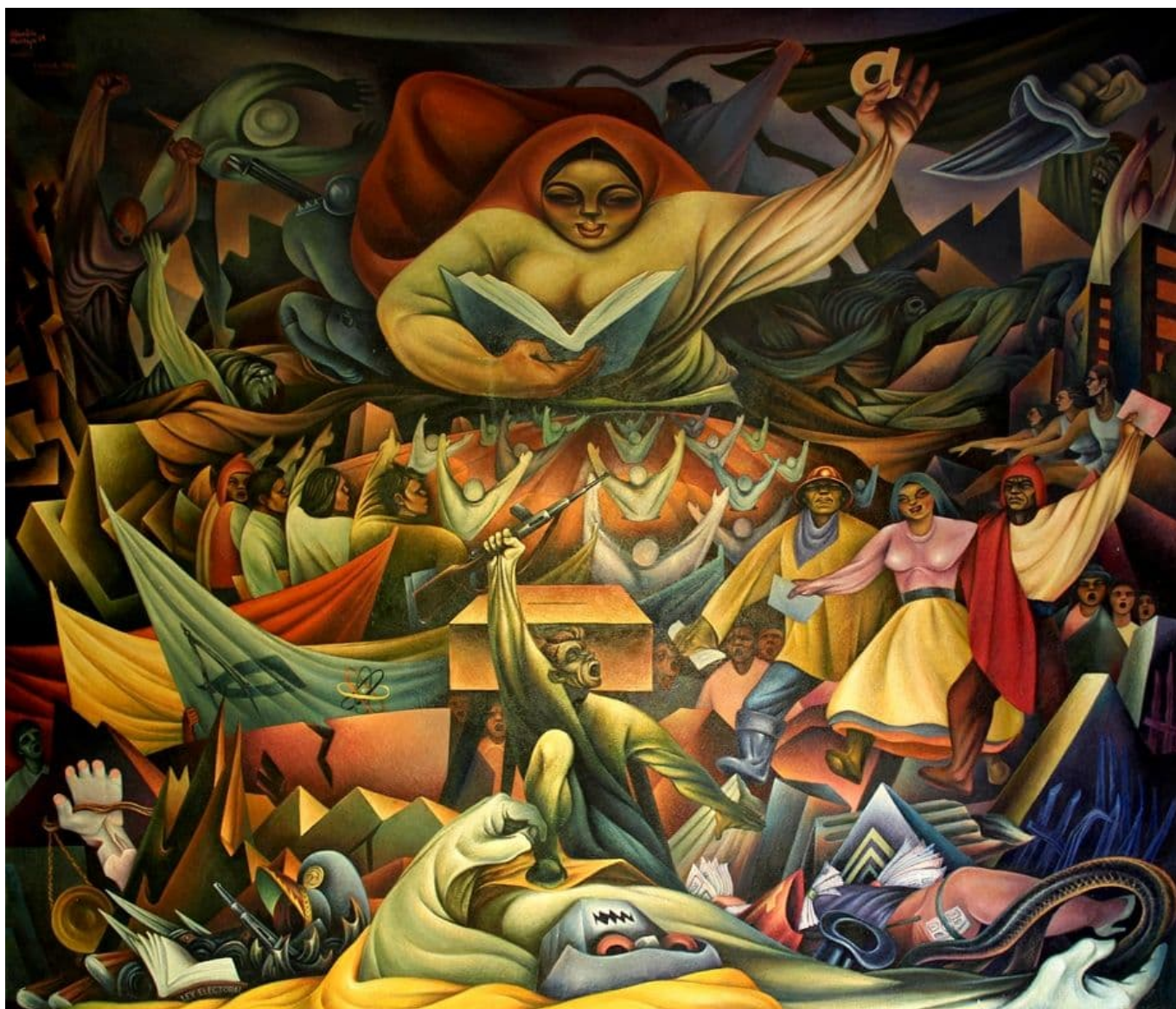
La educación / Образование, 1960, Памятник национальной революции, Ла-Пас, Боливия. Miguel Alandía Pantoja / Мигель Аландия Пантоха.

Президент Гондураса, Эрнандес, вступил на свой второй срок в 2018 году после обвинений в фальсификации выборов, которые вызвали массовые протесты по всей стране; Эрнандес ответил слезоточивым газом и стрельбой. В офисе Организации Американских Государств (ОАГ) на это никто не обратил внимания. Эрнандес, несмотря на все проводимые против него расследования по обвинению в торговле наркотиками, пользуется благосклонностью правительства Соединенных Штатов. Вся эта история с фальсификацией выборов теперь носит глубоко политический характер, и такие организации, как ОАГ, используют её как оружие для подрыва левых правительств. Новое исследование , проведенное двумя учеными из Массачусетского технологического института ( Massachusetts Institute of Technology, MIT ), показало, что на выборах в Боливии 2019 года не было никаких фальсификаций; «предварительный» отчет ОАГ об этих выборах предполагал мошенничество, которое было использовано как правительством США, так и