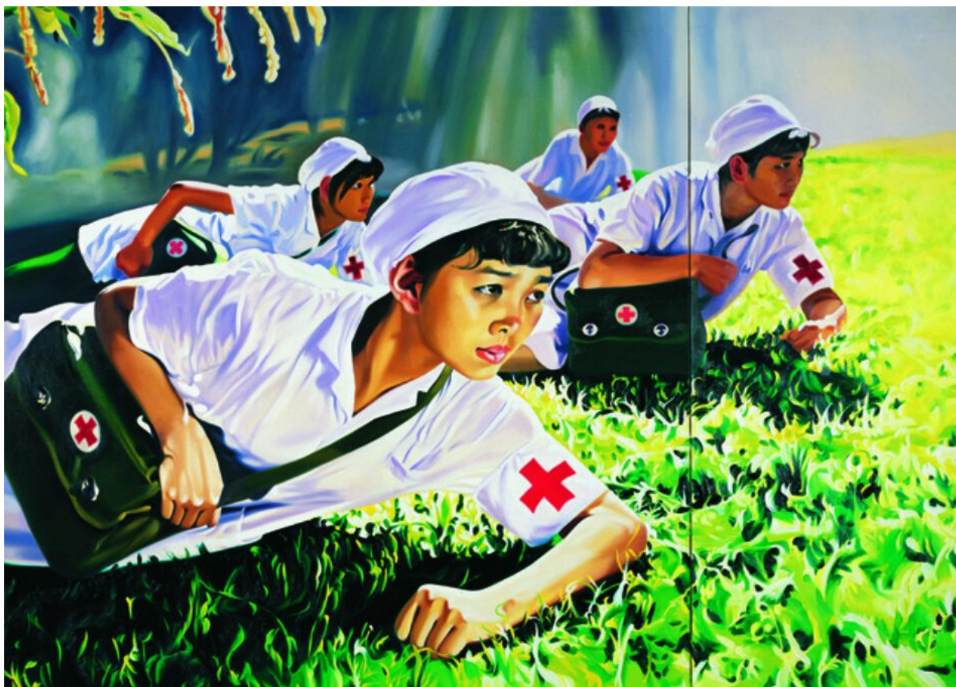
Dream 2008, No. 1 (Nurses) / Сон 2008, № 1 (Медсестры), Китай, 2008. Jing Kewen / Цзин Кьюэнь.

Нападение на Китай и ВОЗ, по-видимому, рассчитано на то, чтобы отвлечь внимание от некомпетентности правительств таких стран, как Соединенные Штаты Америки и Бразилия, в том, что касается их способности справиться с этим кризисом. В Бразилии президент, Жаир Болсонару, в настоящее время приостановил публикацию основных данных о распространении инфекции и смертности от этого вируса; он также пригрозил приостановить действие конституции, провести переворот и захватить полную власть.