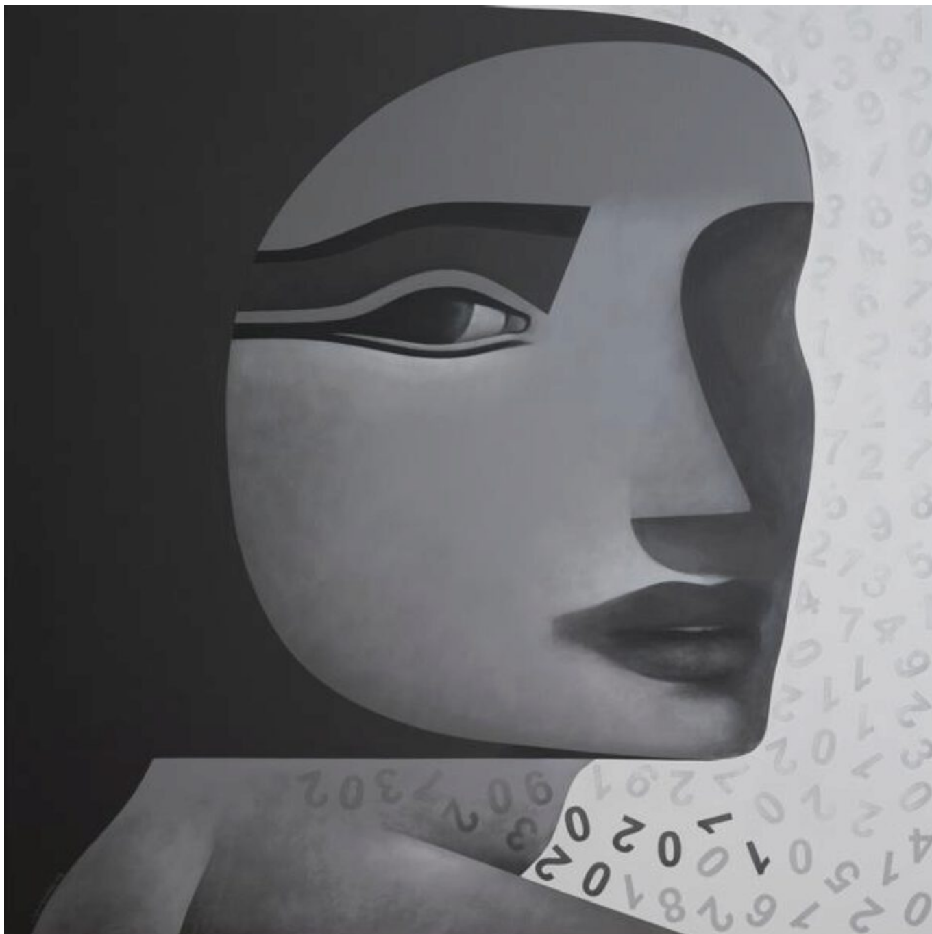
Dream / Сновидение 172, Сирия, 2018. Safwan Dahoul / Сафван Дахул.

Таких людей, как Трамп и Болсонару, не заботят голоса этих работников или их объединений; они сосредоточены на сглаживании своей собственной репутации, тем временем обвиняя других в своей собственной некомпетентности. Однако именно эти работники являются теми, чья серьезность удерживает наше общество вместе; настало