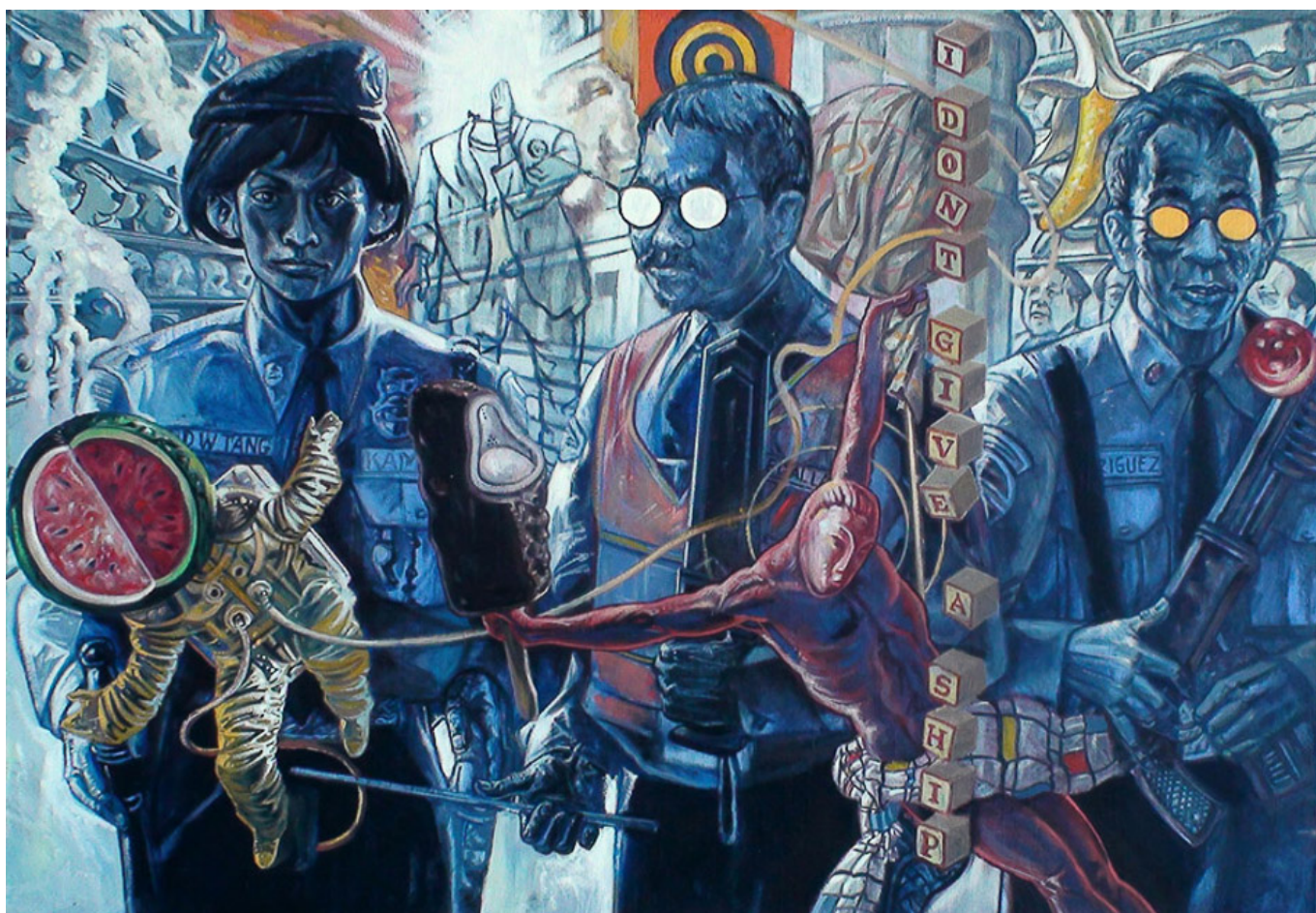
The Pro-Rated Wage of the Abang Guard / Пропорционально распределенная зарплата гвардии Абанга, 2011. Jose Tence Ruiz / Хосе Тенс Руис.

В этом корень проблемы, который не решается буржуазным порядком, согласно которому деньги — это Бог, земля, сельская и городская, распределяется через рынок, а продовольствие — это просто еще один товар, от которого капитал стремится получить прибыль. Когда реализуются скромные программы распределения продовольствия для предотвращения широко распространенного голода, они часто функционируют как государственные субсидии для продовольственной системы, захваченной капиталом — от корпоративных ферм до супермаркетов.