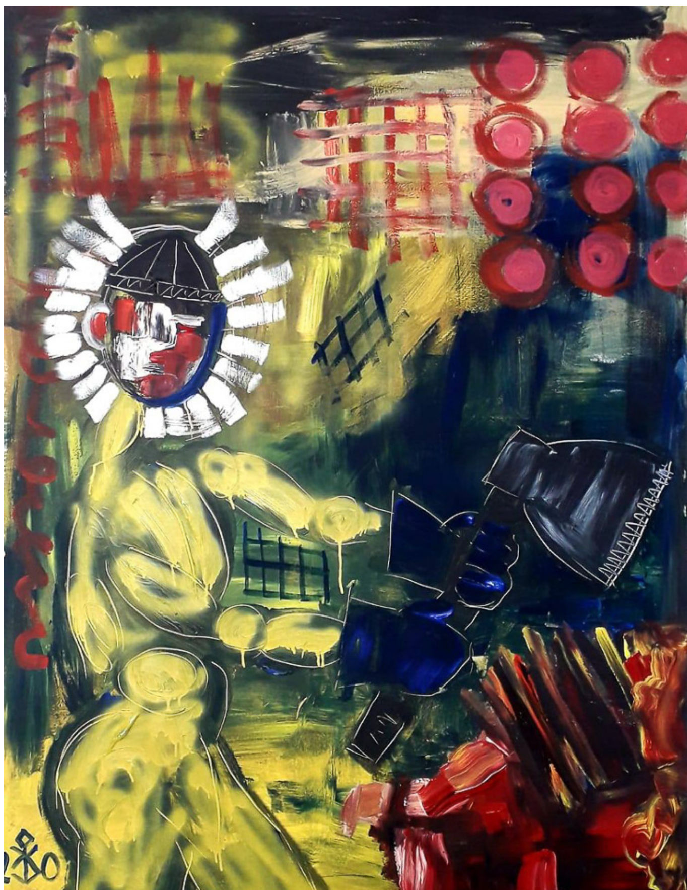
Coronavirus / Коронавирус, 2020. Kanat Bukezhanov / Канат Букежанов.