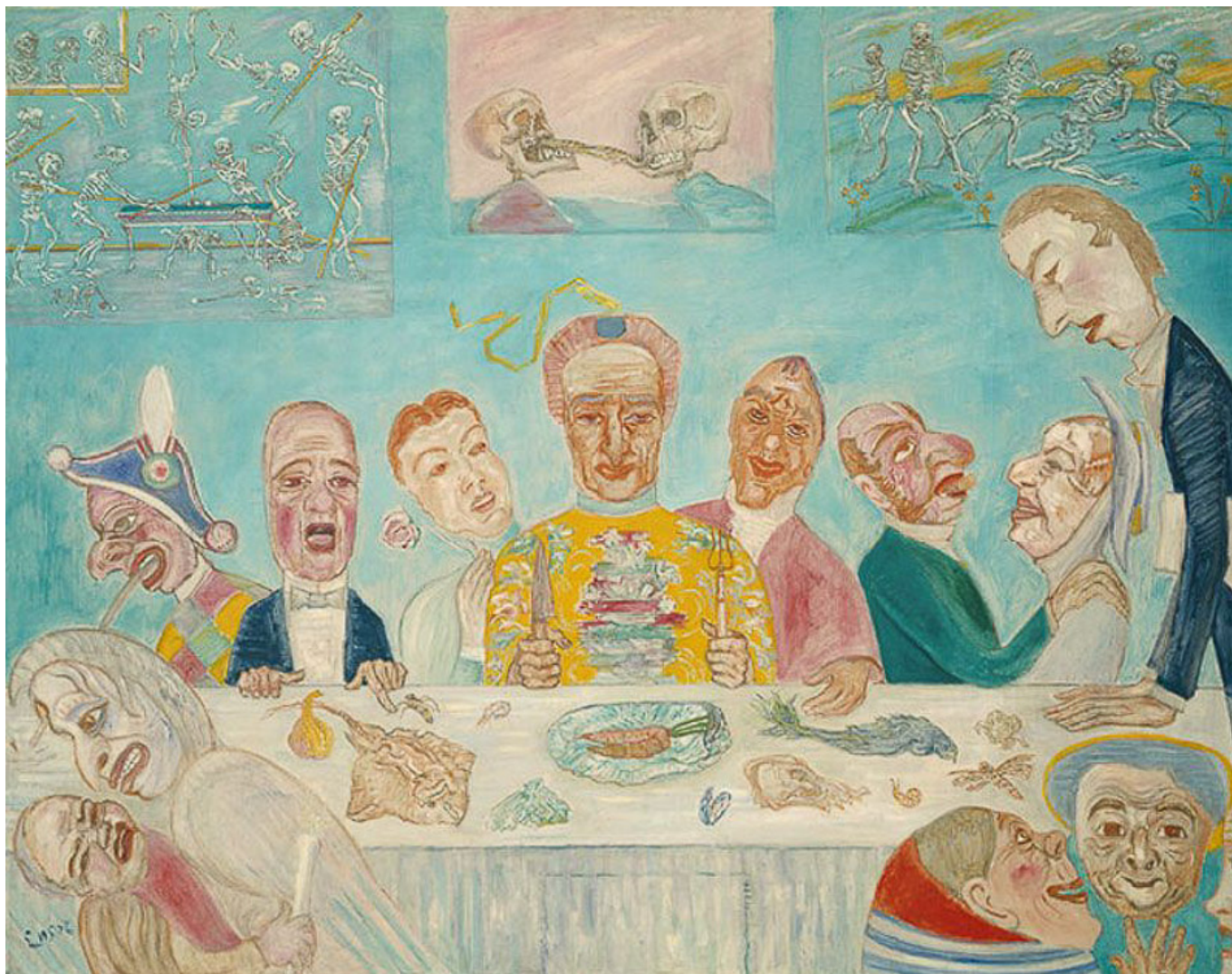
Comical Repast (Banquet of the Starved) / Комическая трапеза (Банкет голодных), 1917-18. James Ensor / Джеймс Энсор.

преодолеть ещё столетие назад. Что значит для человека научиться строить машины или летать на самолетах и в то же время не упразднить унижения голода?