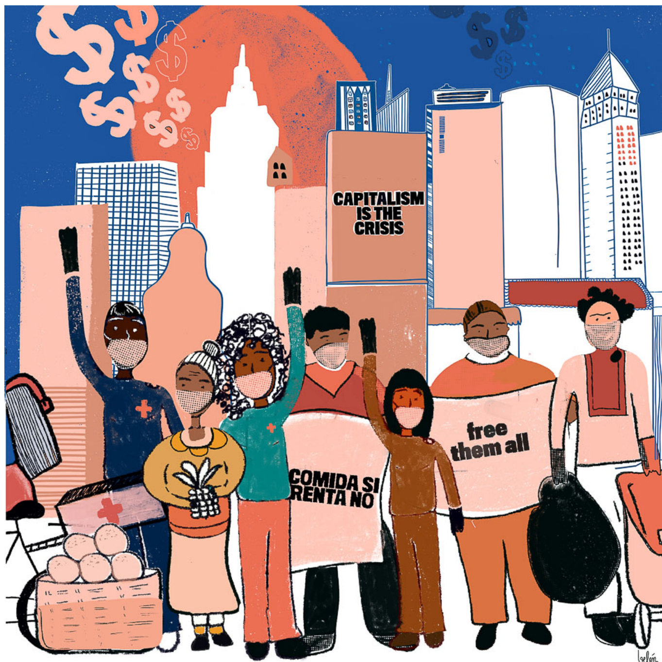
Who Sustains Life? / Кто Поддерживает Жизнь?, 2020. Belén Marco Crespo / Белен Марко Креспо.

Гораздо более амбициозным является предложение Конференции ООН по торговле и развитию (ЮНКТАД) о создании международного органа по вопросам задолженности развивающихся стран. У этого органа был бы двойной мандат: во-первых, следить за любыми временными остановками в погашении задолженности, чтобы предотвратить такие события, как рецессия, вызванная коронавирусом; во-вторых, внимательно рассматривать необходимость фундаментального облегчения долгового бремени