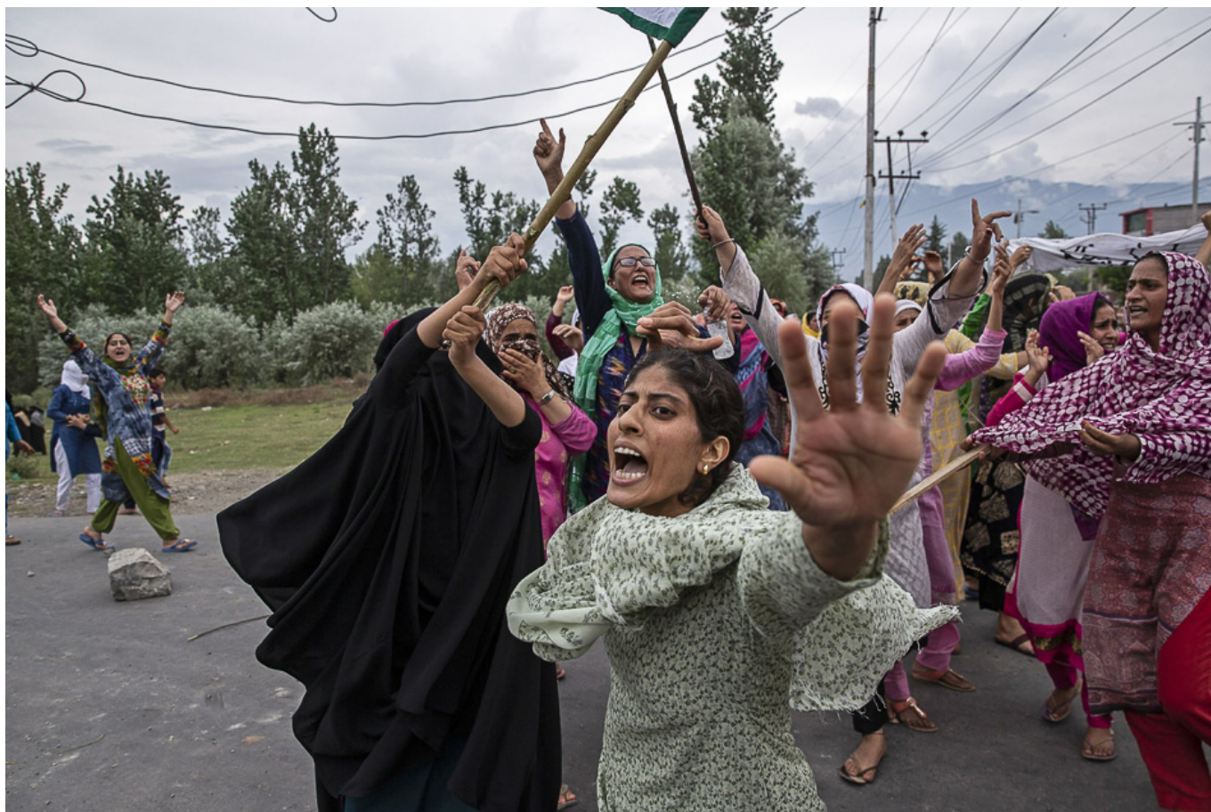
Шринагар, Кашмир, 9 Августа 2019.

Три фотографа AP — Дар Ясин, Мухтар Хан и Ченни Ананд — получили Пулитцеровскую премию за свои фотографии о борьбе внутри Кашмира. Пожалуйста, прочитайте нашу красную тревогу № 1 Кашмир.