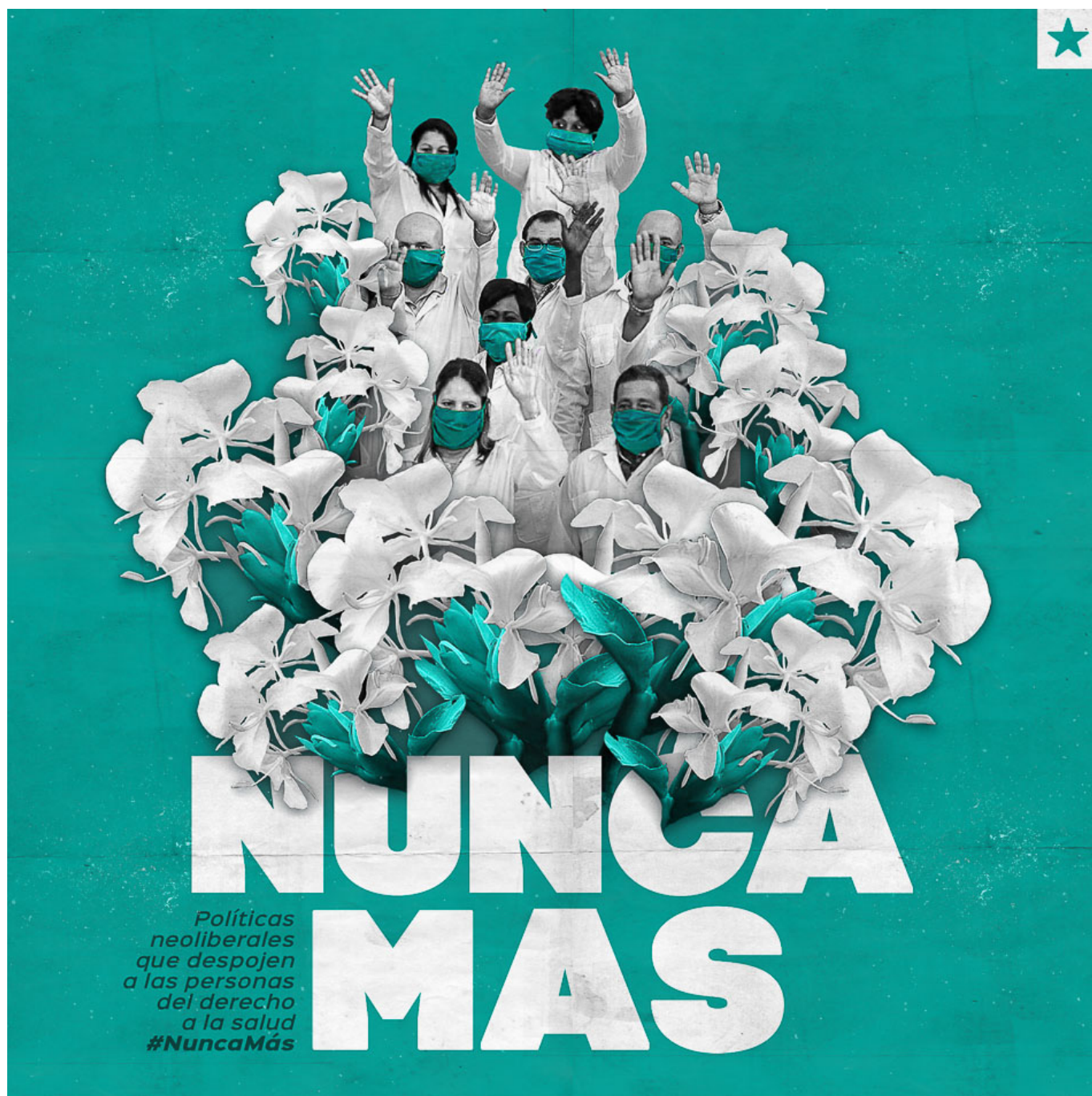
Nunca Más / Никогда больше, 2020. Kalía Venereo (Dominio Cuba) / Каляя Венеро, (Dominio Cuba).