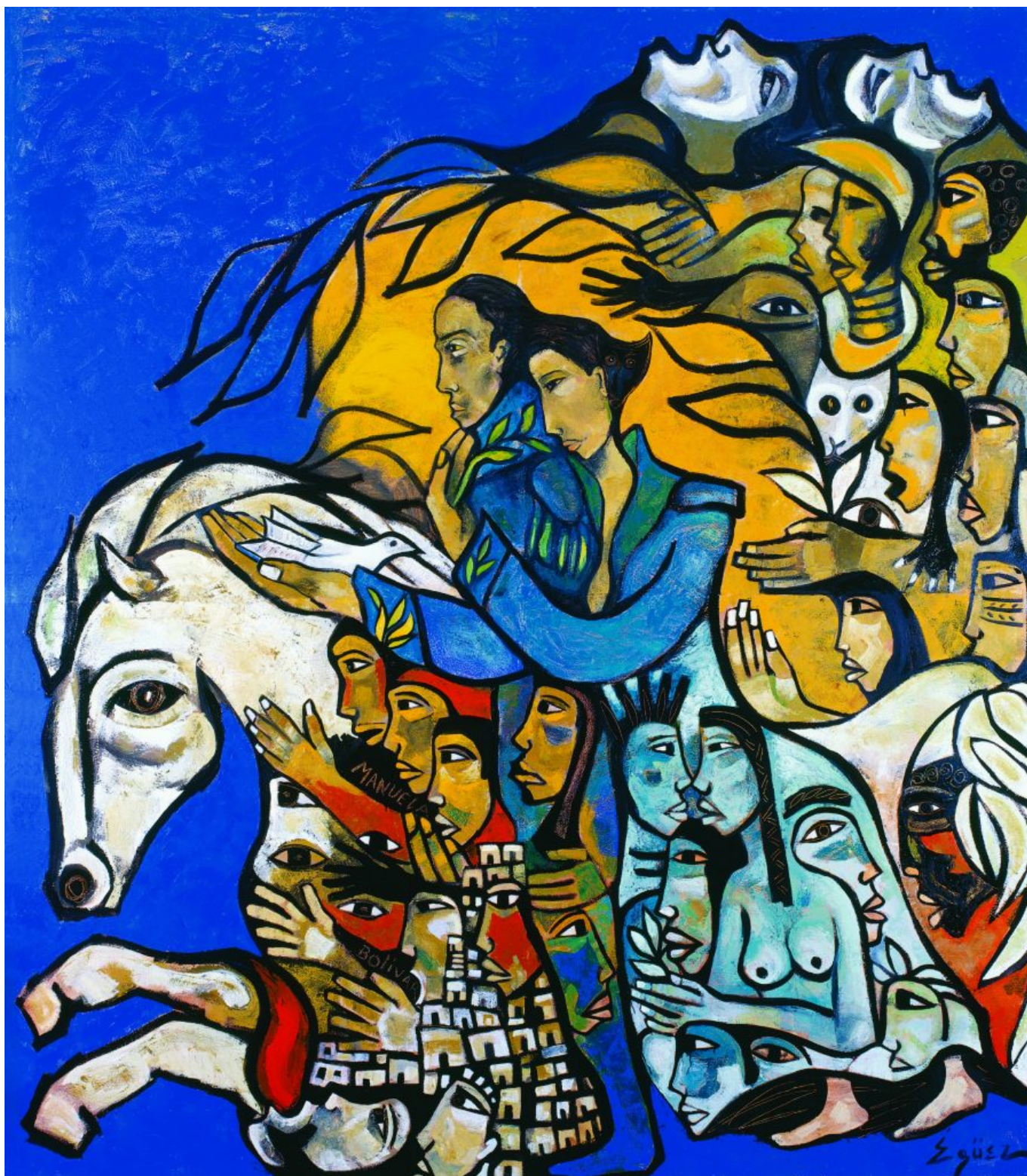
Pavel Égüez, La Patria Naciendo de la Ternura [A Pátria Nascida da Ternura], Caracas, Venezuela, 2006.