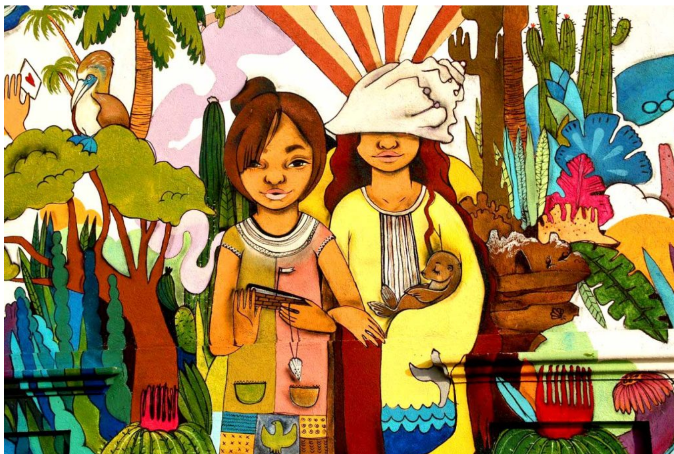
Arte urbana de Eva Bracamontes (México). Mais informações: Utopix .

Por tudo isso, adquire hoje um significado especial reivindicar, a partir do México, os ideais de unidade e integração legados pela doutrina anfitriônica e impulsionados neste século XXI pela geopolítica bolivariana da Venezuela revolucionária.