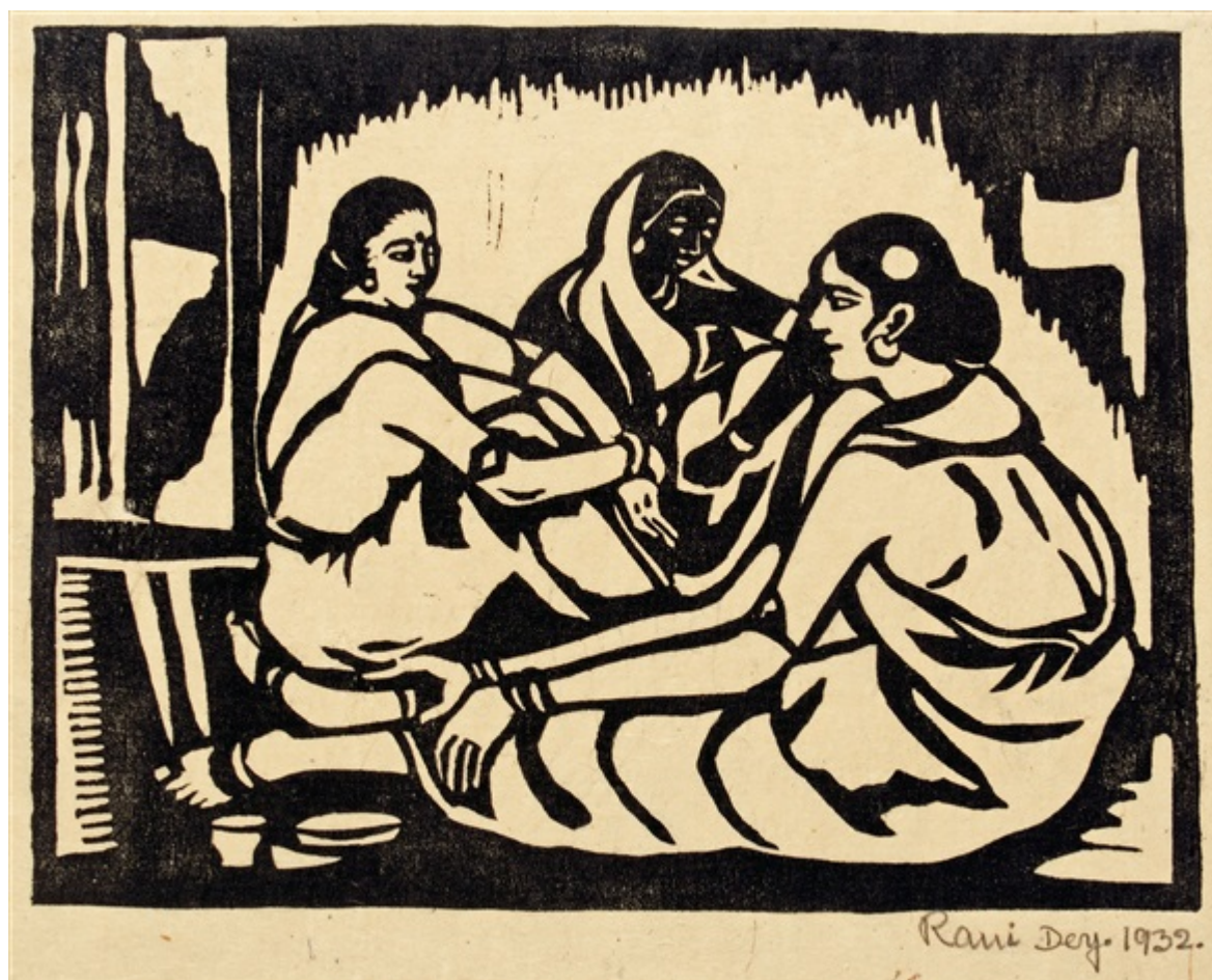
Rani Chanda (Índia), The Solace [O consolo], 1932.

Em 10 de agosto, um dia após o corpo da jovem médica ter sido descoberto, a DYFI, a Federação de Estudantes da Índia (SFI, na sigla em inglês), o Partido Comunista da Índia (Marxista) e outras organizações realizaram protestos em Bengala Ocidental para exigir justiça. Esses protestos cresceram rapidamente, com a presença de profissionais médicos em todo o estado, e depois em toda a Índia, do lado de fora de seus locais de trabalho com cartazes expressando sua bronca política. O movimento das mulheres, que viu protestos massivos em 2012 depois que uma jovem em Delhi foi estuprada e assassinada por uma gangue, novamente foi às ruas. O número de jovens mulheres que compareceram a esses protestos reflete a escala da violência sexual na sociedade indiana, e seus discursos e cartazes estavam repletos de tristeza e raiva. “Reivindiquem a noite”, gritaram dezenas de milhares de mulheres em protestos em Bengala Ocidental em 14 de agosto, dia da independência da Índia.