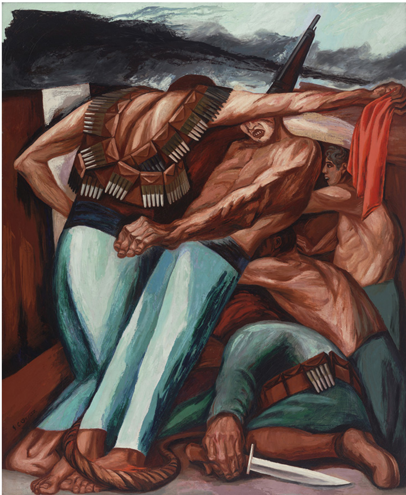
José Clemente Orozco (México), Barricada , 1931.

resgate. A questão nunca foi se os civis deveriam ajudar, mas sim se a assistência está sendo organizada de forma a salvar vidas.