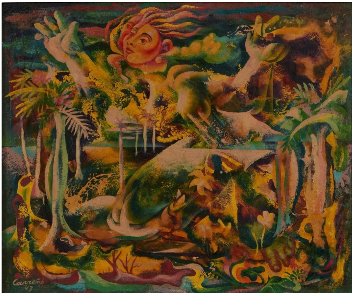
Mario Carreño (Cuba), Alegoria de uma paisagem cubana , 1943.