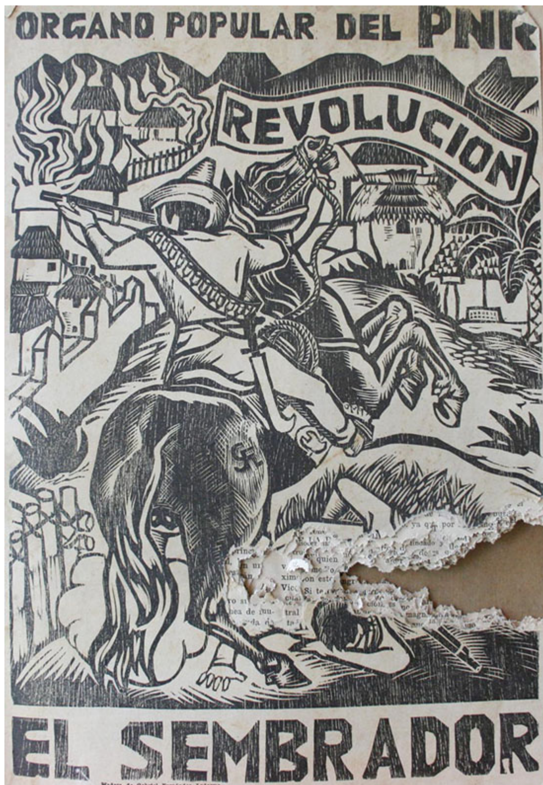
Gabriel Fernández Ledesma (México), Capa de El sembrador , 1930.

Para o povo venezuelano, as seguintes medidas devem ser tomadas: