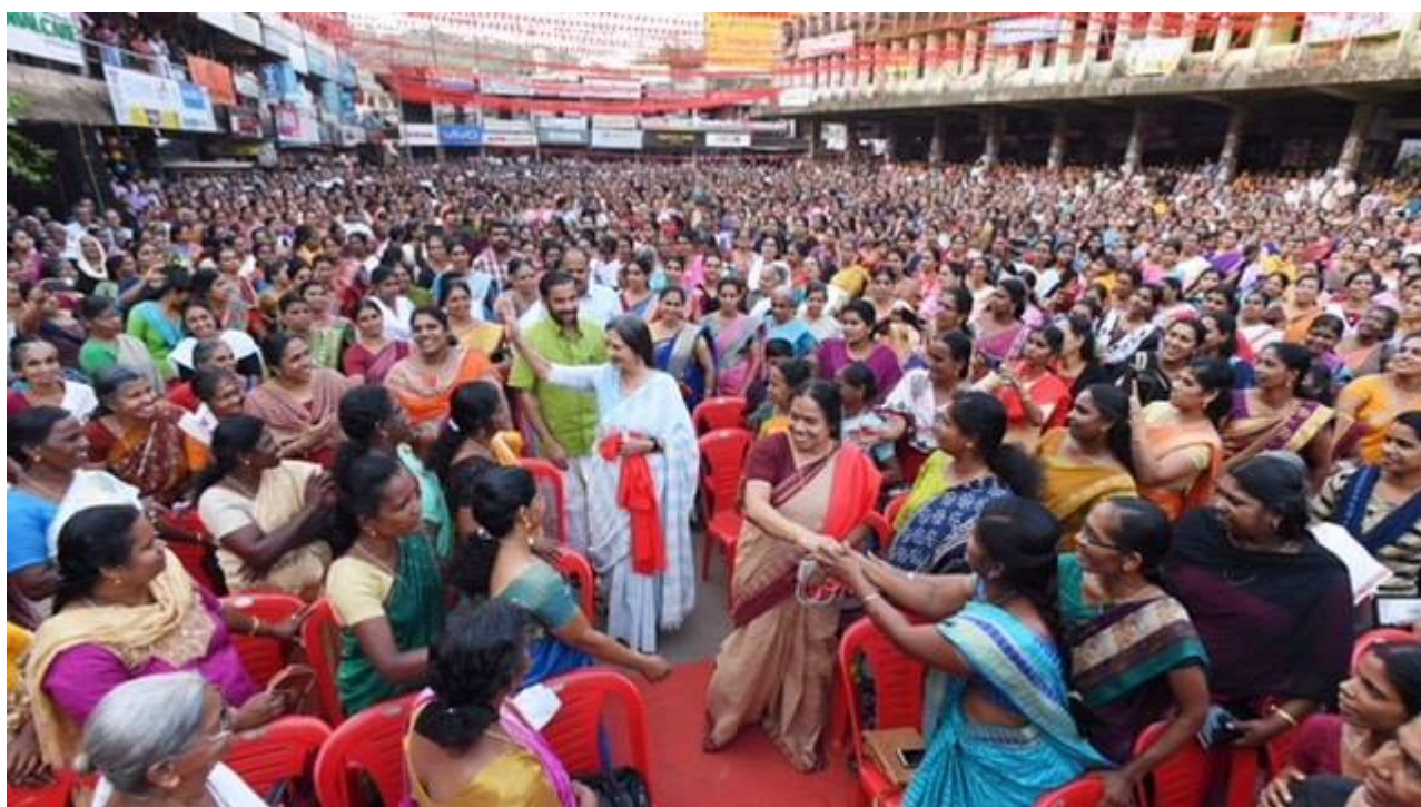
Parlamento das mulheres em Kannur, Kerala, em apoio à Frente Democrática da Esquerda, 12 de março de 2019

A Venezuela apostou na mudança de uma ordem mundial unipolar para uma multipolar. A observação cuidadosa dos desenvolvimentos aqui é essencial, pois nos dirão o quanto a agulha da bússola se afastou do domínio americano dos assuntos mundiais em direção a uma fragmentação do poder. Mas essa fragmentação, essa multipolaridade não surgirá rápido o suficiente. Vai levar seu tempo. E tempo é algo que novos experimentos sociais não têm. Eles são atacados antes de poderem respirar. Essa é a minha avaliação do experimento socialista na Venezuela. Não foi dado tempo suficiente para superar as penalidades do passado colonial e oligárquico. O povo venezuelano deve não apenas lutar para defender sua revolução, mas também lutar para superar os fardos do passado (como a falta de diversidade econômica, imposta pela velha oligarquia). Esse foi o tema de uma entrevista que dei em Caracas no início deste mês.