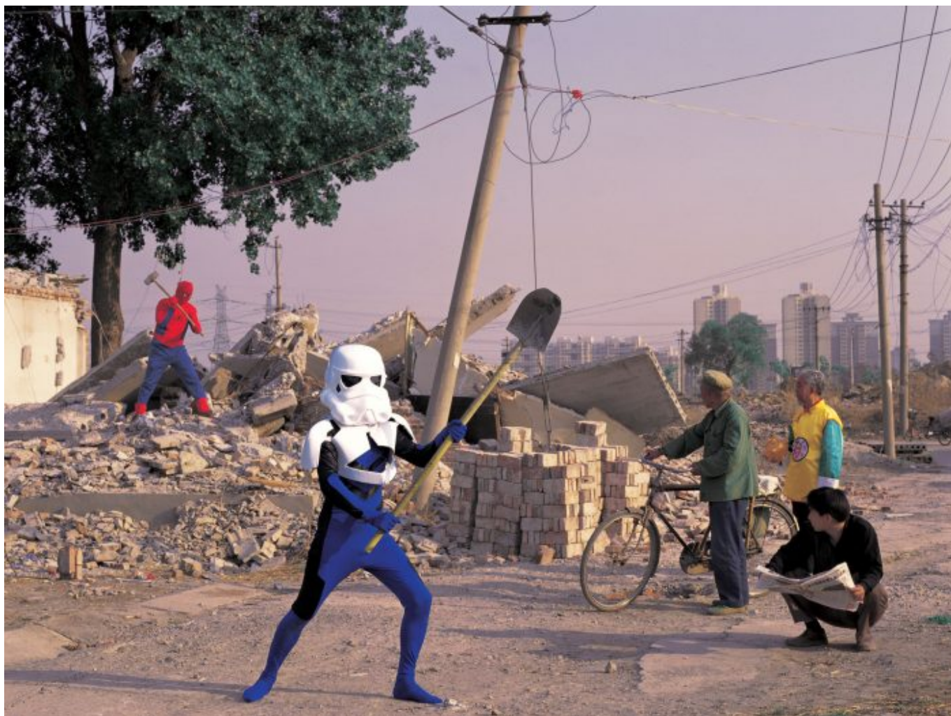
Cao Fei, Housebreaker, 2004

a construção de uma conexão ferroviária que ligará a fronteira de Shalamcheh, no Irã, até o porto sírio de Latakia. Isso é parte do setor iraniano da Iniciativa do Cinturão e Rota, liderada pela China.