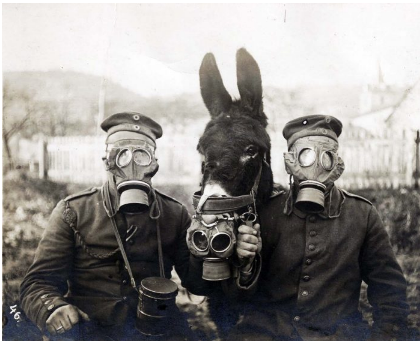
Soldados alemães, uma mula e gás lacrimogêneo (1916)

Diversos pontos relevantes que merecem reflexão surgiram a partir desse estudo da Eurodad :