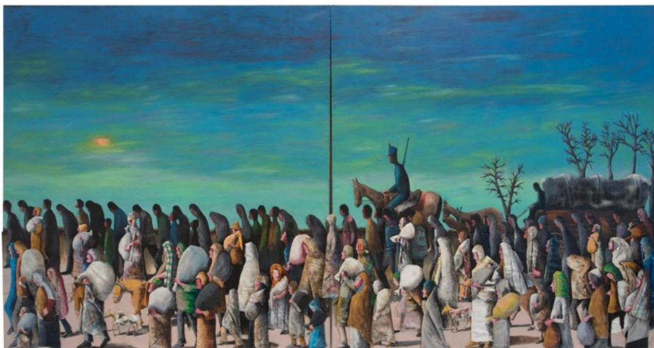
Benny Andrews (EUA), Trail of Tears [Rastro de lágrimas] , 2005.

No Livro dos abraços (1992), nosso amigo Eduardo Galeano escreveu um pequeno fragmento sobre as graves divisões que afligem nosso mundo e cravam uma estaca fria de ferro no coração de nosso sentido de humanidade. Esse fragmento é chamado de “Os ninguéns”: