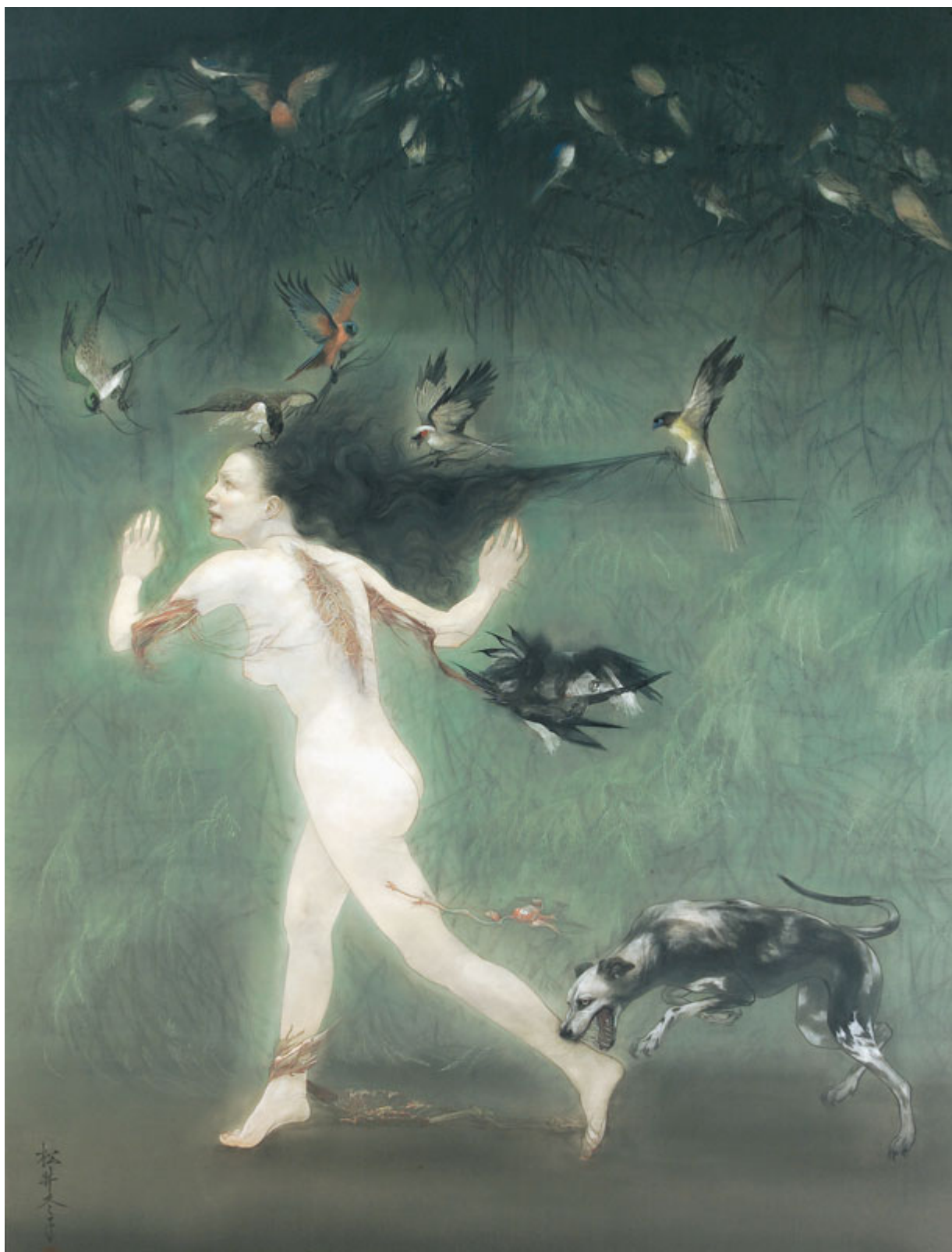
Fuyuko Matsui (Japão), Scattered Deformities in the End [Deformidades dispersas no final], 2007.

O veto foi usado no Conselho de Segurança da ONU quase 300 vezes. Desde 1970, os EUA têm usado esse poder mais do que qualquer um dos outros membros permanentes (China, França, Rússia e Reino Unido).