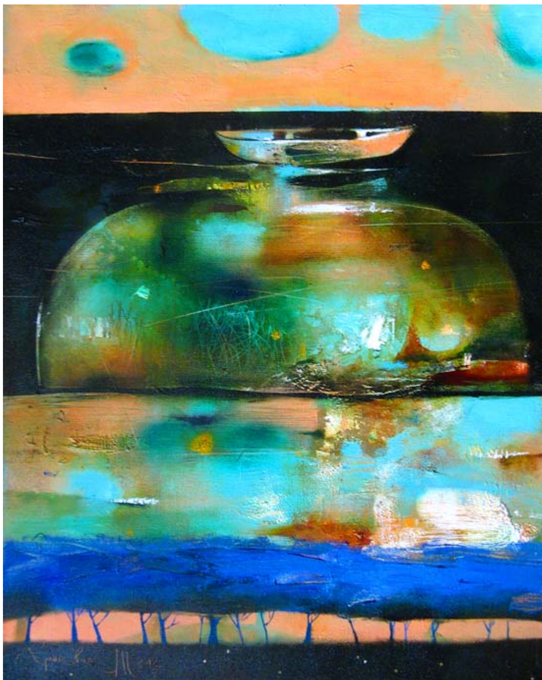
Tatiana Grinevich (Bielorrússia), The River of Wishes [O rio dos desejos], 2012.