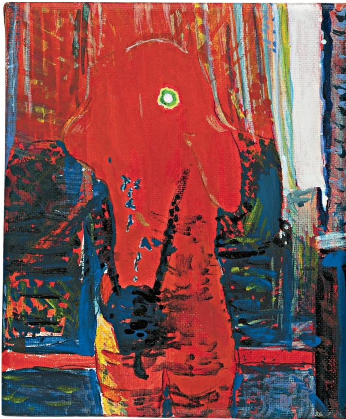
Velislava Gecheva (Bulgária), Homo photographicus , 2014.

Embora vários países – da Albânia ao Uruguai – tenham assinado o documento, outros países que