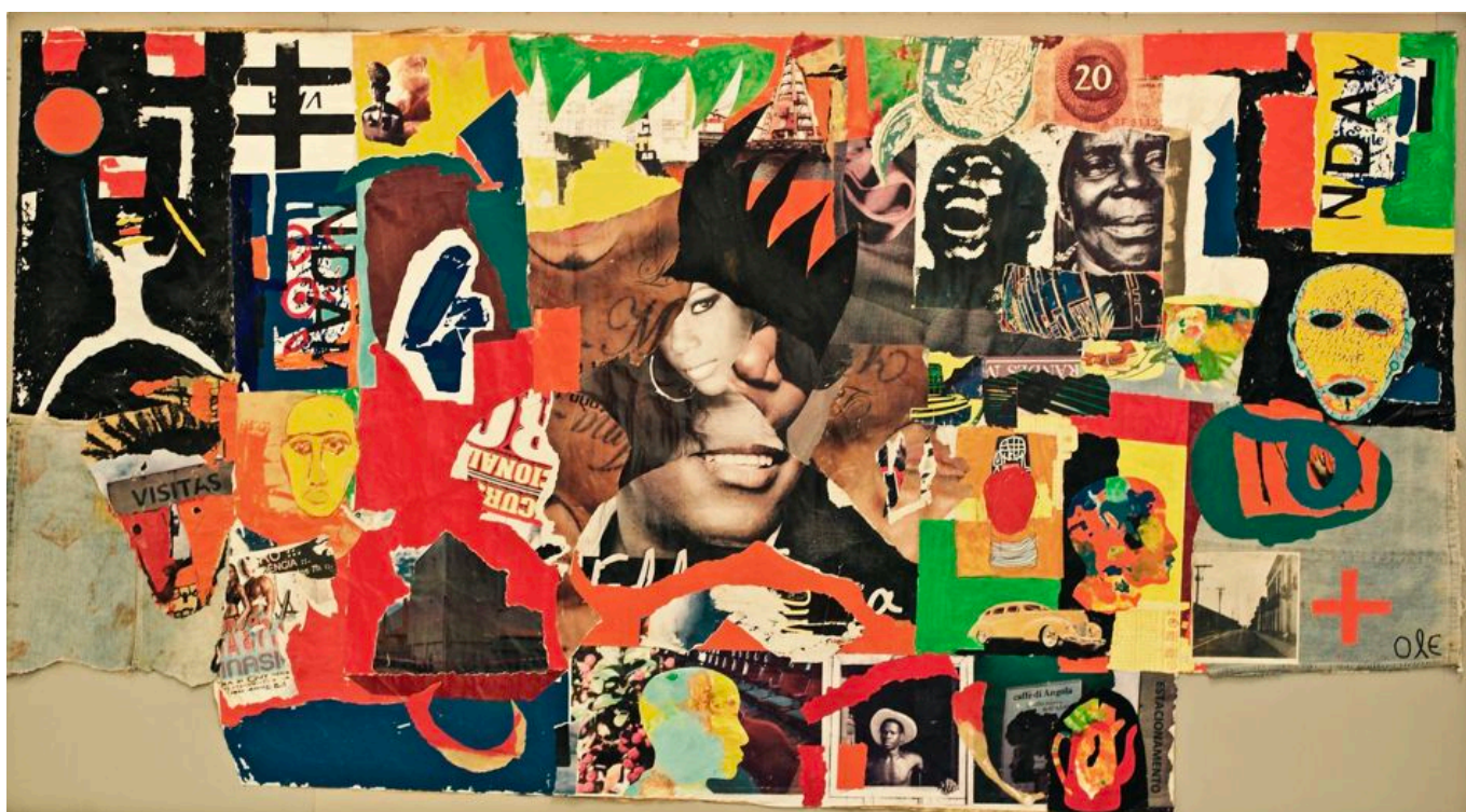
António Ole (Angola), The Maculusso Mural , 2014.