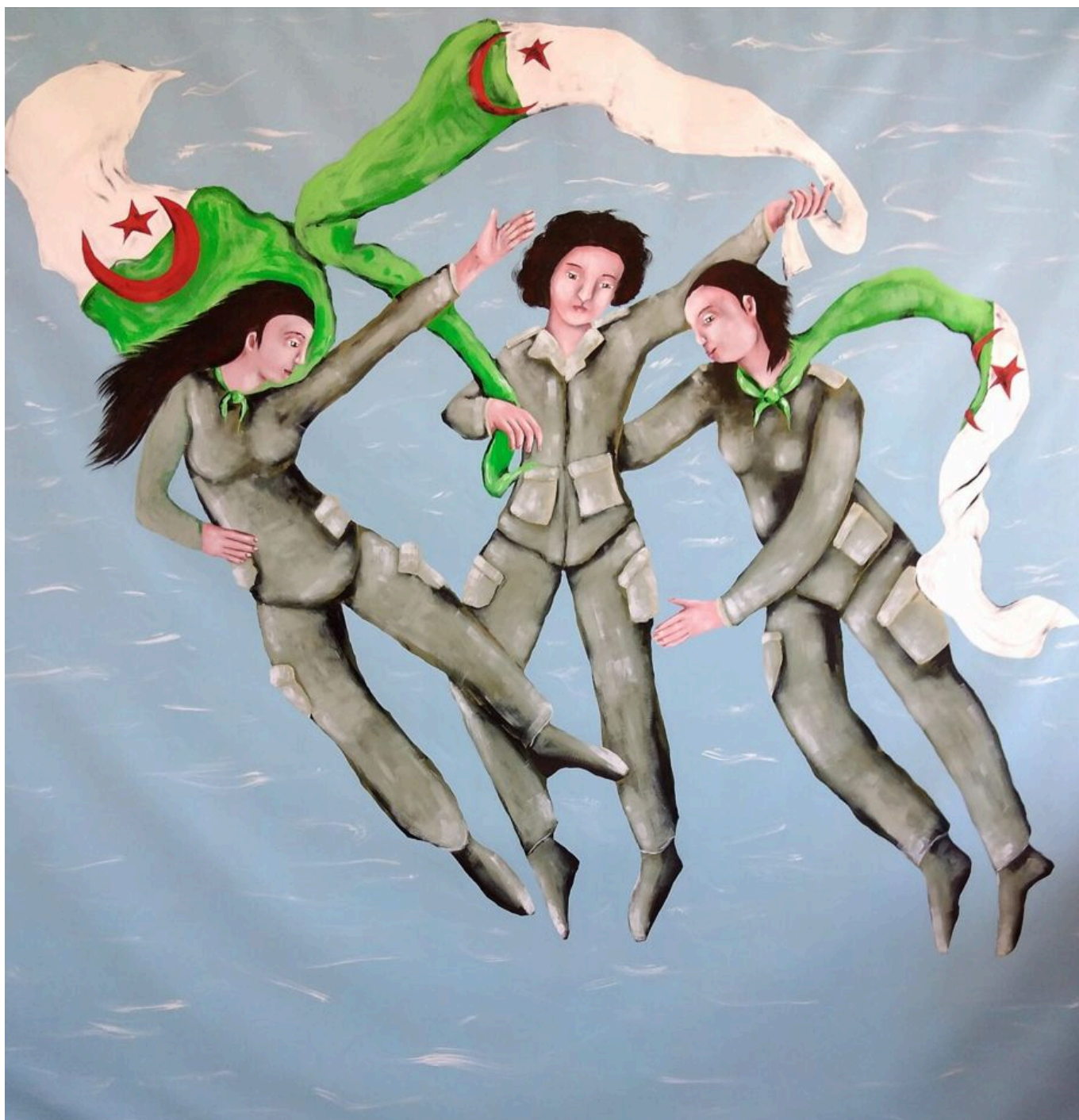
El Meya (Algeria), Les Moudjahidates , 2021.

Em quarto lugar, analisamos o surgimento de novas organizações com raízes no Sul Global, como a Organização de Cooperação de Xangai (2001), o BRICS10 (2009) e o Grupo de Amigos em Defesa da Carta da ONU (2021). Essas plataformas inter-regionais estão em um estágio embrionário, mas fornecem evidências do crescimento de um novo regionalismo e multilateralismo. Embora essas formações não busquem operar como um bloco para combater o bloco do Norte Global, elas refletem o que anteriormente chamamos de um “novo clima” no Sul Global. A nova disposição não é anti-imperialista nem anticapitalista, mas é moldada por quatro vetores principais: