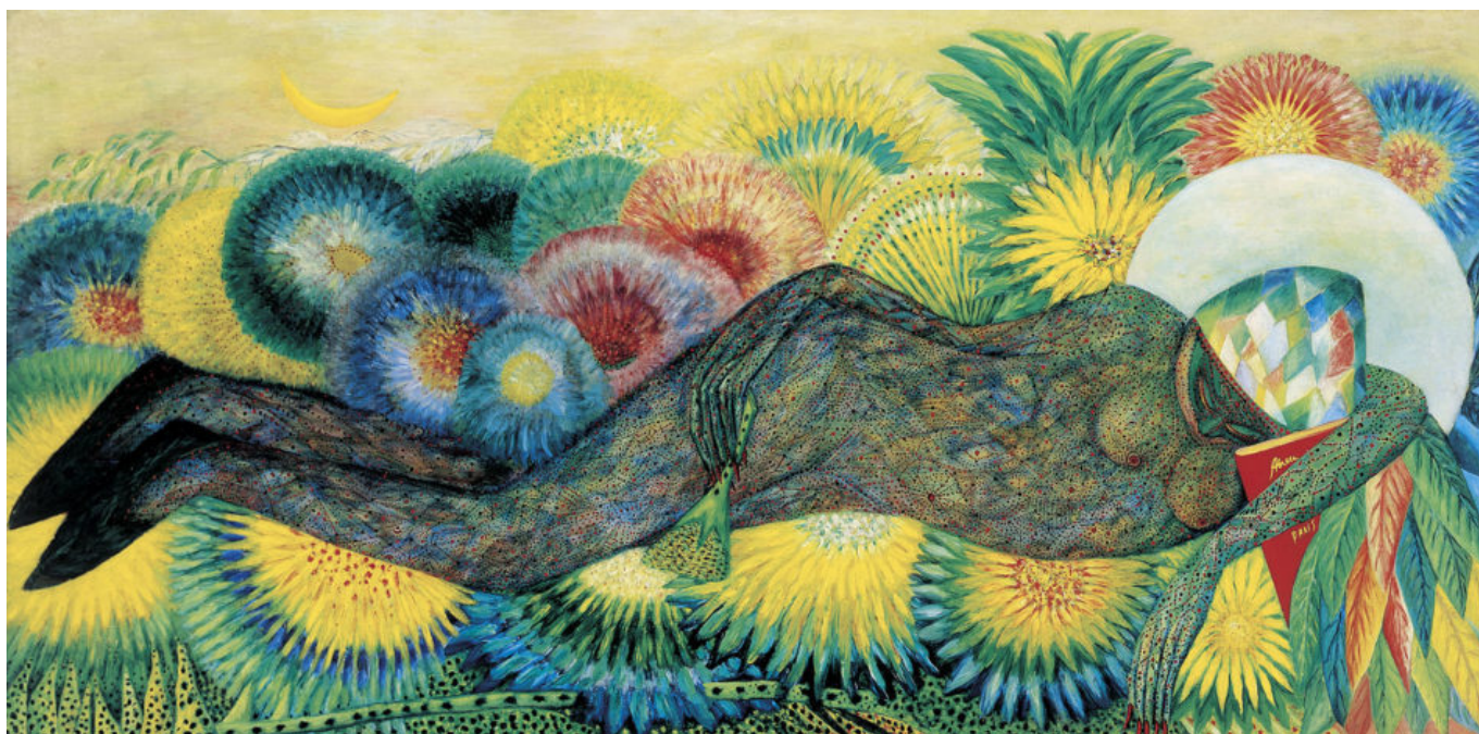
Mario Abreu (Venezuela), Mujer vegetal [Mulher vegetal], 1954.

É claro que há uma linha tênue entre perseguir oponentes políticos e desqualificar aqueles que querem que seu país seja invadido por uma potência estrangeira, nesse caso, “a polícia do mundo”. É verdade que os governos frequentemente menosprezam seus oponentes alegando que eles são agentes de uma potência estrangeira (como a senadora estadunidense Nancy Pelosi fez recentemente com aqueles que, nos Estados Unidos, protestam contra o genocídio de Israel contra os palestinos), chamando-os de agentes da Rússia e pedindo que o FBI os monitore. Machado, no entanto, fez abertamente declarações pedindo que os Estados Unidos invadam a Venezuela, o que em qualquer país seria considerado fora dos limites.