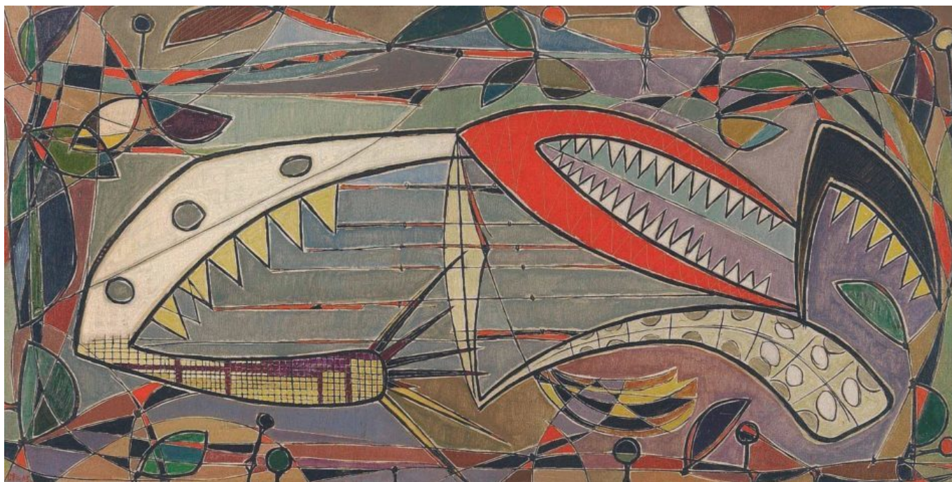
Oswaldo Vigas (Venezuela), Alacrán [O Escorpião], 1952.

De acordo com a nova Constituição, a antiga Suprema Corte da Venezuela – que a oligarquia do país havia usado como um mecanismo para impedir a ocorrência de mudanças sociais importantes – foi substituída pelo Tribunal Supremo de Justiça (TSJ). No decorrer do último quarto de século, o TSJ foi alvo de várias controvérsias, em grande parte decorrentes de intervenções da velha oligarquia, que se recusou a aceitar as grandes mudanças promovidas por Chávez em seus primeiros anos. De fato, em 2002, os juízes do TSJ absolveram os líderes militares que tentaram dar um golpe de Estado contra Chávez, um ato que indignou a maioria dos venezuelanos. Essa interferência contínua acabou levando à expansão da bancada (como o presidente dos EUA, Franklin D. Roosevelt, havia feito em 1937 por motivos semelhantes), bem como a um maior controle legislativo sobre o judiciário, como existe na maioria das sociedades modernas (como nos Estados Unidos, onde a supervisão dos tribunais pelo Congresso é institucionalizada por meio de instrumentos como a “cláusula de exceção”). No entanto, esse conflito sobre o TSJ foi uma das primeiras armas de Washington e da oligarquia venezuelana na tentativa de deslegitimar o governo Chávez.