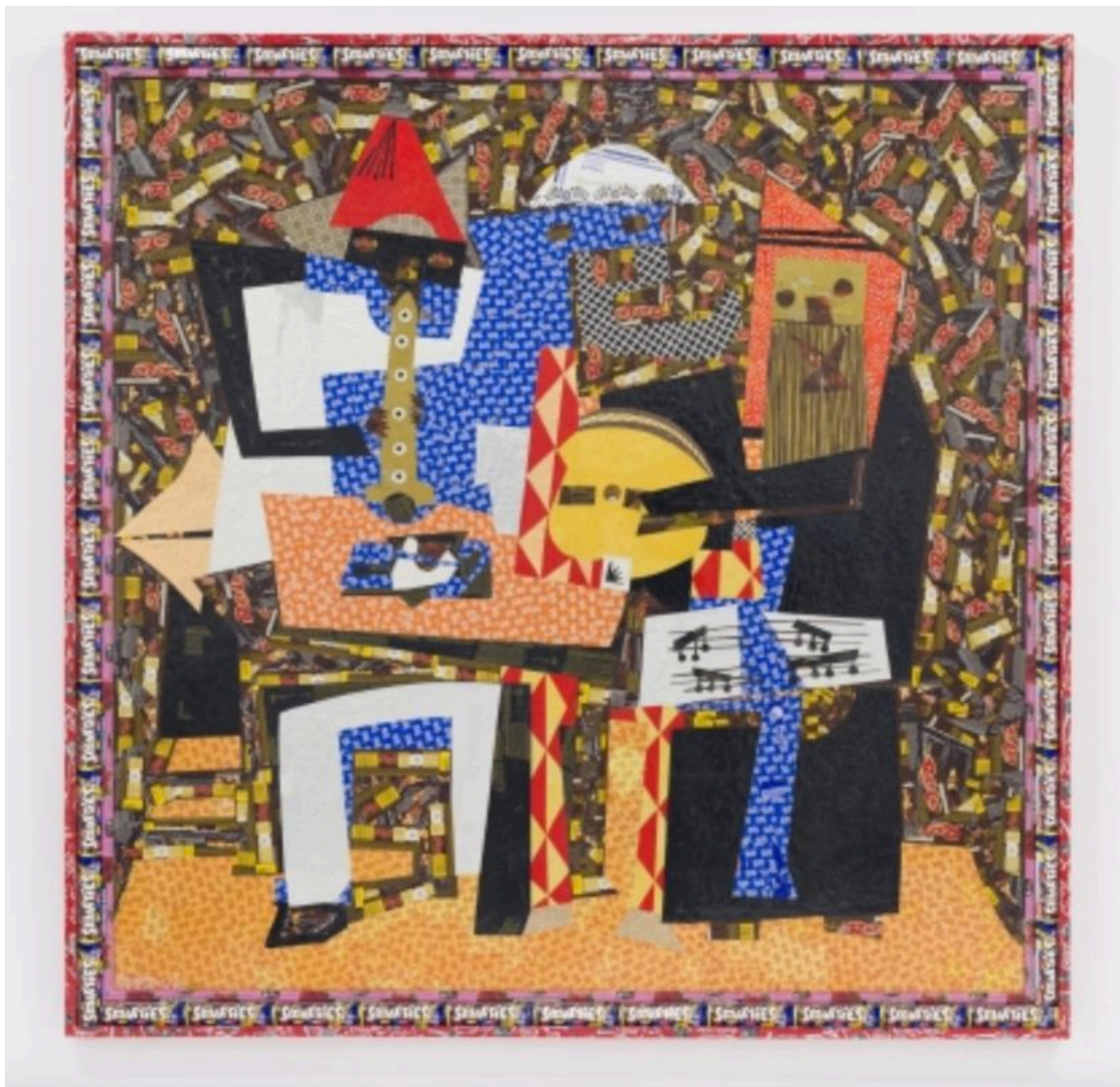
Ghada Al Rabea (Saudi Arabia), Al-Sahbajiea [Amizade] , 2016.

O sistema petrodólar recebeu dois graves golpes sequenciais.