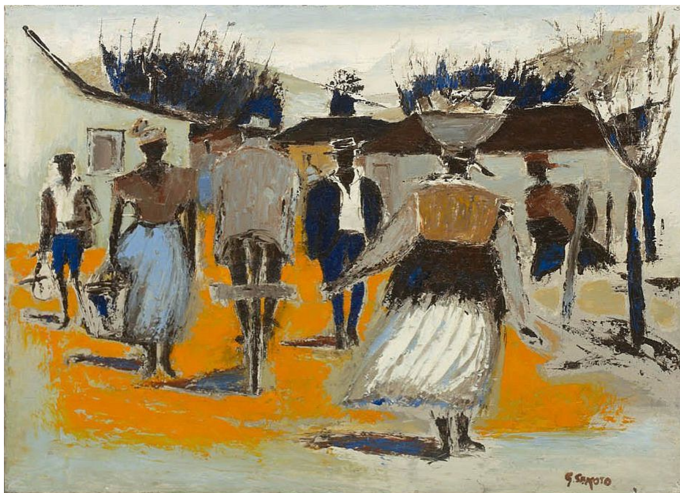
Gerard Sekoto (África do Sul), Rua do Bairro , 1958.

É por isso que reconstruir o poder da classe trabalhadora é a tarefa estratégica que temos pela frente. Isso envolve não apenas alianças eleitorais ou negociações nos bastidores entre as elites, mas uma organização enraizada entre trabalhadores, desempregados, mulheres, estudantes, trabalhadores do setor informal, camponeses e comunidades. A esquerda precisa recuperar as tradições da educação política, da organização democrática de massas, da disciplina coletiva e do internacionalismo. Isso não se trata de caridade entre nações, mas do reconhecimento de que as classes trabalhadoras do mundo enfrentam um inimigo comum: o sistema de acumulação de capital e dominação imperial.