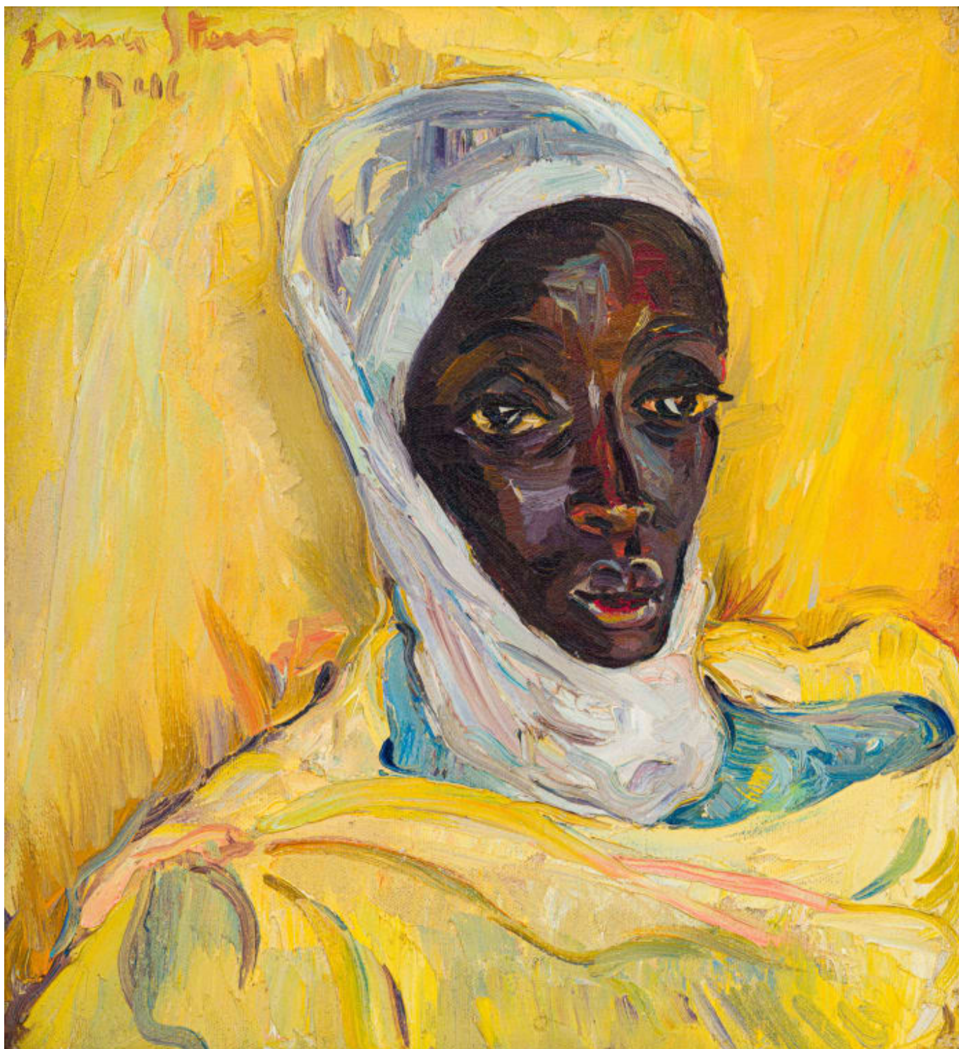
Irma Stern (África do Sul), A esposa do chefe Watussi de amarelo , 1946.

O futuro não será decidido pelos cálculos das elites nem pela benevolência das instituições. A decisão caberá à organização. As classes dominantes estão organizadas globalmente por meio de corporações, bancos, meios de comunicação e alianças militares. Os povos do mundo devem se organizar com a mesma seriedade. Isso exige paciência, clareza ideológica e confiança na política socialista, não como nostalgia, mas como necessidade. A união é essencial. Uma esquerda viva sempre abrigará diferentes tradições e debates, mas devemos reconhecer