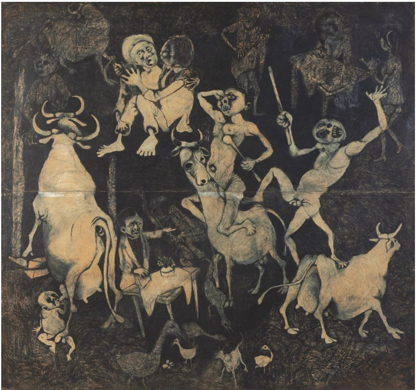
Dumile Feni (África do Sul), Guernica africana , 1967.