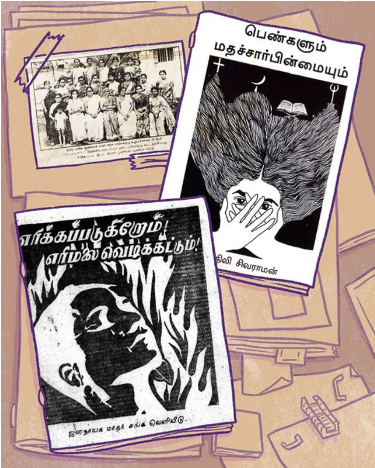
Chandra detalha como a AIDWA projetou as pesquisas, como os ativistas locais as conduziram,