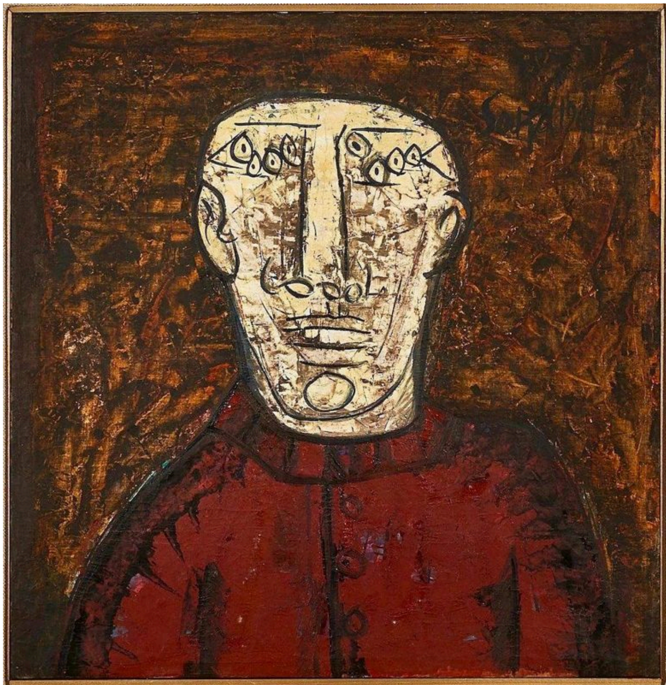
Francis Newton Souza (Índia), The Foreman , 1961.

Os movimentos populares em todo o mundo surgem das queixas e esperanças de trabalhadores/as e camponeses/as, de pessoas que são exploradas e oprimidas pelas hierarquias sociais em nome do acúmulo de capital para poucos proprietários. Se um número suficiente de