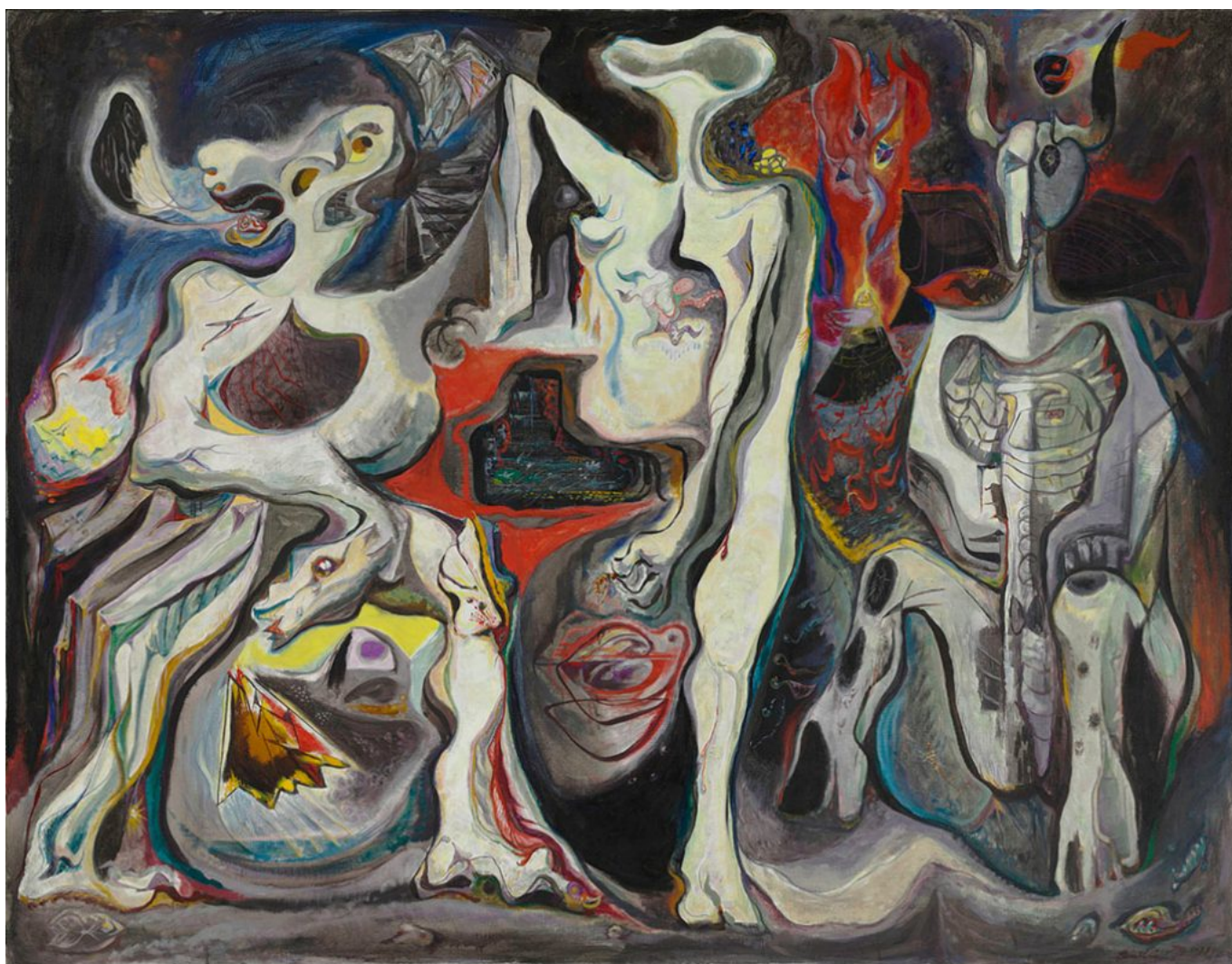
André Masson (França), Não há mundo acabado , 1942.

Cem anos depois, essas palavras de ‘Bomber’ Harris descrevem apropriadamente o tipo de crueldade infligida à Palestina e ao Líbano.