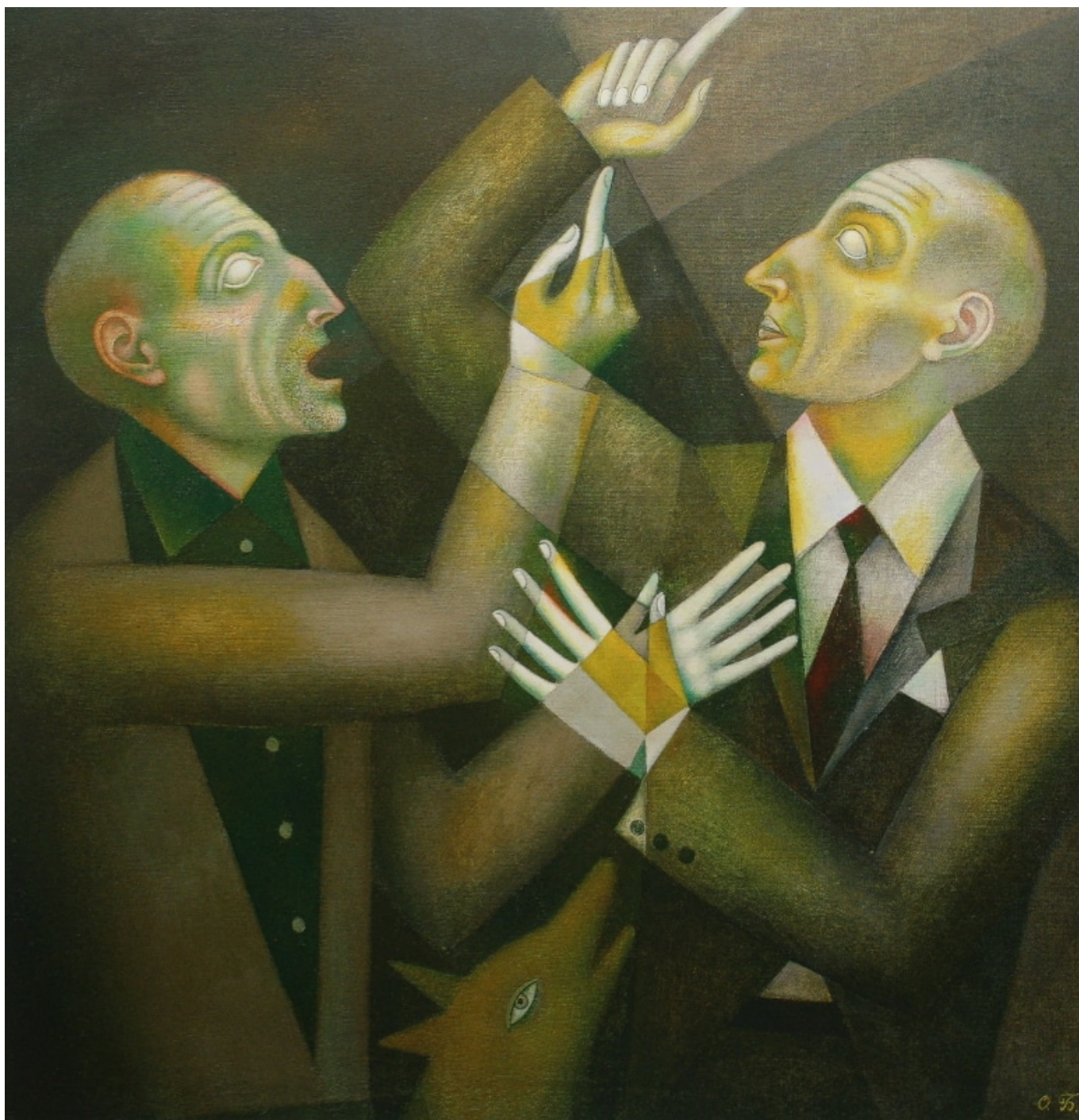
Olga Bulgakova (Rússia), Homens cegos, 1992.

Tese três: emergência sino-russa. Na segunda década dos anos 2000, por diferentes razões, tanto a China quanto a Rússia saíram de sua relativa dormência.