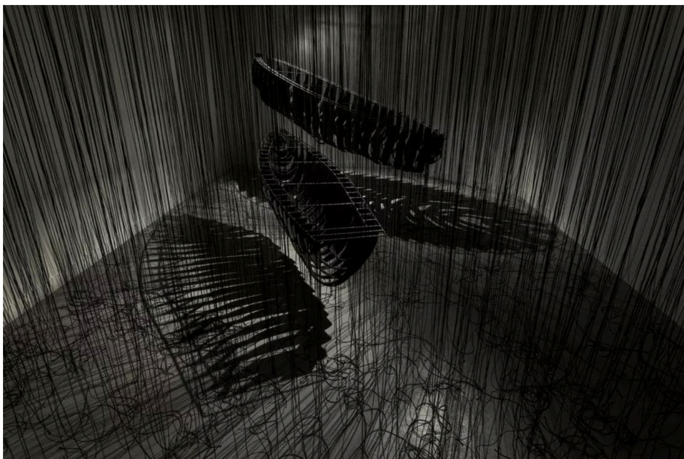
Chiharu Shiota (Japão), Navegando o desconhecido , 2020.