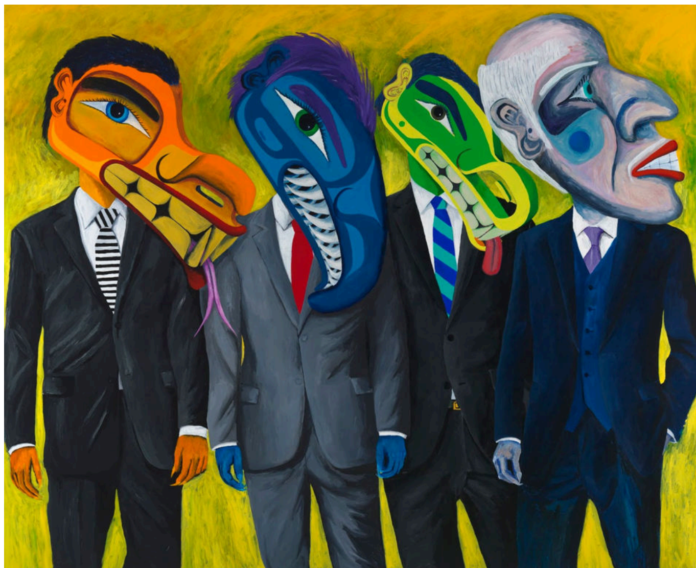
Lawrence Paul Yuxweluptun (Canadá), 0 1%, 2015.

Para entender a situação global atual, aqui estão seis teses sobre o estabelecimento da ordem mundial nos moldes dos EUA a partir de 1990 até a atual fragilidade desta ordem diante do crescente poder russo e chinês. Essas teses são extraídas de nossa análise no dossiê n. 36 (janeiro de 2021), Crepúsculo: A erosão do controle dos EUA e o futuro multipolar ; elas são destinadas para o debate e, portanto, o feedback sobre elas é muito bem-vindo.