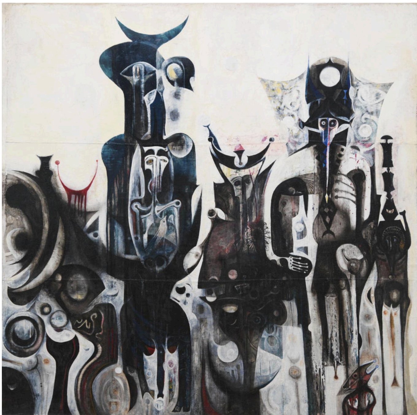
Ibrahim el-Salahi (Sudão), Sons Renascidos dos Sonhos da Infância I , (1961-65).

Tese quatro: Doutrina Monroe Global. Os Estados Unidos tomaram sua Doutrina Monroe de 1823 (que afirmava seu controle sobre as Américas) globalmente e propuseram nesta era pós-soviética que o mundo inteiro fosse seu domínio. Começou a se opor à afirmação da China (o eixo de Obama para a Ásia) e da Rússia (Russiagate e Ucrânia). Essa Nova Guerra Fria impulsionada pelos EUA, que inclui a guerra híbrida por meio de sanções contra trinta países como Irã e Venezuela, desestabilizou o mundo.