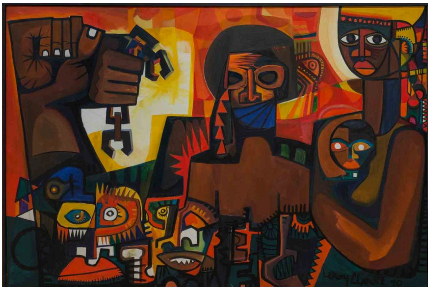
LeRoy Clarke (Trinidad e Tobago), Agora , 1970.