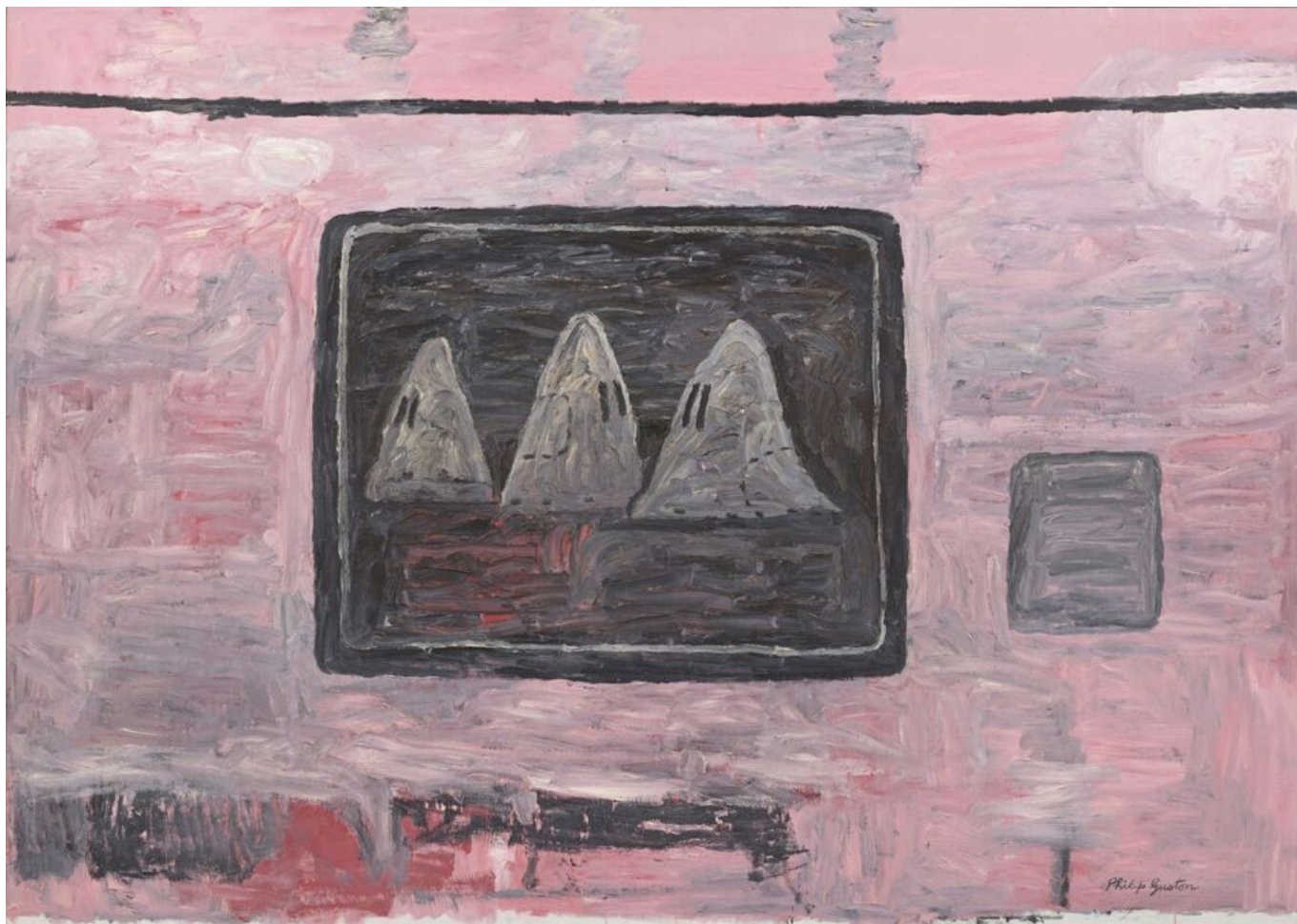
Philip Guston (Canadá), Quadro negro , 1969.