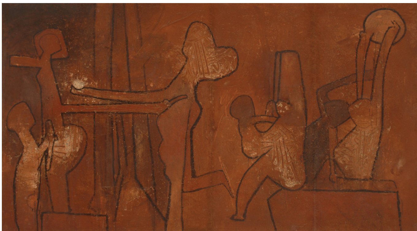
Roberto Matta (Chile), Cuba é a capital , 1963.