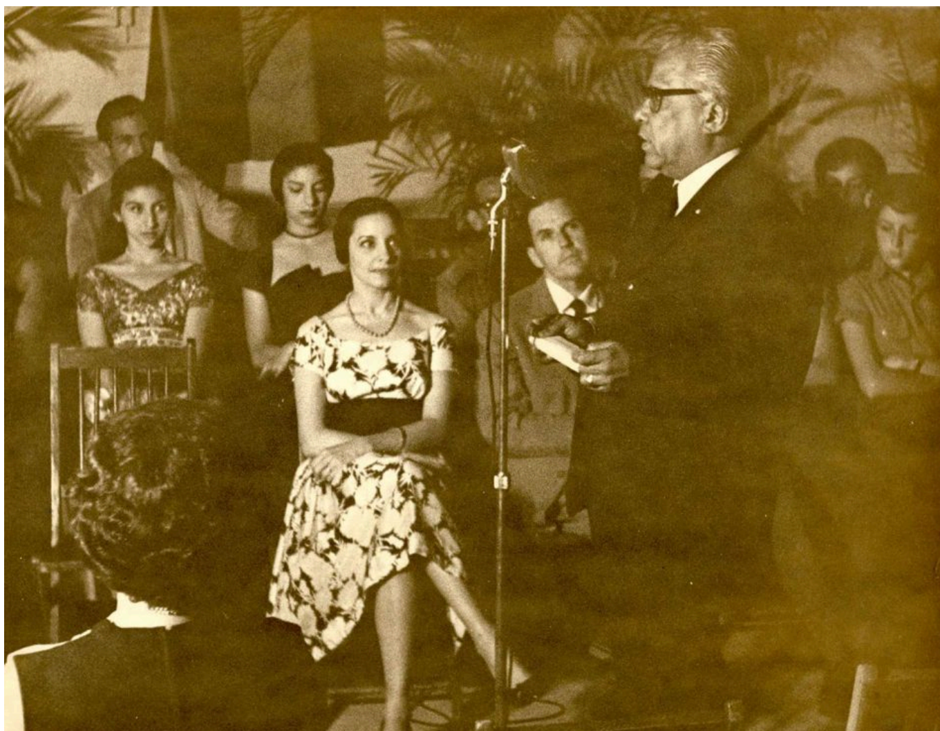
Nicolás Guillén honours Alicia Alonso na União Nacional de Escritores e Artistas de Cuba (Uneac), Havana, 1961.

Nos primeiros anos pós 1959, Cuba foi agitada por surtos de criatividade e experimentação. Nicolás Guillén (1902-1969), grande poeta revolucionário que esteve preso durante a ditadura de Fulgencio Batista, captou a dureza da vida e o grande desejo do processo revolucionário de emancipar o povo cubano da miséria, da fome e das hierarquias sociais. Seu poema “Tengo” [Tenho], de 1964, nos diz que a nova cultura da revolução era elementar – a sensação de que não era preciso curvar os ombros diante de um superior, dizer aos trabalhadores nos escritórios que eles também eram camaradas e não “senhor” e “senhora”, ver um homem negro entrar em um hotel sem ser detido na porta. Seu grande poema anticolonial nos alerta para os fundamentos materiais da cultura: