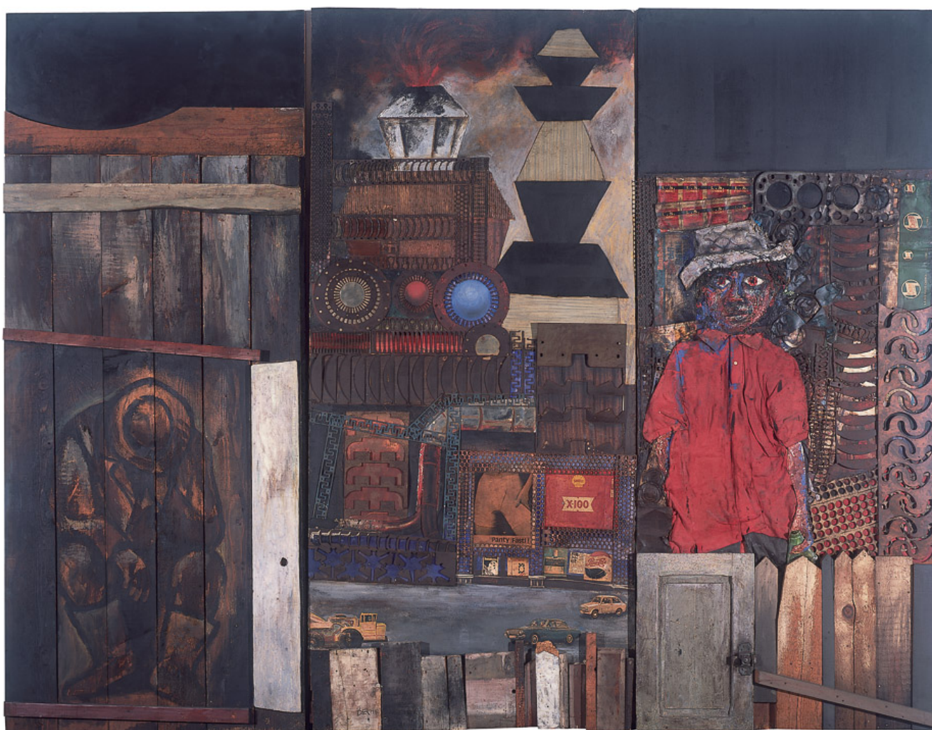
Antonio Berni (Argentina), Juanito Laguna , n.d.

Fidel Castro provocou um debate na década de 1990 em torno do conceito de Batalha de Ideias, a luta de classes no pensamento contra as banalidades das concepções neoliberais sobre a vida humana. Uma parte fundamental dos discursos de Fidel desse período não foi apenas o que ele disse, mas como disse, cada palavra impregnada da grande compaixão de um homem comprometido com a libertação da humanidade dos tentáculos da propriedade, privilégio e poder. Na verdade, a Batalha de Ideias não foi apenas sobre as ideias em si, mas também sobre uma “batalha de emoções”, uma tentativa de mudar o sabor das emoções de uma fixação na ganância para considerações de empatia e esperança.