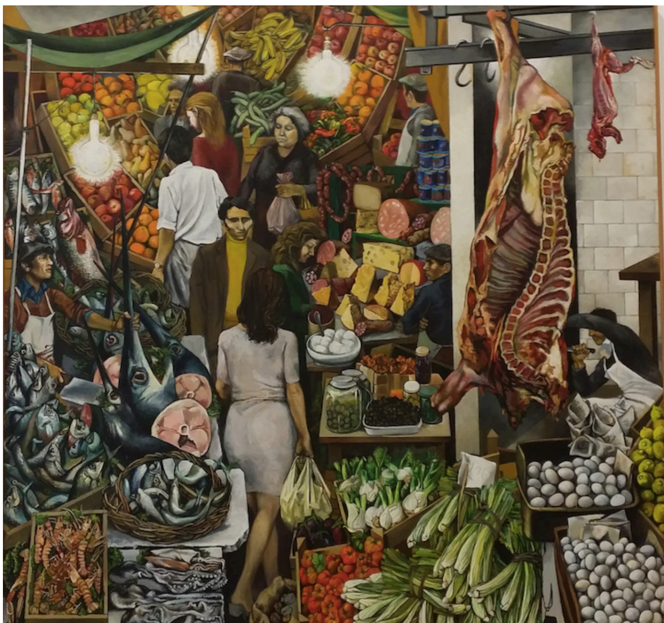
Renato Guttuso (Itália), La Vucciria , 1974.

O Banco Mundial informa que os preços dos alimentos e combustíveis permanecerão em níveis muito altos pelo menos até o final de 2024. Uma vez que os preços do trigo e das oleaginosas aumentaram, relatórios em todo o mundo – inclusive em países ricos – apontam que famílias da classe trabalhadora começaram a pular refeições. Esta preocupante situação alimentar levou a Advogada Especial do Secretário-Geral das Nações Unidas para o Financiamento Inclusivo e Desenvolvimento, Rainha Máxima da Holanda, a prever que muitas famílias passarão a fazer uma refeição por dia, o que, diz ela, “será o fonte de ainda mais instabilidade” no mundo. O Fórum Econômico Mundial acrescenta que estamos no meio de uma “tempestade perfeita” levando em conta o impacto do aumento das taxas de juros nos pagamentos de hipotecas, bem como salários inadequados. A diretora-gerente do Fundo Monetário Internacional (FMI), Kristalina Georgieva-Kinova,