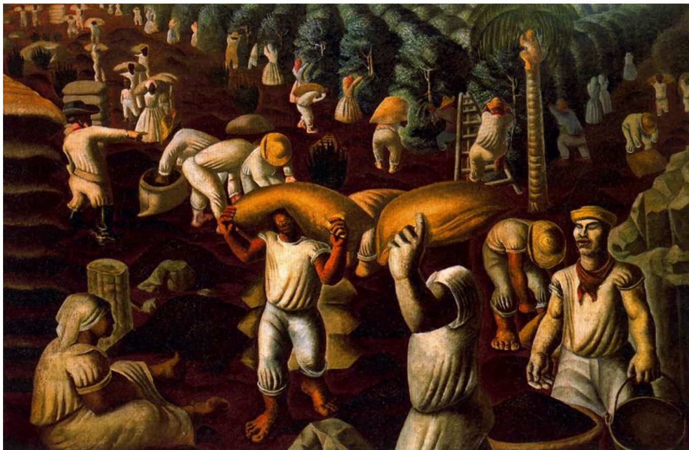
Cândido Portinari (Brasil), Café , 1935.

disse no final do mês passado que o “ horizonte tornou-se sombrio ”.