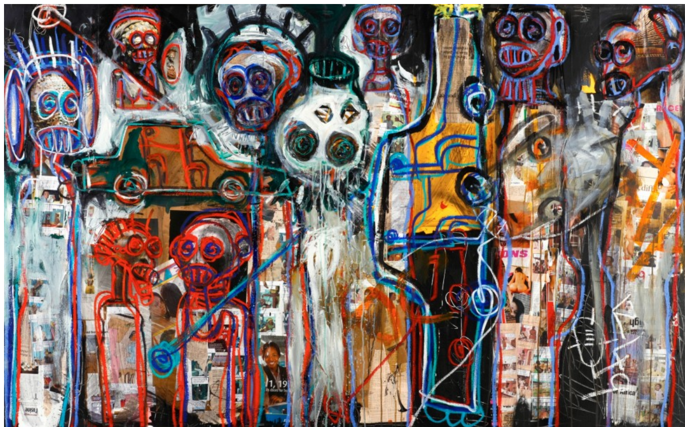
Aboudia (Costa do Marfim), sem título , 2013.

Medonho é o caminho da inflação, mas a inflação é apenas o sintoma de um problema mais profundo e não a causa. Esse problema não é apenas a guerra na Ucrânia ou a pandemia, mas algo que os dados confirmam – sempre negado em coletivas de imprensa: o sistema capitalista, mergulhado em uma depressão de longo prazo, não pode se curar. Ainda este ano, o caderno n. 4 sobre a teoria da crise do Instituto Tricontinental de Pesquisa Social, escrito pelos economistas marxistas Sungur Savran e E. Ahmet Tonak, estabelecerá esses pontos com muita clareza.