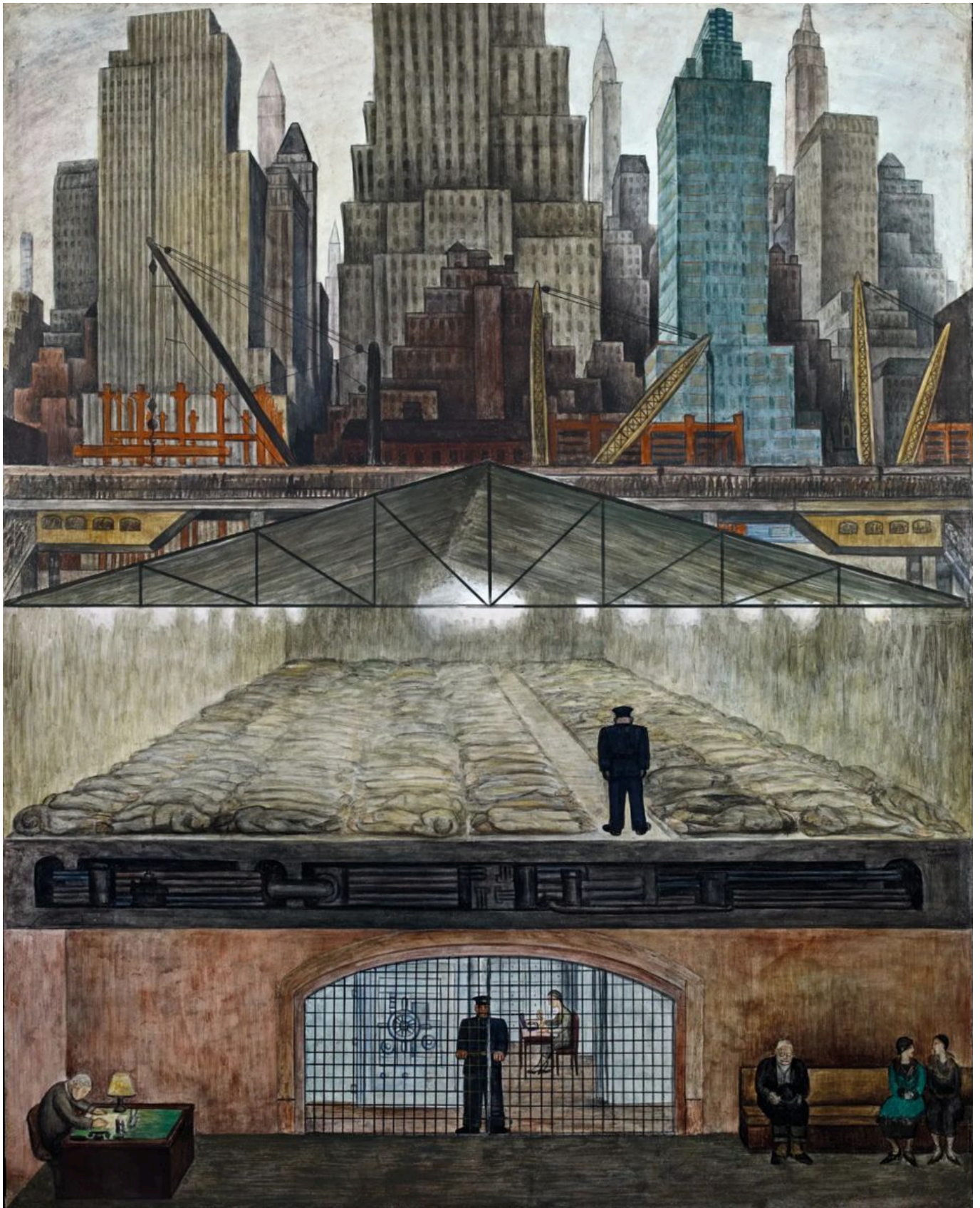
Diego Rivera (México), Bens congelados , 1931.