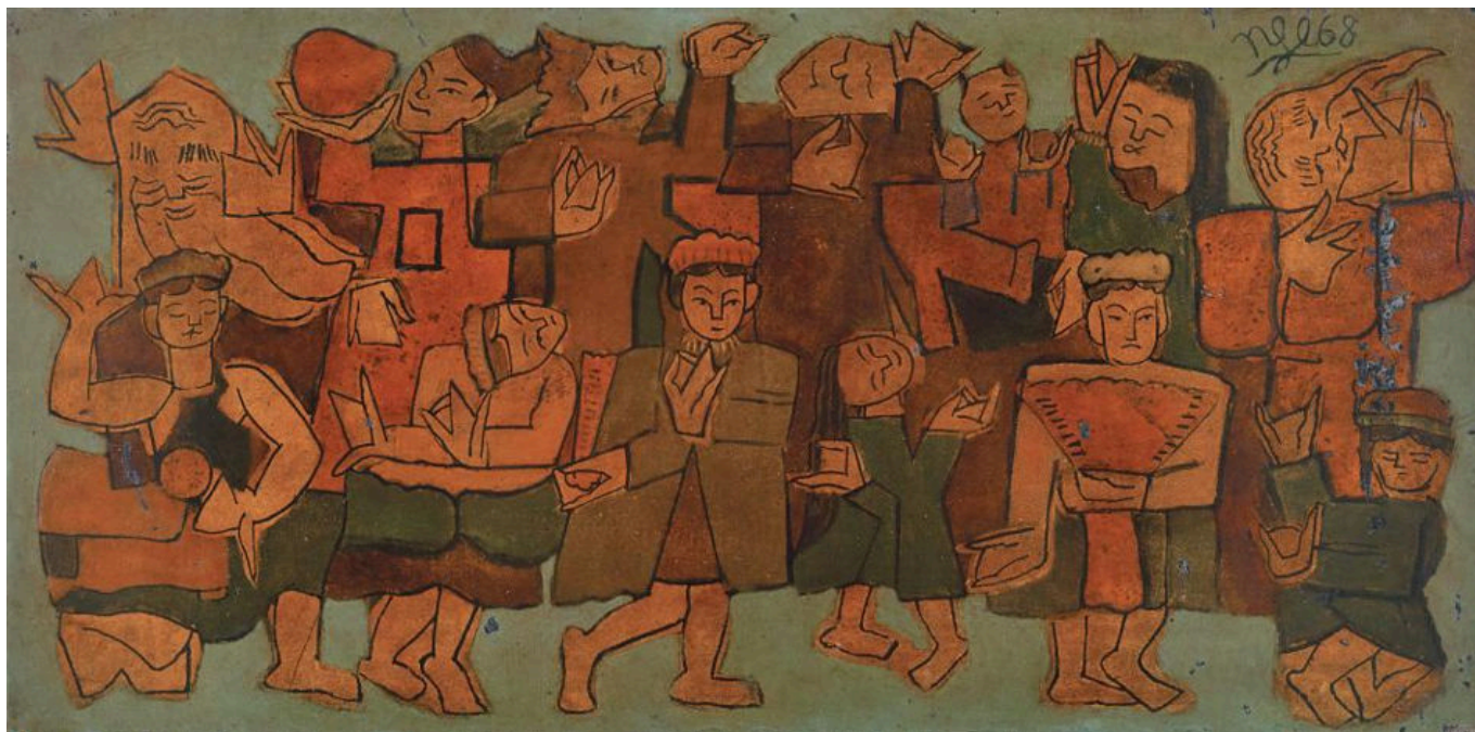
Nguyễn tư Nghiêm (Vietnã), A Dança , 1968.

Em novembro de 2021, o Instituto Tricontinental de Pesquisa Social trabalhou ao lado de 26 institutos de pesquisa para desenvolver Um plano para salvar o planeta . O plano tem muitas seções, cada uma das quais emergiu de um profundo estudo e análise. Uma das seções-chave é a de saúde, com 13 propostas políticas claras: