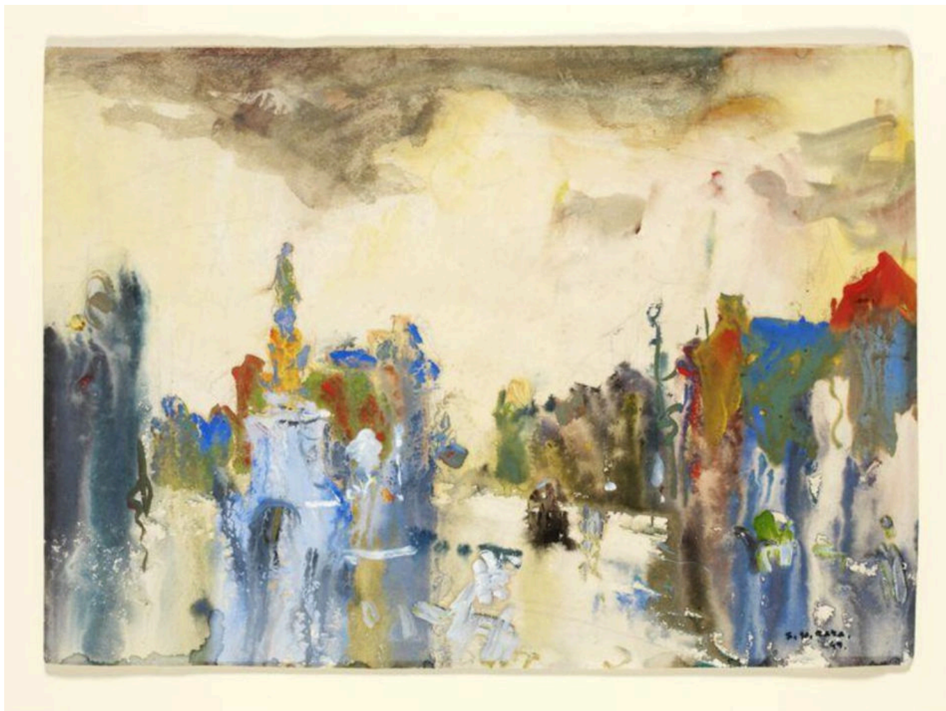
S. H. Raza (Índia), Monção em Bombaim , 1947-49.

Em 5 de maio, a OMS divulgou suas conclusões sobre o número excessivo de mortes causadas pela pandemia de Covid-19. No período de 24 meses dos anos de 2020 e 2021, a OMS estimou o número de mortos da pandemia em 14,9 milhões. Diz-se que um terço dessas mortes (4,7 milhões) ocorreu na Índia , cifra dez vezes maior que o número oficial divulgado pelo governo do primeiro-ministro Narendra Modi, que contestou os números da OMS . Alguém poderia pensar que esses números impressionantes - quase 15 milhões de mortos globalmente em dois anos - seriam suficientes para fortalecer a vontade de reconstruir sistemas de saúde pública esgotados. Mas não.