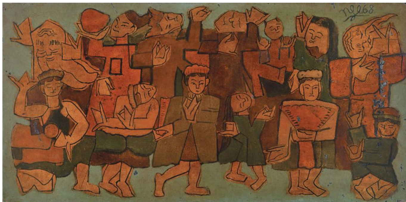
Nguyễn tu Nghiê (Vietnã), A Dança , 1968.

Como parte da Missão Aardram, o governo da Frente Democrática de Esquerda em Kerala criou Centros de Saúde da Família em todo o estado. O governo agora estabeleceu Clínicas pós-Covid nesses centros para diagnosticar e tratar pessoas que sofrem de problemas de saúde de longo prazo relacionados à Covid-19. Essas clínicas foram criadas apesar do pouco apoio do governo central em Nova Délhi. Vários institutos de pesquisa e saúde pública de Kerala proporcionaram avanços em nossa compreensão das doenças transmissíveis e ajudaram a desenvolver novos medicamentos para tratá-las, incluindo o Instituto de Virologia Avançada, o Instituto Internacional de Pesquisa Ayurveda e os centros de pesquisa em biotecnologia e medicamentos farmacêuticos no Bio360 . Tudo isso é justamente a agenda da compaixão que nos dá esperança em relação às possibilidades de um mundo que não está baseado no lucro privado, mas no bem social.