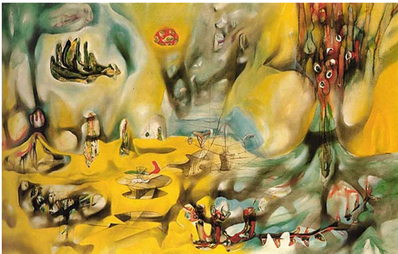
Roberto Matta (Chile), Invasion of the Night , 1942.

O Banco Mundial soou o alarme, mas as forças do “centrismo” – dependentes da classe bilionária e da política de austeridade – simplesmente se recusam a se afastar da catástrofe neoliberal. Se um líder de centro-esquerda ou de esquerda tentar arrancar seu país da desigualdade social persistente e da distribuição polarizada de riqueza, ele enfrentará a ira não apenas dos “centristas”, mas também dos ricos detentores de títulos do Norte, do Fundo Monetário Internacional, e os Estados ocidentais. Quando Pedro Castillo conquistou a presidência no Peru em julho de 2021, ele não teve permissão para buscar nem mesmo uma forma escandinava de social-democracia; as maquinações do golpe contra ele começaram antes de sua posse. A política civilizada que acabaria com a fome e o analfabetismo simplesmente não é permitida pela classe bilionária, que gasta grandes quantias de dinheiro em think tanks e mídia para minar qualquer projeto de decência e financiar as perigosas forças da extrema direita, que transferem a culpa do caos social para bem longe dos ultra-ricos isentos de impostos e do sistema capitalista e a joga no colo dos pobres e marginalizados.