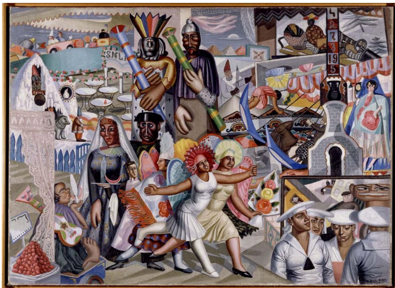
Maruja Mallo (Espanha), La Verbena (A verbena), 1927.