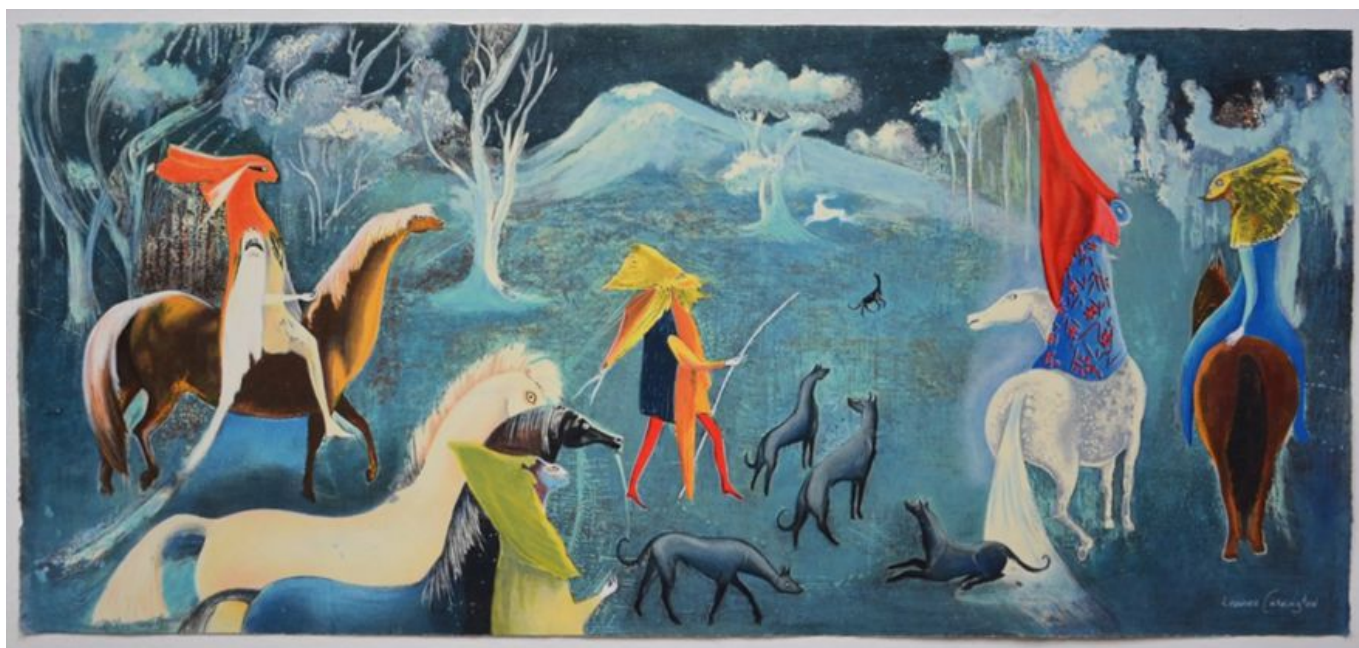
Leonora Carrington (México), Figuras fantásticas a caballo (Figuras fantásticas a cavalo), 2011.

Depois que a União Soviética entrou em colapso em 1991 e o Projeto do Terceiro Mundo murchou como resultado da crise da dívida, prevaleceu uma agenda de globalização neoliberal liderada pelos EUA. Esse programa foi caracterizado pela retirada do Estado da regulação do capital e pela erosão das políticas de bem-estar social. O quadro neoliberal teve duas grandes consequências: primeiro, um rápido aumento da desigualdade social, com o crescimento dos bilionários em um pólo e o crescimento da pobreza no outro, juntamente com uma exacerbação da desigualdade entre Norte-Sul; e, segundo, a consolidação de uma força política “centrista” que fingia que a História e, portanto, a política havia acabado, restando apenas a administração (que no Brasil é bem chamada de centrão ). A maioria dos países ao redor do mundo foi vítima tanto da agenda de austeridade neoliberal quanto dessa ideologia do “fim da política”, que se tornou cada vez mais antidemocrática, defendendo que os tecnocratas estivessem no comando. No entanto, essas políticas de austeridade, cortando no osso da humanidade, criaram sua própria nova política nas ruas, uma tendência que foi prenunciada pelas revoltas contra o FMI e contra a fome na década de 1980 e mais tarde se fundiram nos protestos “antiglobalização”. A agenda de globalização imposta pelos Estados Unidos produziu novas contradições que desmentiram o argumento de que a política havia acabado.