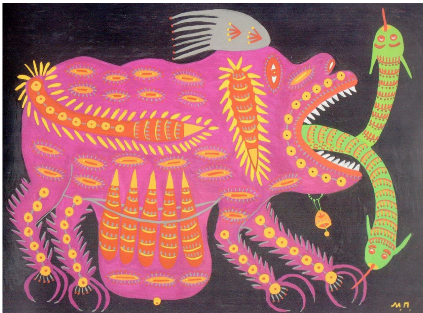
Maria Prymachenko (Ucrânia), Que a guerra nuclear seja amaldiçoada! , 1978.

Desde o início da década de 1960, o representante do México nas Nações Unidas, Alfonso García Robles, liderou a luta para desenvolver uma ZLAN nas Américas. Se essas zonas regionais forem criadas e expandidas, disse García Robles na ONU em 1974, eventualmente a área “de onde as armas nucleares são proibidas [chegará] a um ponto em que os territórios das Potências que possuem essas terríveis armas de destruição em massa se tornarão algo como ilhotas contaminadas sujeitas a quarentena”. García Robles falou com o prestígio concedido ao México por sua liderança na aprovação do Tratado de Tlatelolco em 1967. Este tratado criou a primeira ZLAN, que incluiu 33 dos 35 países do hemisfério americano ; apenas o Canadá e os Estados Unidos permaneceram fora da zona.