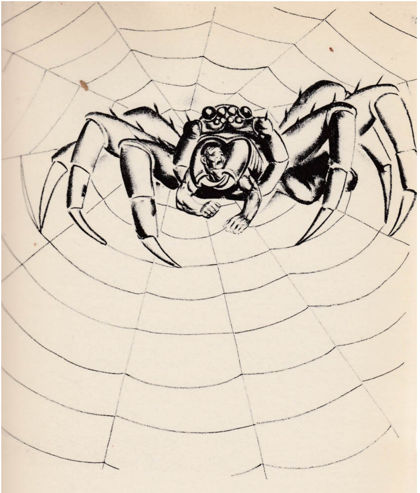
Hugo Gellert (EUA), Comrade Gulliver [Camarada Gulliver] , 1935.

Estar preocupado com a desigualdade é insuficiente. Uma série de possíveis reformas fundadas no bom senso estão sendo exigidas por organizações populares em todo o mundo, que incluem: