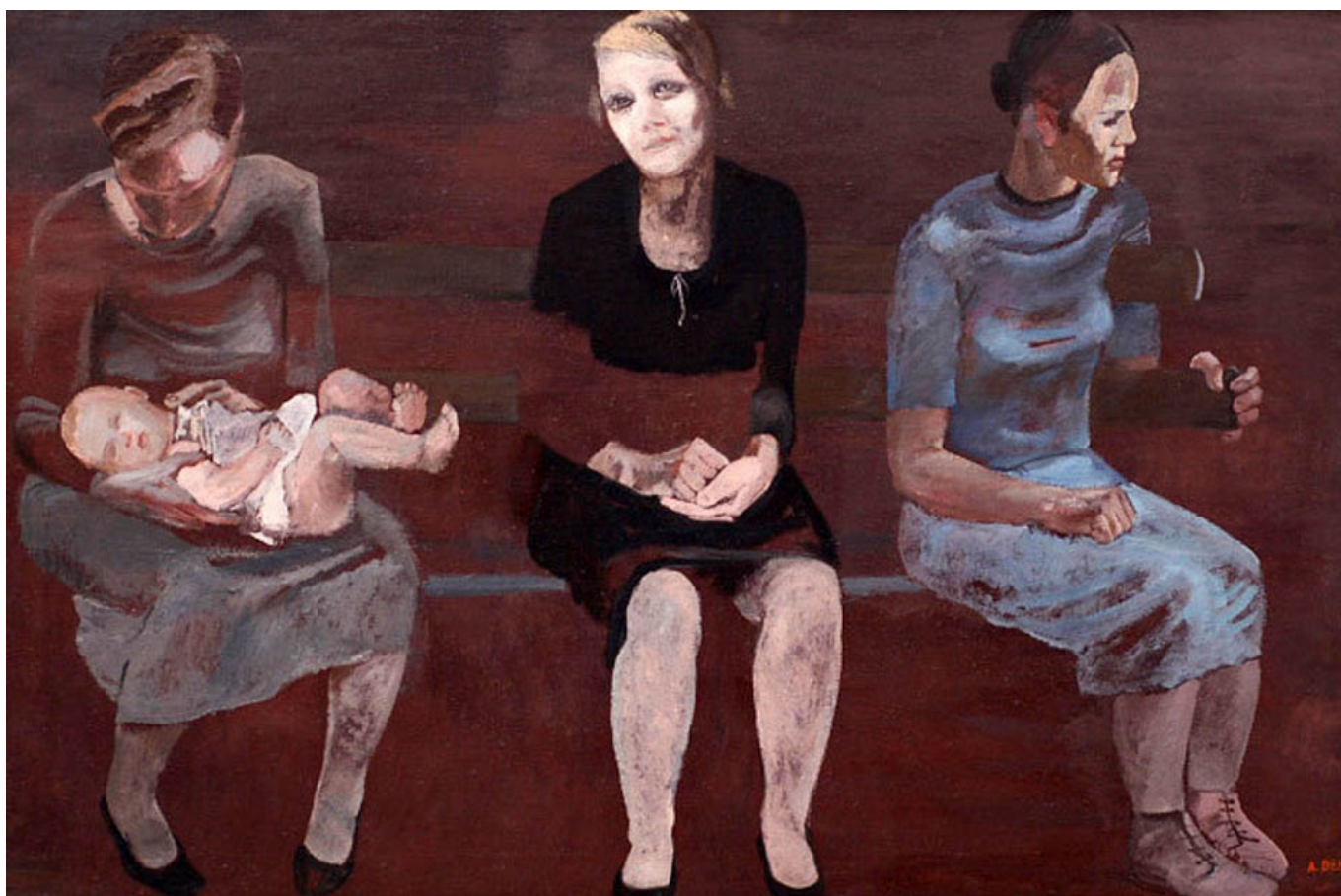
Aleksandr Deyneka (USSR), Unemployed in Berlin [Desempregado em Berlim] , 1932.

“E com a pandemia”, escrevem os analistas do Banco Mundial, “os novos pobres têm mais probabilidade de viver em ambientes urbanos congestionados e de trabalhar nos setores mais afetados por isolamentos e restrições de mobilidade; muitos estão em serviços informais e não são contemplados pelas redes de proteção social existentes”. Esses são os bilhões que irão afundar cada vez mais em dívidas e desespero, com a educação e a saúde indo embora ao mesmo tempo que as taxas de fome aumentam.