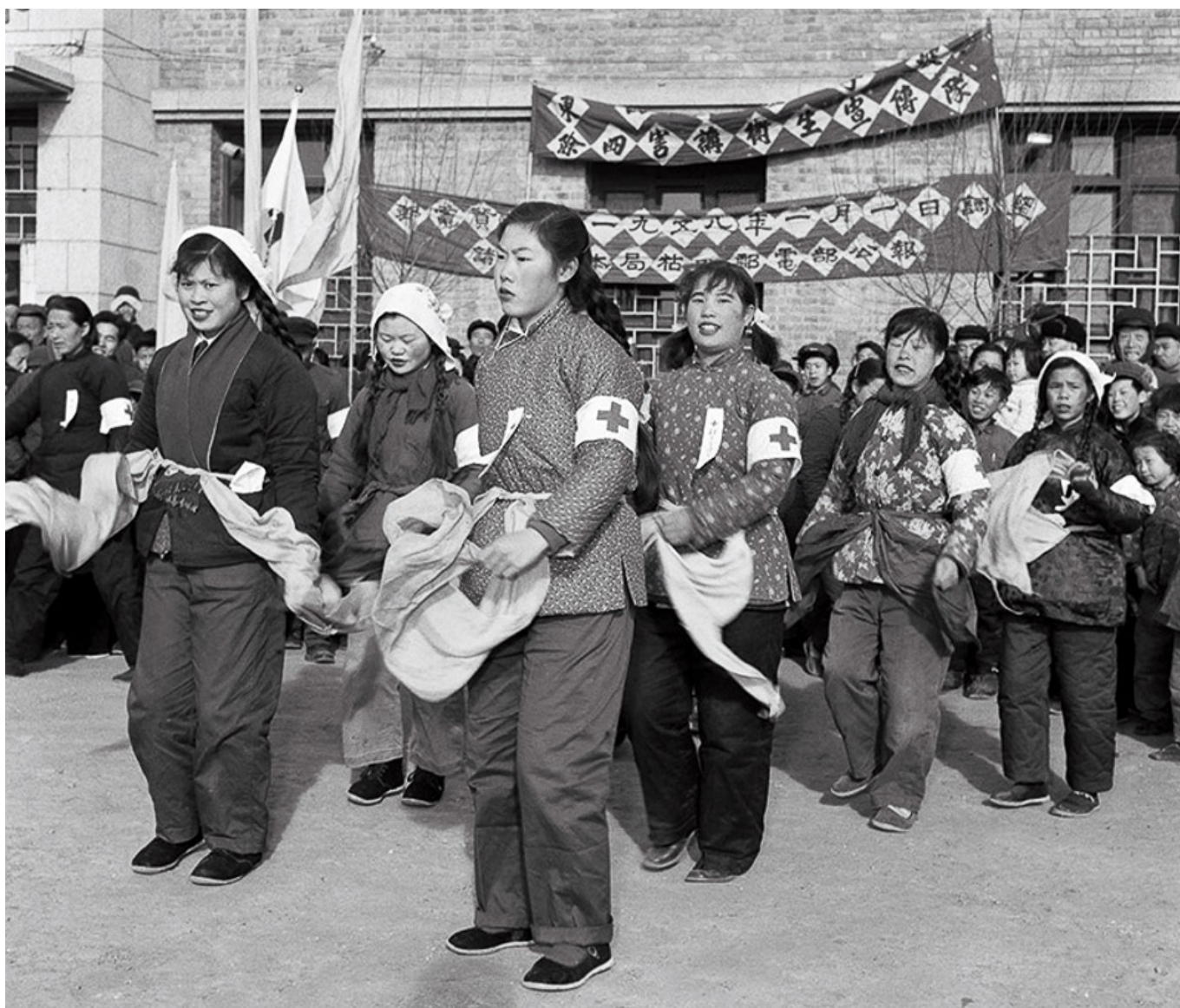
Equipe da saúde pública de eliminação das "quatro pestes", China, 1958.