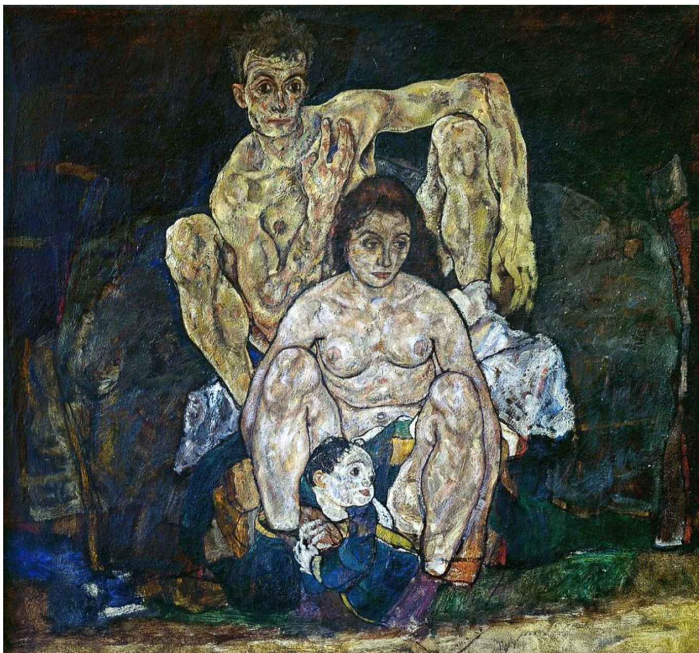
Egon Schiele (Áustria), The Family [A família], 1918.

É uma boa notícia que agora existam vacinas candidatas de uma série de empresas e países, incluindo duas que utilizam a tecnologia RNA – Pfizer (EUA) e Moderna (EUA) -, bem como a Sputnik V (Gamaleya – Rússia) e a CoronaVac (Sinovac – China). Estudos dessas e de outras candidatas mostram resultados positivos, o que aumenta a esperança de que em breve teremos alguma vacina disponível. Cientistas, porém, estão preocupados com as afirmações feitas por empresas farmacêuticas privadas, por meio de declarações à imprensa, mas sem tornar públicas as descobertas de seus ensaios clínicos. Algumas dessas questões incluem se as vacinas previnem a infecção, a mortalidade, a transmissão e, finalmente, qual seria a duração da proteção.