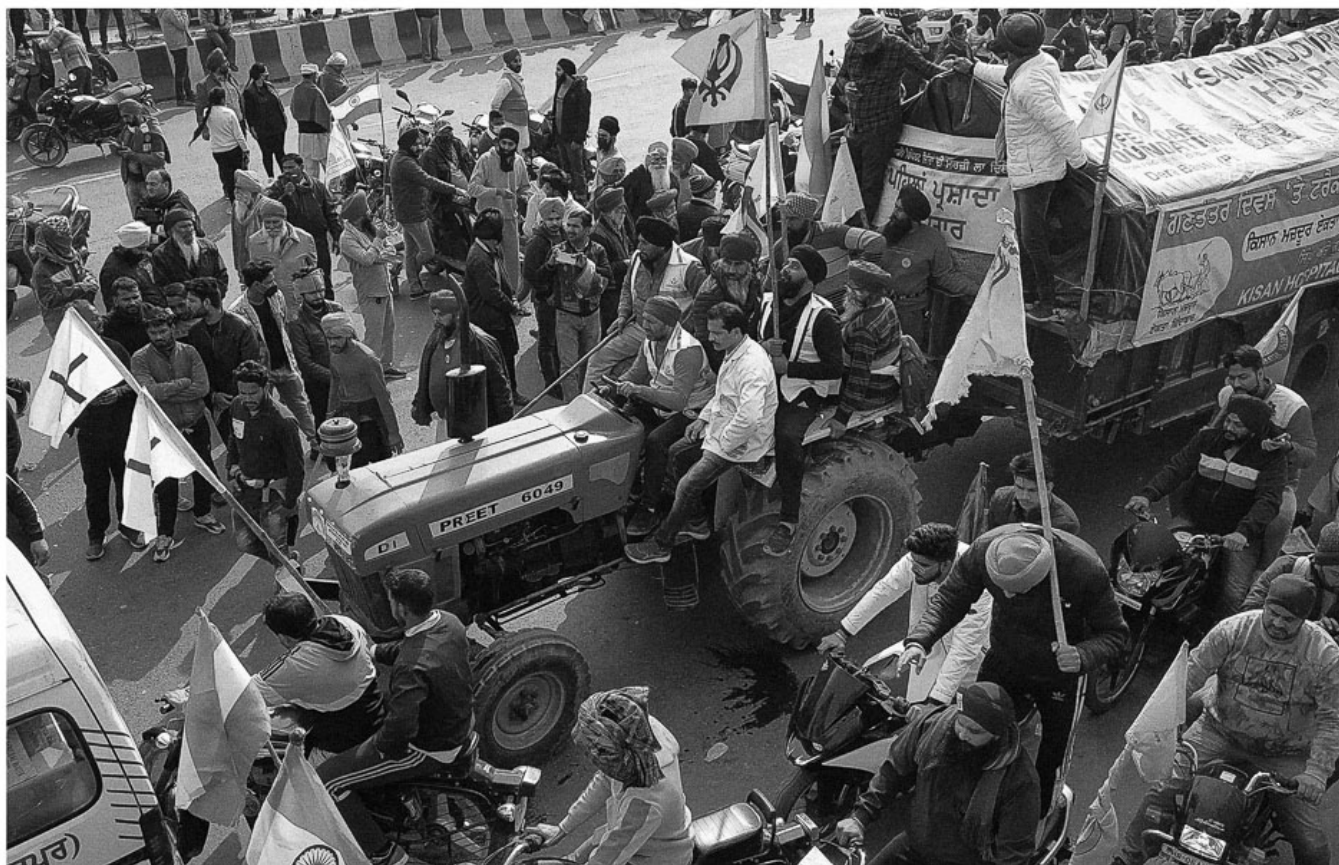
Um trator na rodovia GT Karnal rompe as barricadas e entra em Delhi, iniciando um confronto entre os manifestantes e a polícia, 26 de janeiro de 2021.

Muitas lutas prementes permanecem, incluindo a luta por uma lei que garanta um preço mínimo de apoio que seja uma vez e meia o custo de produção para todas as safras de todos os agricultores. O fracasso em resolver isso, observa o AIKS, “agravou a crise agrária e levou ao suicídio de mais de 400 mil agricultores nos últimos 25 anos”. Um quarto dessas mortes ocorreu sob a liderança de Modi nos últimos sete anos.