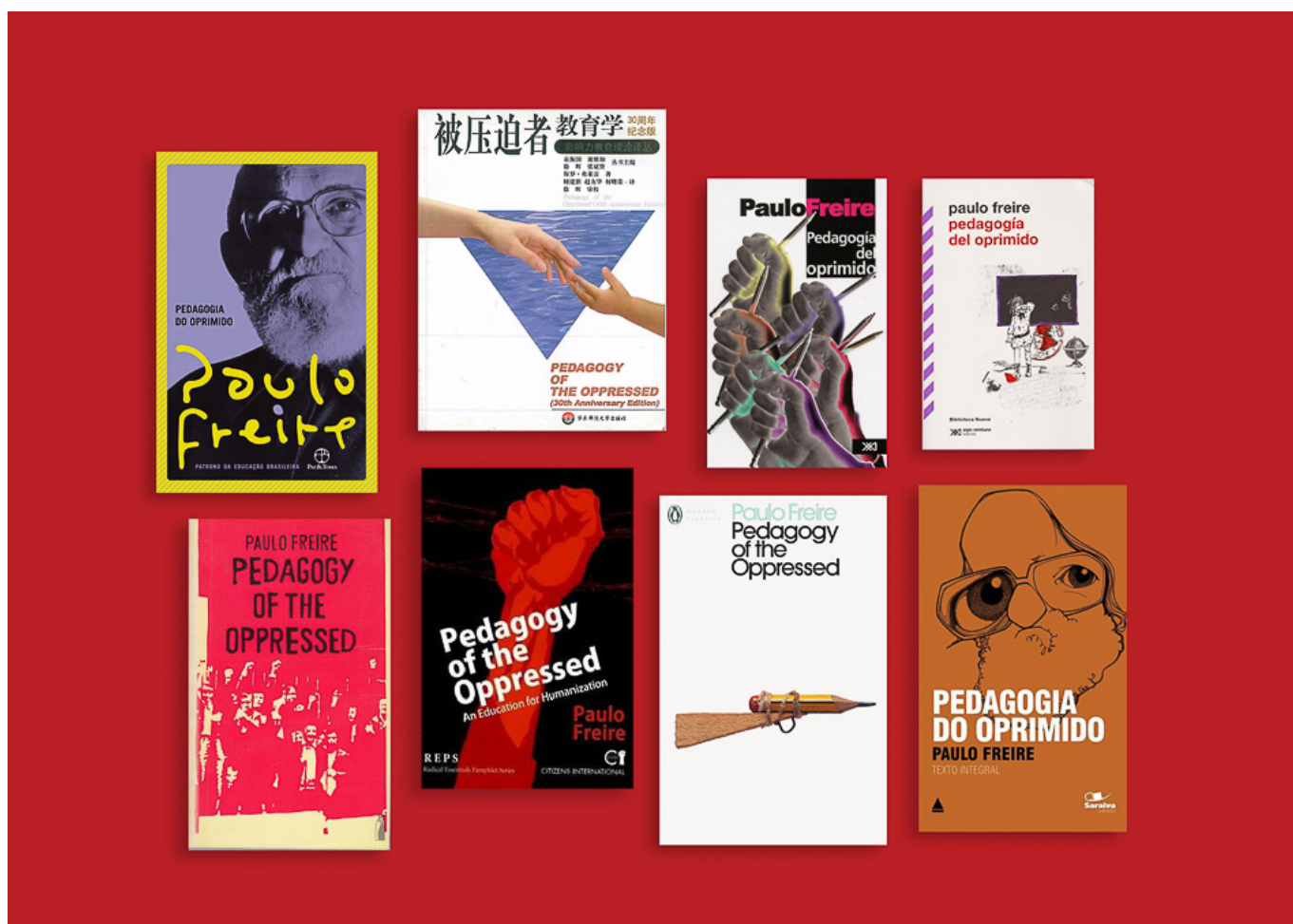
Capas de Pedagogia do Oprimido em diferentes idiomas

A luta pela dignidade é fundamental e foi parte central da ideologia da libertação nacional. Essa foi a premissa da obra de dois pensadores – Frantz Fanon e Paulo Freire – cujos escritos surgiram a partir da libertação nacional e das tradições socialistas que, por sua vez, impactaram essas lutas. Não por acaso nosso escritório do Instituto Tricontinental em Joanesburgo (África do Sul) produziu dois dossiês sobre essas duas figuras importantes: Frantz Fanon: o brilho do metal (mar. 2020), e agora Paulo Freire e a luta popular na África do Sul (nov. 2020). Parte do nosso trabalho no Instituto é olhar para trás para que possamos avançar: voltar às fontes de nossa tradição, estudar cuidadosamente suas importantes lições e, em seguida, desprender-se delas para avançar em nossas lutas atuais. Tanto Fanon quanto Freire – este último influenciado por Os condenados da terra (1961) quando redigiu Pedagogia do Oprimido (1968) – enfatizaram a importância do estudo coletivo e da luta como alavanca para desenvolver a consciência crítica entre as massas. Essa orientação geral sobre a relação integral entre esses dois elementos se faz sentir em nossa própria abordagem no Instituto, como expusemos em nosso dossiê O Novo Intelectual (fev. 2019).