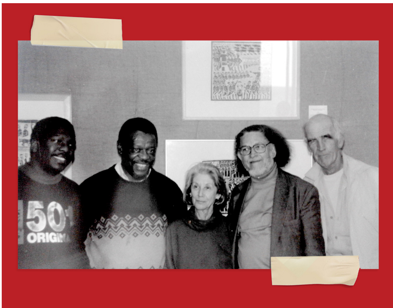
Mongane Wally Serote (segundo a partir da esquerda), Nadine Gordimer (centro), e Dennis Brutus (segundo a partir da direita)