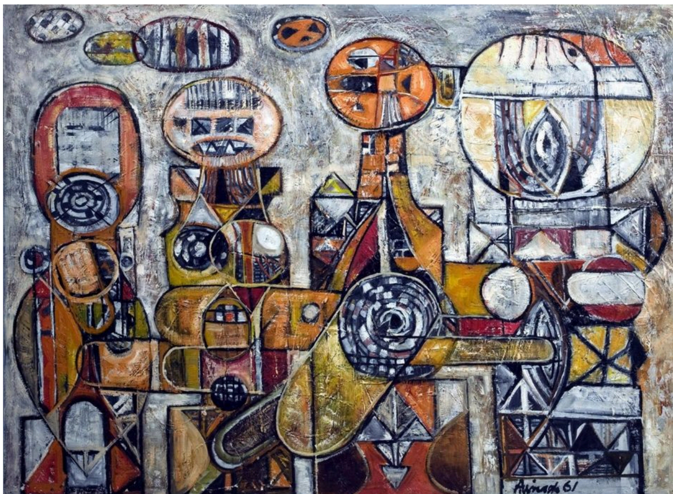
Avinash Chandra (Índia), Figuras iniciais , 1961.

em 2018, a taxa de alfabetização do estado era de 97%, ajudada pela garantia de educação gratuita universal (incluindo livros escolares gratuitos) e por uma campanha massiva de eletrificação (90% das casas no estado têm eletricidade).