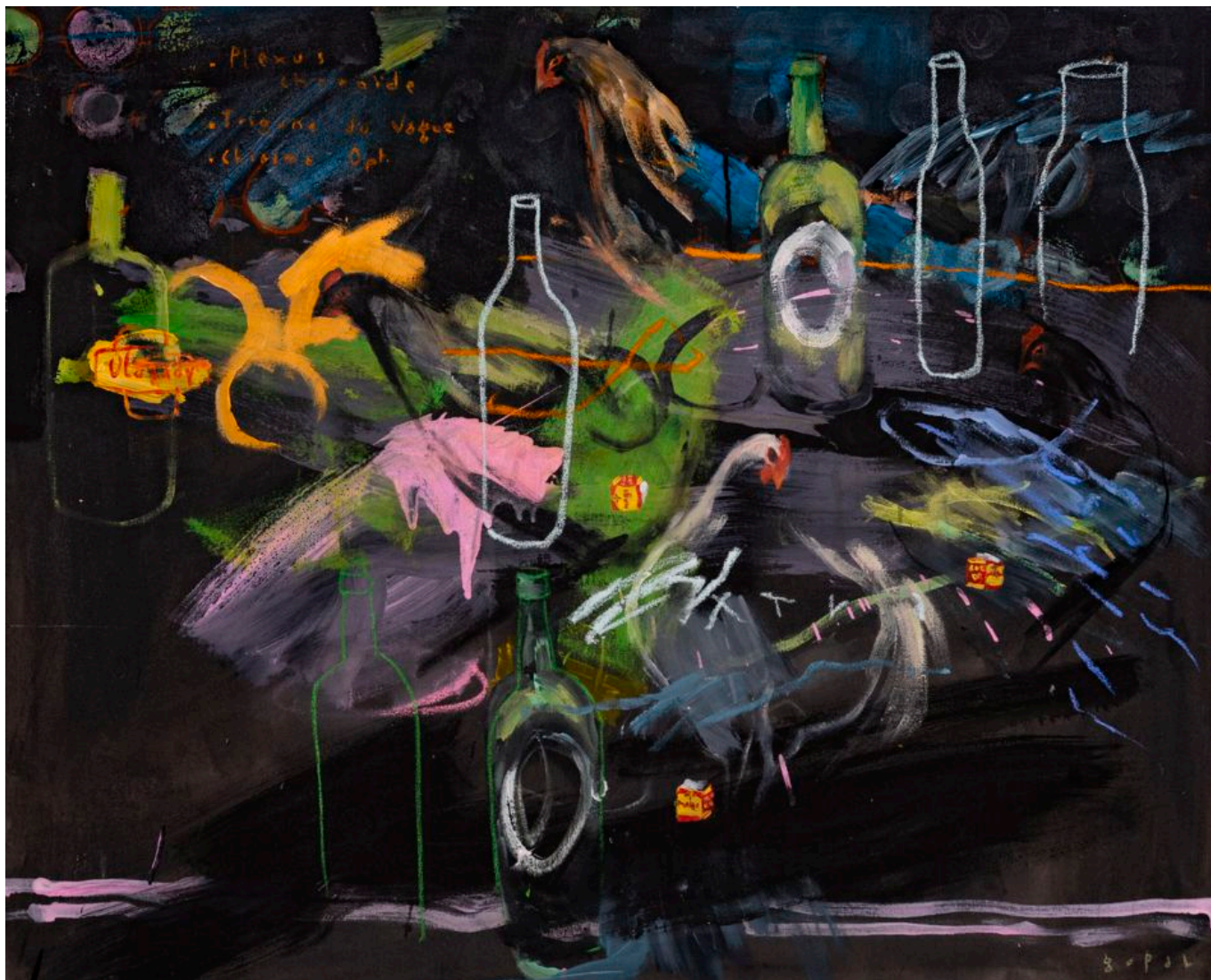
Gopal Dagnogo (Costa do Marfim), Natureza Morta com Galinhas , 2019.

O que ocorreu em Tripura, um estado no nordeste da Índia com quase 3,6 milhões de habitantes, tornou-se uma faceta normal da democracia em nossos tempos. A violência política da direita contra aqueles que buscam amplificar as vozes do povo agora é rotina.