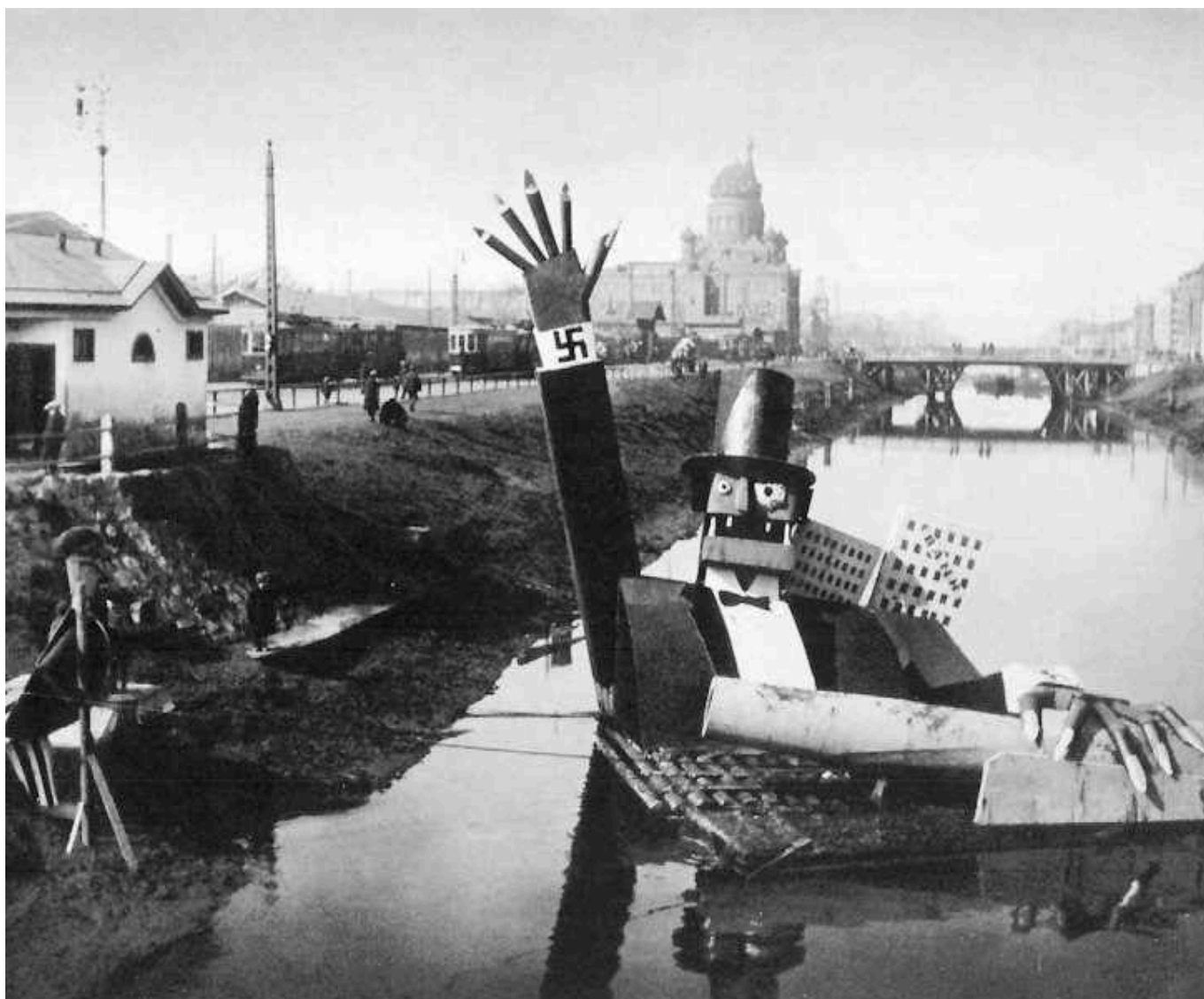
Instalação de arte antifascista, no 1º de maio, no Canal Obvodny, Leningrado, USSR, 1932

O romance de Tolstói não conseguiu resolver o problema de Maslova. Mas trouxe a desumanidade à superfície. Isto é, em termos gerais, o propósito da arte. Esta não muda o mundo por si só. Ler um romance ou observar um design pode chamar nossa atenção para os problemas e até mesmo fornecer uma compreensão deles. Mas não pode por si só mudar o mundo. A arte e a literatura nos alertam para as contradições, mostram como essas contradições – como a prisão de Maslova – não podem ser superadas por sentimentos bons e liberais. Lutas são necessárias. Nekhlyudov sabe disso. As prisões defendem “interesses de classe”, diz ele, referindo-se aos interesses da aristocracia e dos industriais. Os interesses de outras classes – os trabalhadores, como Maslova – foram suprimidos. A arte revelou a supressão. A luta levaria essa revelação para além.