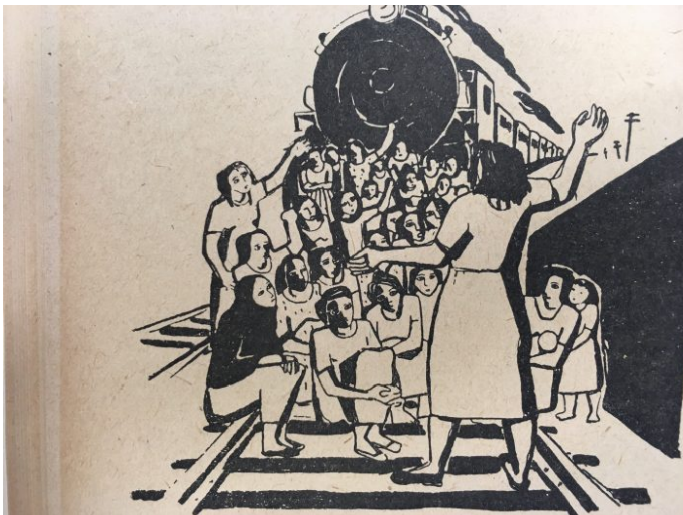
Federação de Mulheres Brasileiras, xilogravura, década de 1950

Do Instituto Tricontinental de Pesquisa Social vem o 15º dossiê – A Arte da Revolução Será Internacionalista . O texto nos leva, no início, à Biblioteca e Memorial Karl Marx, em Londres, mas logo mergulha profundamente na paisagem estética da Revolução Cubana. Pois foi em Cuba, na Organização de Solidariedade com os Povos da Ásia, África e América Latina (OSPAAAL), que uma ampla produção artística fez alusões às difíceis realidades do nosso mundo e também às lutas para superá-las. Um dos aspectos mais fascinantes da teoria cubana de produção de arte radical é a abertura para a inovação. Vem à lembrança um discurso proferido pelo revolucionário chinês Zhou Enlai, em 19 de junho de 1961, a um fórum de escritores e artistas. Zhou Enlai falou da importância da arte e da literatura para o pleno desenvolvimento da consciência humana. Mas foi cauteloso acerca de uma abordagem muito estreita em relação à arte e literatura. Em sua maneira tipicamente generosa, Zhou Enlai escreveu: