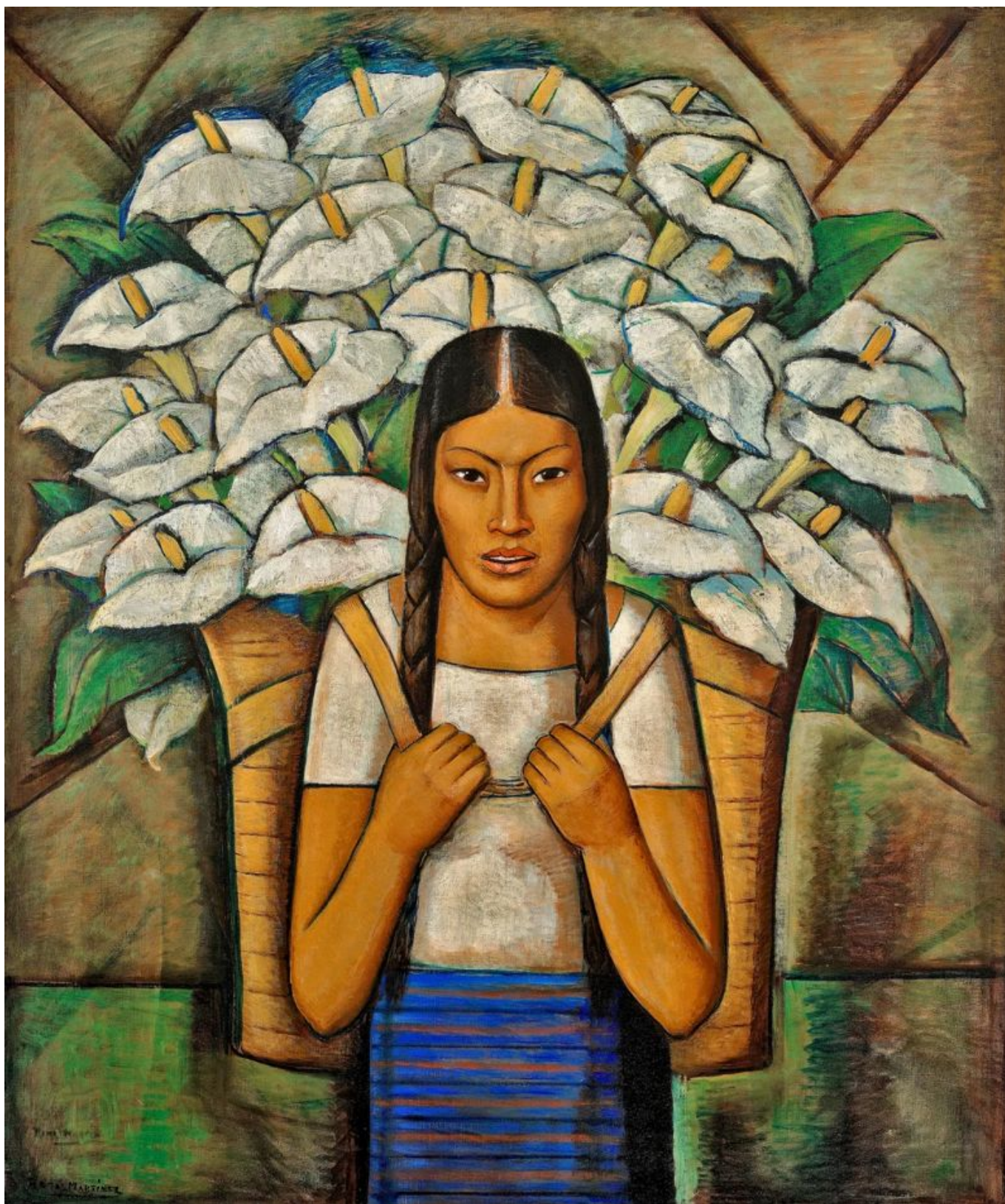
Alfredo Ramos Martínez (México), Vendedora de Alcatraces [Vendedora de copos de leite, 1929].

Nas últimas semanas, três eleições particularmente importantes foram realizadas na Índia, no México e na África do Sul. A Índia e a África do Sul são os principais participantes do grupo BRICS , que está traçando