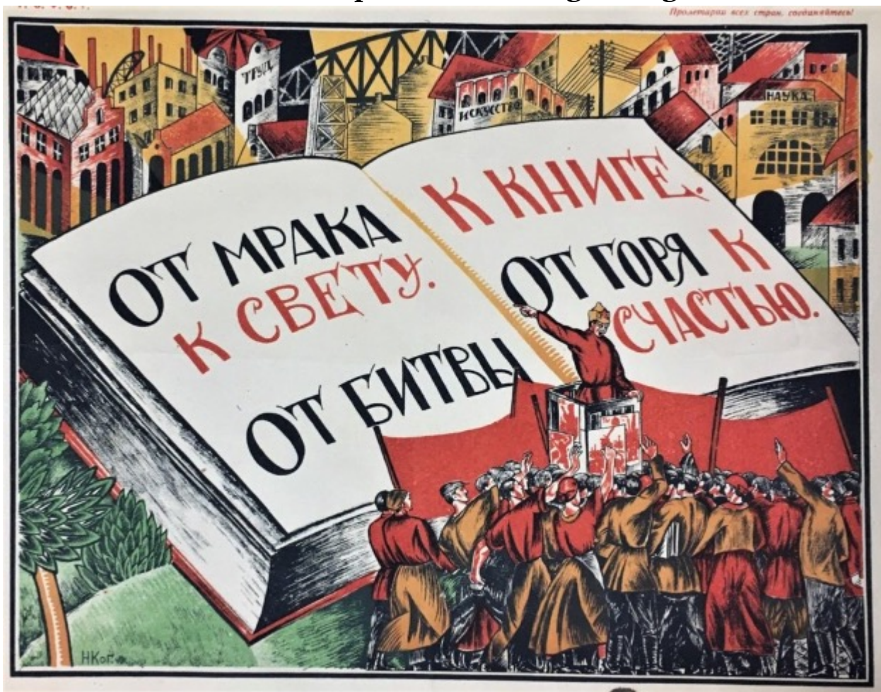
Cartaz soviético, “Da escuridão à luz. Da batalha ao livro. Da tristeza à felicidade”, 1921.

A experiência soviética aprofundou esses esforços. Durante a histórica Revolução Russa de 1905, que Vladimir Lenin descreveu como um “ensaio geral” para a Revolução de Outubro de 1917, os primeiros conselhos de trabalhadores (ou “soviets”) foram estabelecidos. O primeiro soviete, presidido pelo trabalhador têxtil e poeta Aleksei Nozdrin, sediou círculos literários, produções teatrais e leituras de poesia.