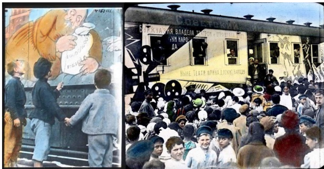
Trens de agitprop soviéticos [agitpoezda], 1917-1920.

A Revolução de Outubro de 1917 viu uma expansão significativa dos movimentos culturais. Em pouco tempo, mais de 80 mil espaços culturais surgiram, envolvendo mais de 450 mil pessoas no movimento Proletkult [cultura proletária]. O Exército Vermelho, que atingiu 5 milhões de membros durante a guerra civil, operou mais de 2 mil escolas, 3 mil bibliotecas, 1.300 clubes, 472 teatros e 320 cinemas em 1920. As atividades eram organizadas com o apoio do Setor de Educação Política do Exército Vermelho que afirmava que a arte, em suas variadas linguagens, era a principal forma para a realização do trabalho de educação política.