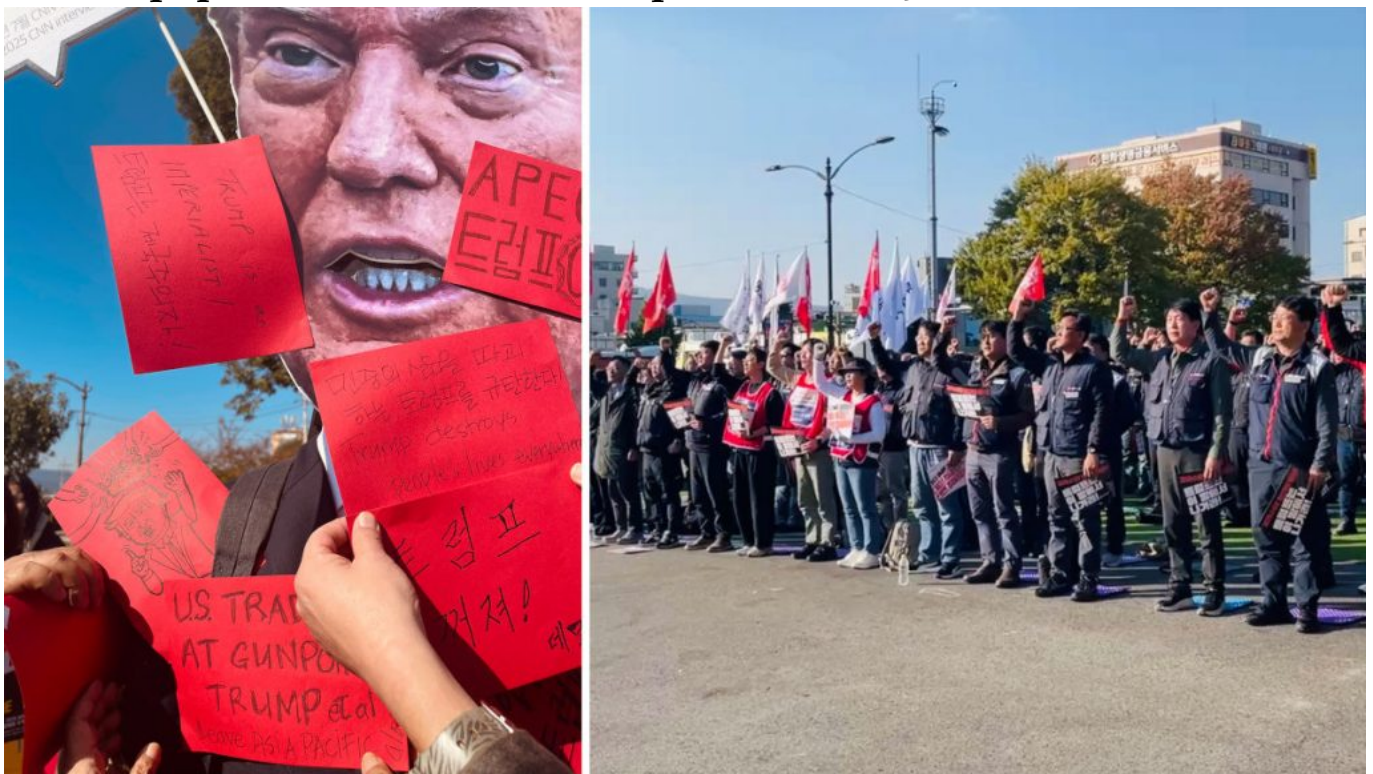
Uma mobilização durante a Cúpula Popular em Gyeongju, onde manifestantes cantaram “Marcha dos Amados” (à direita).

Minjung-gayo distingue canções criadas para e pelo povo de daejung-gayo (대중가요), ou música popular convencional. Durante a era da ditadura militar, criar minjung-gayo era perigoso. Em 1971, por exemplo, a junta militar proibiu a canção pioneira de Kim Min-gi (김민기) “Orvalho da Manhã” (아침 이슬). No