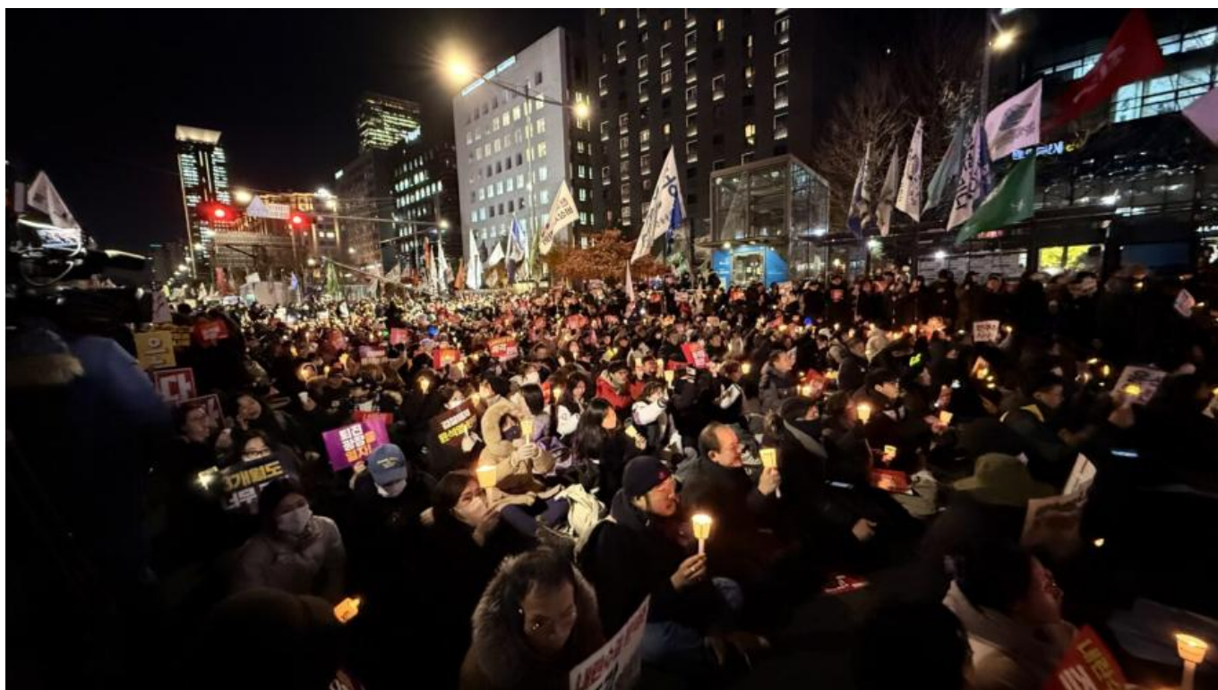
Uma mobilização em 6 de dezembro anterior à votação do impeachment de Yoon Suk-Yeol na semana seguinte.

Estamos cantando; vamos melhorar. Lembramos dos dias desperdiçados de forma tola. Ainda assim, não é bom? Mesmo em meio a um rio de lágrimas, Estamos aqui juntos. Não é engraçado? Se tivéssemos ficado sentados chorando, Nunca teríamos nos conhecido neste mundo.