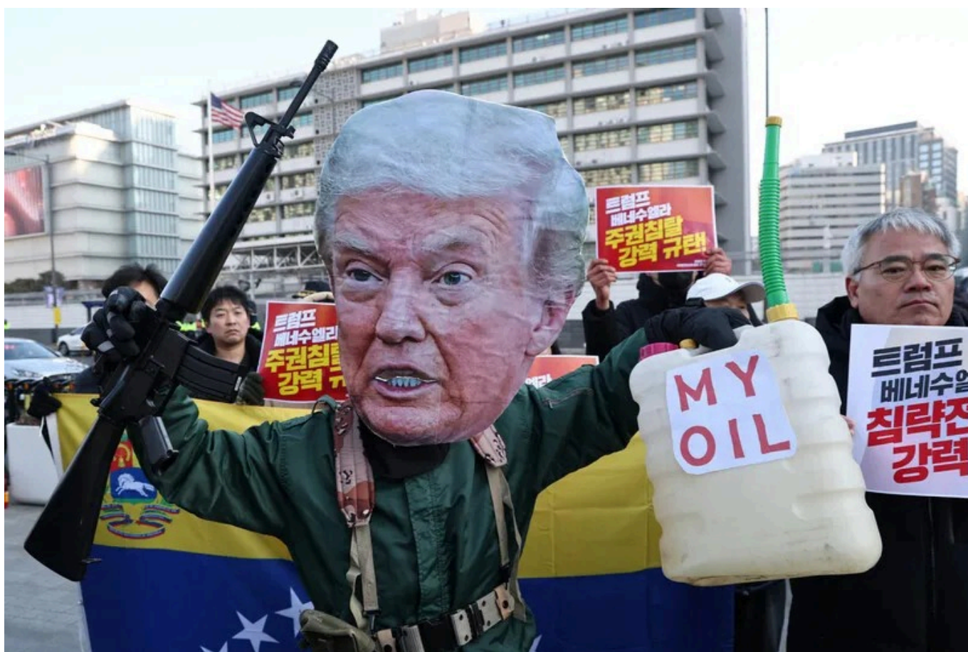
Ação de solidariedade com a Venezuela, 10 de janeiro de 2026.

Os mesmos movimentos coreanos que se mobilizaram contra a visita de Trump durante a APEC convocaram agora uma Ação Popular Internacional para denunciar um ano do regime do presidente estadunidense. Essa declaração condena a violência imperialista da administração Trump em todo o mundo, do apoio e financiamento do genocídio em curso na Palestina até o recente bombardeio de Caracas, na Venezuela, e o sequestro do presidente Nicolás Maduro e de sua esposa, a deputada Cilia Flores, em 3 de janeiro de 2026 ( veja o cartaz criado pela Assembleia Popular Internacional – uma imagem entre muitas que serão exibidas em manifestações de solidariedade à Venezuela em todo o mundo). Em última análise, os movimentos populares da Coreia à Venezuela nos lembram que a luta continua, assim como suas canções.