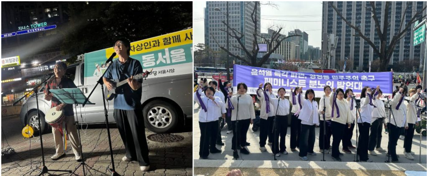
Members of Maru (left) and norae-pae I-eum (right).

Aqueles anos amargos, aqueles dias sujos e temerosos. Mais uma vez, vamos nos erguer acima deles E marchar ao ritmo da história. Um! Dois! Três! Avante! Mais uma vez, avante!