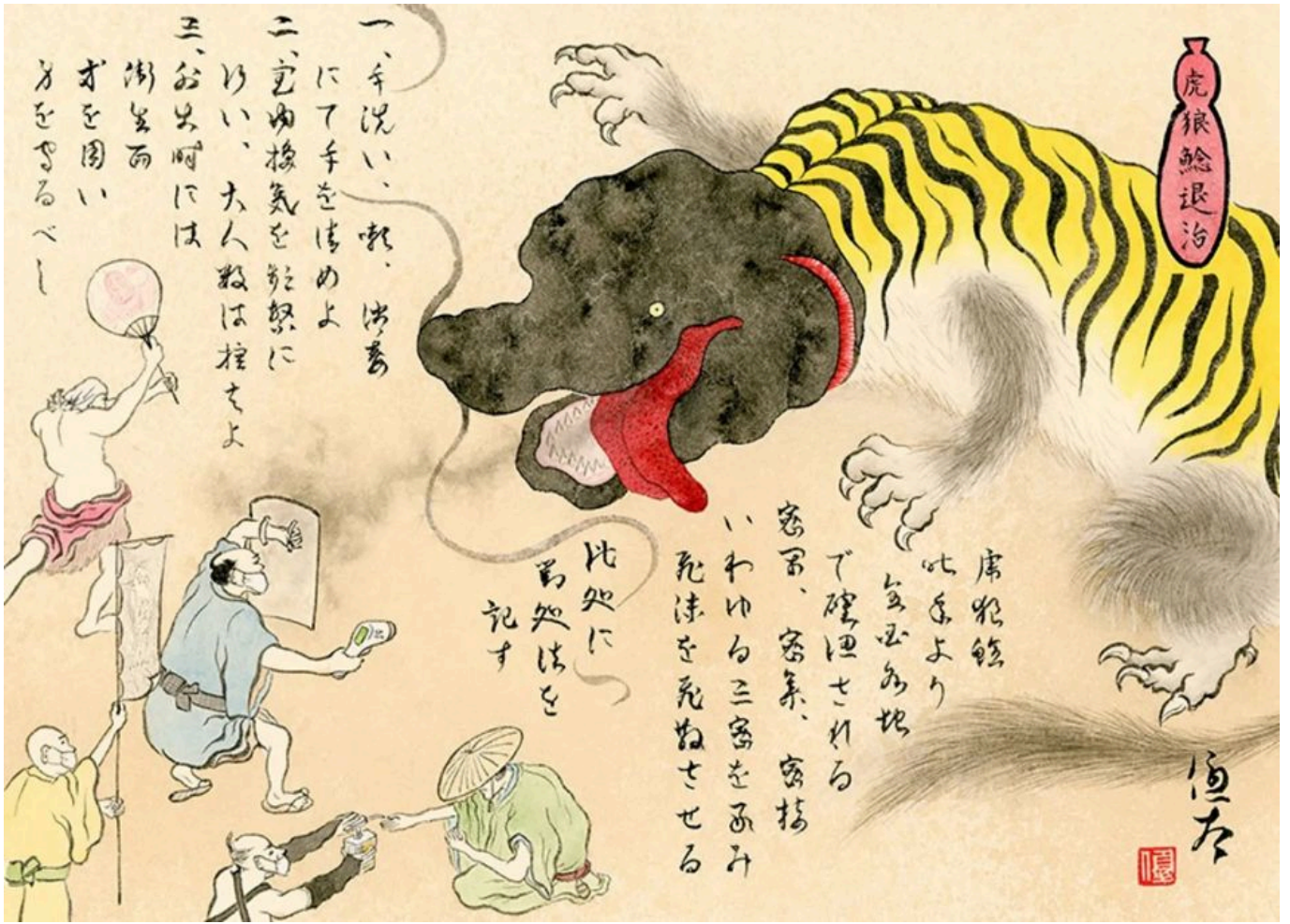
युता निवा (जापान), बाघ-भेड़िया-कैटफ़िश का वध, 2021