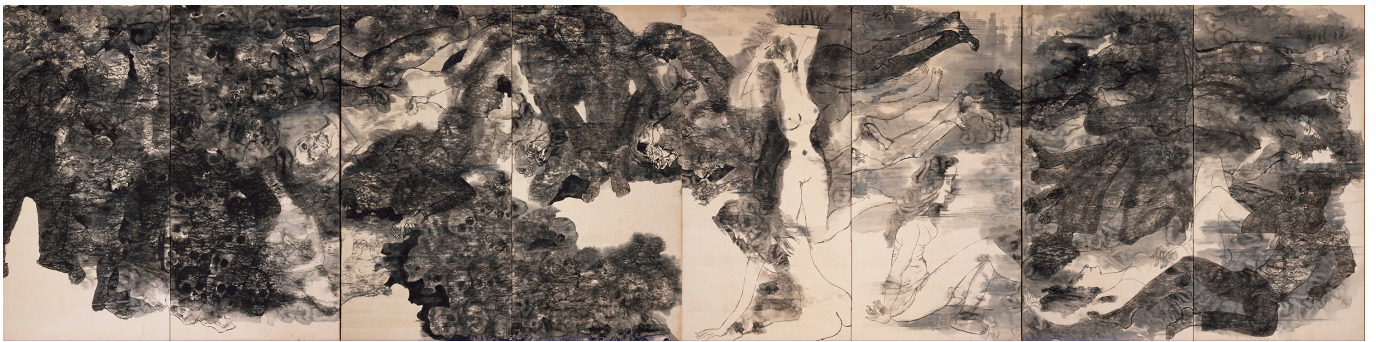
इरी और तोशी मारुकी, X/III अमेरिकी वॉर प्रिज़नर्स की मौत, 1971, द हिरोशिमा पैनल्स से साभार

ये पीड़ा के गीत हैं, युद्ध के गीत नहीं। 'बॉर्न इन द यूएस' या 'कीप ऑन रॉकिंग इन द फ्री वर्ल्ड' गाने से वैश्विक उत्तर के प्रति गर्व की भावना उत्पन्न नहीं होती, बल्कि ये उनके द्वारा दुनिया पर थोपे गए क्रूर युद्धों की तीखी आलोचना हैं। 'कीप ऑन रॉकिंग इन द फ्री वर्ल्ड' व्यंग्य है। न तो ये ब्लिंकन को समझ आया, और न ही ट्रम्प को। वे इस गीत की धुन के आकर्षण का इस्तेमाल करना चाहते हैं, पर इस में दर्ज पीड़ा पर ध्यान नहीं देते। वे यह नहीं समझते कि नील यंग द्वारा 1989 में गाया गया यह गाना पनामा (1989-1999), इराक (1990-1991), यूगोस्लाविया (1999), अफ़ग़ानिस्तान (2001-2021), इराक (2003-11) आदि के खिलाफ़ हुए अमेरिकी युद्धों के प्रतिरोध का गीत है।