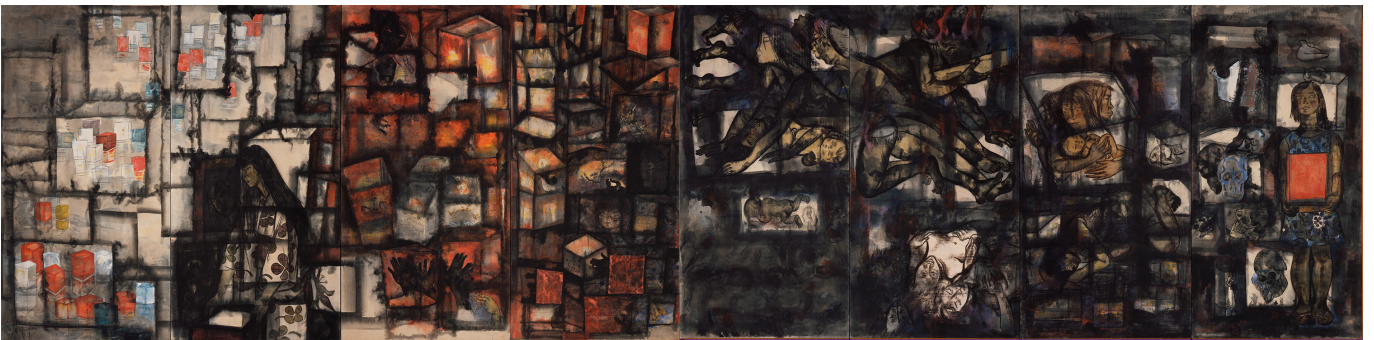
इरी और तोशी मारुकी, XVII तैरते लालटेन, 1968, द हिरोशिमा पैनल्स से साभार

इंटरनैशनल स्ट्रैटेजी सेंटर (सियोल्, दक्षिण कोरिया) और नो कोल्ड वॉर के सहयोग से प्रकाशित हमारे नए डोसियर 'द न्यू कोल्ड वॉर इज सेंडिंग ट्रेमर्स थ्रू नॉर्थईस्ट एशिया' के अनुसार, 'चीन के खिलाफ अमेरिका के नेतृत्व वाला नया शीत युद्ध पूर्वोत्तर एशिया को अस्थिर कर रहा है। क्षेत्र के ऐतिहासिक मुद्दों का इस्तेमाल कर जापान और दक्षिण कोरिया से ताइवान जलडमरूमध्य और फ़िलीपींस से आगे ऑस्ट्रेलिया और प्रशांत द्वीप समूह तक व्यापक सैन्यीकरण अभियान चलाया जा रहा है। अमेरिका द्वारा चीन को घेरने में भारत की भूमिका निर्धारित करने के लिए ही 'इंडो-पैसिफिक' नाम चलाया गया और इस क्षेत्र में जारी इन गतिविधियों के अंतर्गत उत्तर कोरिया का हौआ खड़ा कर उसके परमाणु एवं मिसाइल कार्यक्रमों का इस्तेमाल प्रशांत क्षेत्र के एशिया किनारे में असीमित लामबंदी को उचित ठहराने के लिए किया जाता है। 2023 में दक्षिण कोरिया का सैन्य बजट (47.9 अरब डॉलर) उसी वर्ष उत्तर कोरिया के सकल घरेलू उत्पाद (20.6 अरब डॉलर) के दोगुने से भी अधिक था। यह एक उदाहरण है जो इस असंतुलन को उजागर करता है। डोसियर में कहा गया है कि उत्तर कोरिया को इस तरह इस्तेमाल करना, 'हमेशा से ही अमेरिका की दबाव रणनीतियों का अहम हिस्सा रहा है – पहले सोवियत संघ के खिलाफ और आज चीन के खिलाफ'।