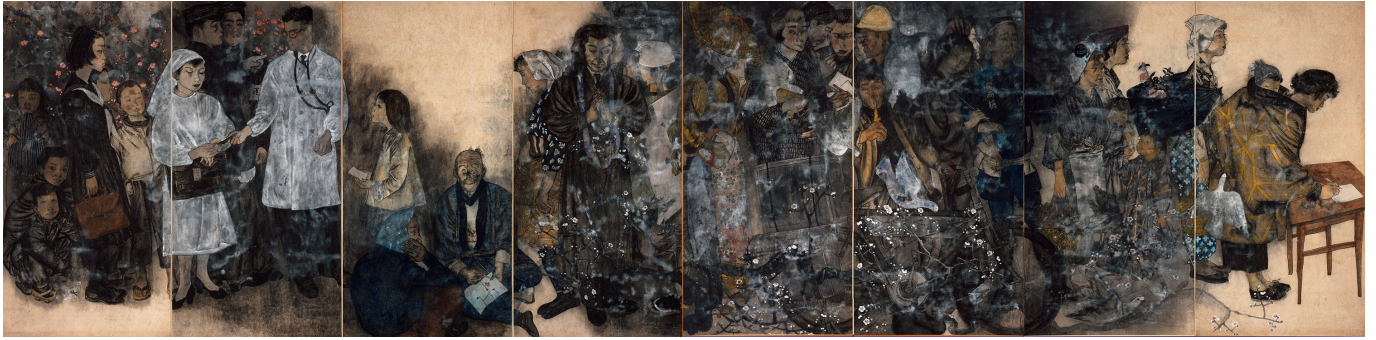
इरी और तोशी मारुकी, Xयाचिका, 1955

डोसियर के अंतिम खंड 'उत्तर पूर्व एशिया में शांति का मार्ग' में ओकिनावा (जापान), कोरियाई प्रायद्वीप और चीन के जन-आंदोलनों के बारे में बताया गया है जो शांति का रास्ता बनाने का प्रयास कर रहे हैं। पांच सरल सिद्धांत इस रास्ते का आधार हैं: खतरनाक गठबंधनों का अंत, क्षेत्र में अमेरिका के नेतृत्व वाले युद्धाभ्यासों व अमेरिकी हस्तक्षेप का अंत, क्षेत्र में विभिन्न आंदोलनों में आपसी सहयोग और एशिया में सैन्यीकरण को समाप्त करने को प्रतिबद्ध आंदोलनों के लिए समर्थन। ओकिनावा के कडेना एयर बेस, हेनोको खाड़ी, दक्षिण कोरिया के टर्मिनल हाई एल्टीट्यूड एरिया डिफेंस इंस्टॉलेशन, और जेजू नौसेना अड्डा के पास रहने वाले लोग कई मौकों पर सैन्यीकरण को सीधी चुनौती दे रहे हैं।