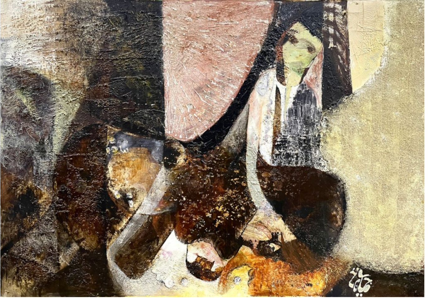
फ़िलिस्तीन, जिम्ला बित मोहम्मद (अल्जीरिया), 1974.

जुलाई 1958 में कई कवियों ने मिलकर अक्का (कब्जे वाला फ़िलिस्तीन '48) में एक उत्सव किया। इसमें शामिल कवियों में से एक डेविड सेमाह ने अखी तौफ़ीक़ (तौफ़ीक़ मेरा भाई) नाम की कविता फ़िलिस्तीनी कम्युनिस्ट कवि तौफ़ीक़ ज़ियाद को समर्पित की। तौफ़ीक़ ज़ियाद इस उत्सव के दौरान इज़राइली जेल में थे। सेमाह की पंक्तियां हमारे अंदर वो भावना जगाती हैं जिसकी हमारे दौर में बेहद ज़रूरत है :