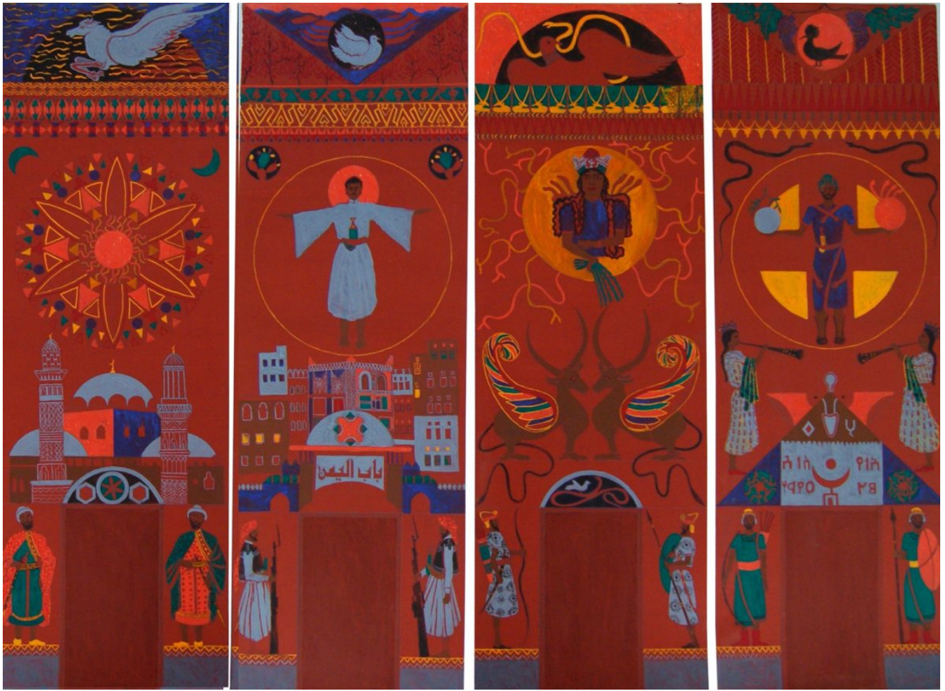
द सिम्बॉलिक हिस्ट्री ऑफ अरब जाँय ( अरबिया फेलिक्स), हकीम उल अकली (यमन), 1994.

2014 में सीरिया, ईरान और रूस की सेनाओं से हारने के बाद सीरियाई बागी तुर्की और सीरिया की सीमा के पास स्थित इदल्लिब शहर में फिर से संगठित हुए। यहीं 2016 में प्रमुख विपक्षी ताकतें अल-क्रायदा से टूटकर अलग हुईं, उन्होंने स्थानीय काउन्सलों को अपने नियंत्रण में ले लिया और खुद को असद विरोधी आंदोलन के इकलौते नेतृत्व के तौर पर तैयार किया। इसी ग्रुप यानी हयात तहरीर अल-शाम (लेवंट स्वतंत्रता संगठन या एचटीएस) ने अब दमिश्क में सत्ता हासिल की है।