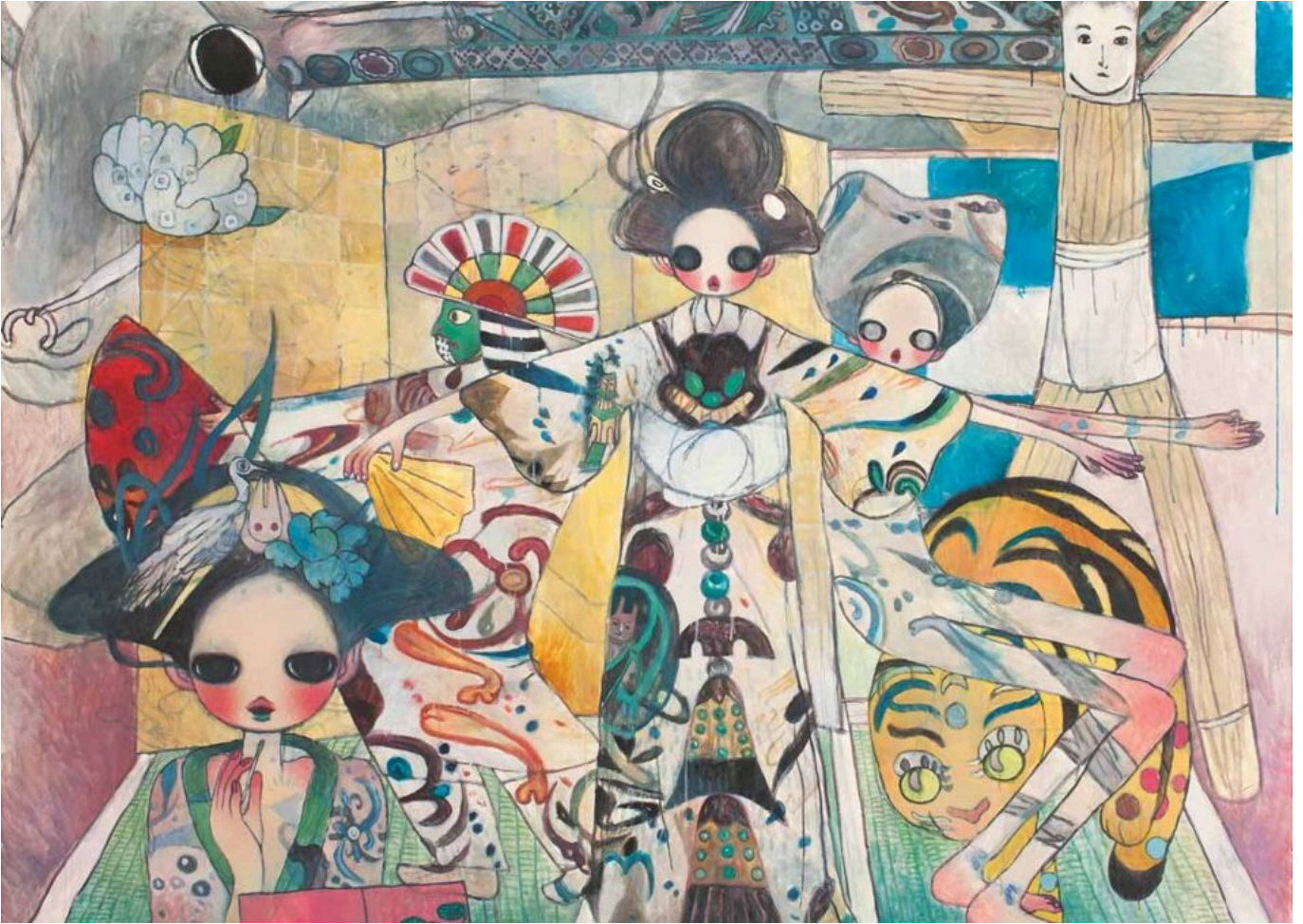
ताकानो आया (जापान), इन हुआंग का कमरा, 2006.

इस सीरीज का पहला अध्ययन मंथली रिव्यू और नो कोल्ड वॉर के सहयोग से तैयार किया गया है। 'द यूनाइटेड स्टेट्स इज वेजिंग ए न्यू कोल्ड वॉर : ए सोशललिस्ट पर्सपेक्टिव' नामक अध्ययन में शामिल निबंध संयुक्त राज्य अमेरिका द्वारा परमाणु प्रधानता कायम रखकर या 'सीमित परमाणु युद्ध' शुरू करके या किसी भी तरीके से अंतर्राष्ट्रीय प्रणाली पर अपना नियंत्रण बनाए रखने की नीति का बहुत करीब से मूल्यांकन करता है। प्रिंसटन यूनिवर्सिटी ने 2020 में परमाणु युद्ध का नाटकीय अनुकरण किया था। उससे पता चला है कि अगर किसी भी परमाणु शक्ति द्वारा एक भी सामरिक हमला किया जाता है, तो वैसी स्थिति में 9.15 करोड़ लोगों की तत्काल मृत्यु हो सकती है। इसके अलावा शोधकर्ताओं ने लिखा है कि 'परमाणु (रसायनों) की वर्षा और उसके अन्य दीर्घकालिक प्रभावों से होने वाली मौतें इस अनुमान में भारी वृद्धि कर सकती हैं'।