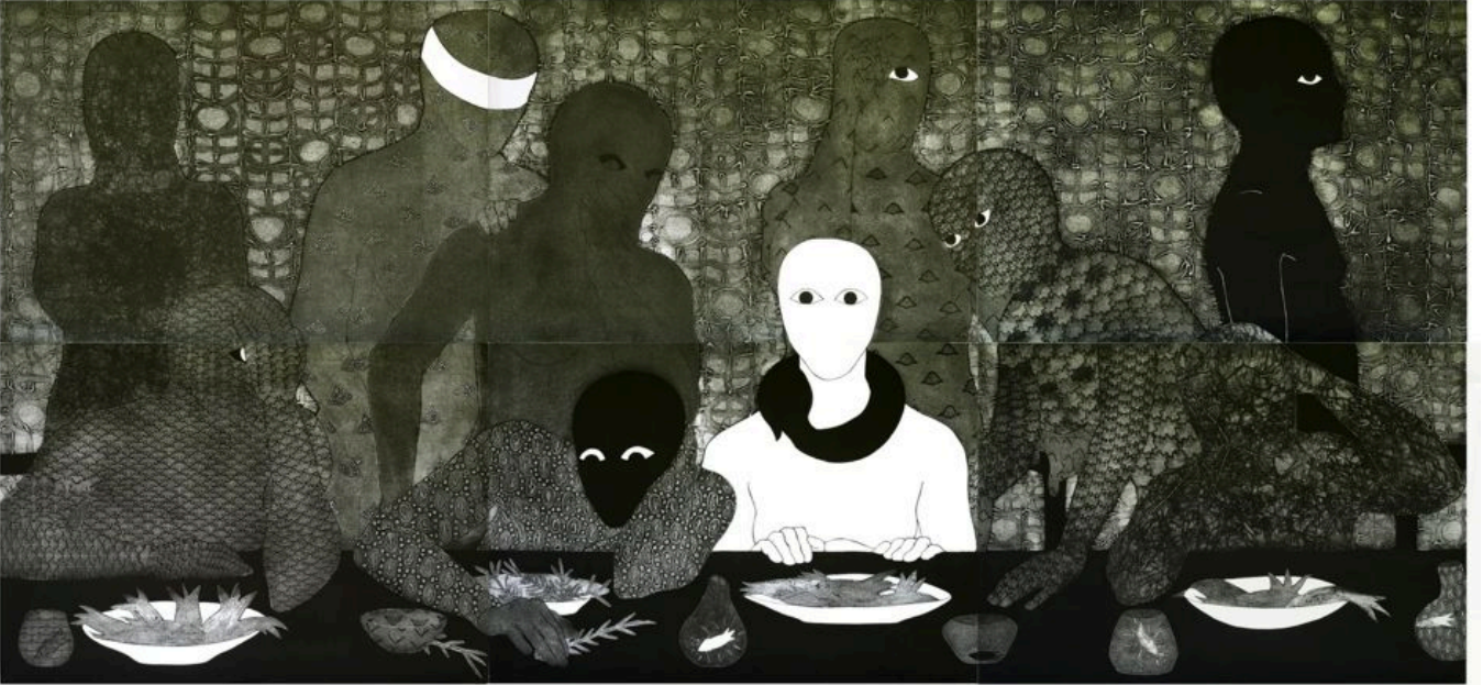
बेल्क्स अयोन (क्यूबा), [2020] [2020], 1991

अटलांटिक संधि संगठन (नाटो) के सहयोगियों के साथ मिलकर यूक्रेन मामले में ऐसा ही किया था। यूक्रेन युद्ध के लिए 61.4 बिलियन डॉलर और फ़िलिस्तीनियों के खिलाफ़ इज़रायली नरसंहार के लिए 14.1 बिलियन डॉलर के समेत उनका कुल पूरक व्यय 105 बिलियन डॉलर है (यह 2023 के लिए 858 बिलियन डॉलर के अंडर-रिपोर्टेड सैन्य बजट से अतिरिक्त व्यय है)। रूसी सैनिकों के यूक्रेन में प्रवेश करने के कुछ दिनों बाद बेलारूस और तुर्की में यूक्रेनी और रूसी अधिकारियों के बीच शांति वार्ता शुरू हो गई थी। लेकिन नाटो ने इन वार्ताओं को रोक दिया। युद्ध बढ़ता गया और अब तक इसमें लगभग 10,000 नागरिक मारे गए हैं। एक साल और आठ महीने के युद्ध के दौरान यूक्रेन में मरने वाले नागरिकों की संख्या से ज्यादा नागरिक फिलिस्तीन में पिछले चार हफ़्तों में मारे जा चुके हैं।