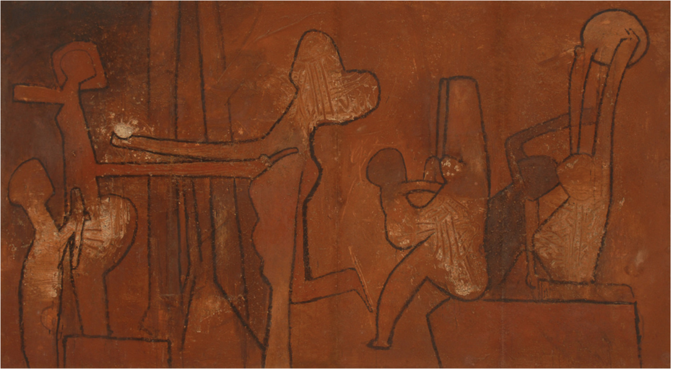
रॉबर्टो मट्टा (चिली), क्यूबा एस ला कैपिटल ('क्यूबा राजधानी है'), 1963.