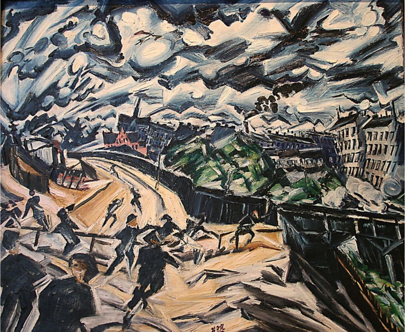
लुडविग मीडनर (जर्मनी), सर्वनाशक परिदृश्य, 1913.

अलग-थलग करने के प्रयास शामिल हैं। ताकि इन देशों को अंदर से तोड़कर उन पर हमेशा के लिए प्रभुत्व स्थापित किया जा सके।