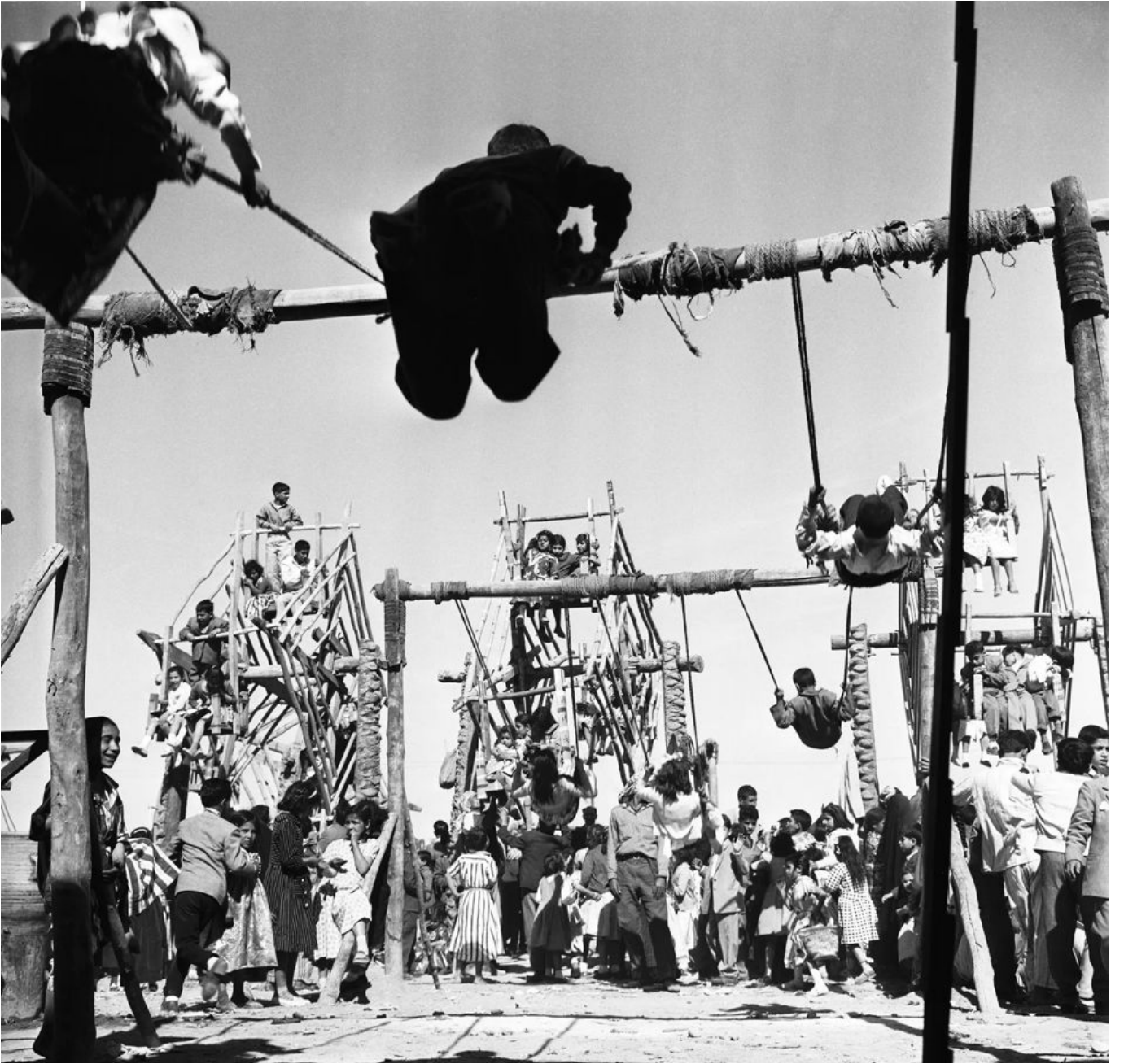
लतीफ़ अल-अनी (इराक़), बग़दाद में ईद उत्सव, 1959।

मैं उन अमेरिकियों से हमारे अधिकार प्राप्त करना चाहता हूँ जिन्होंने हमें नुकसान पहुँचाया : 51वाँ न्यूजलेटर (2021)