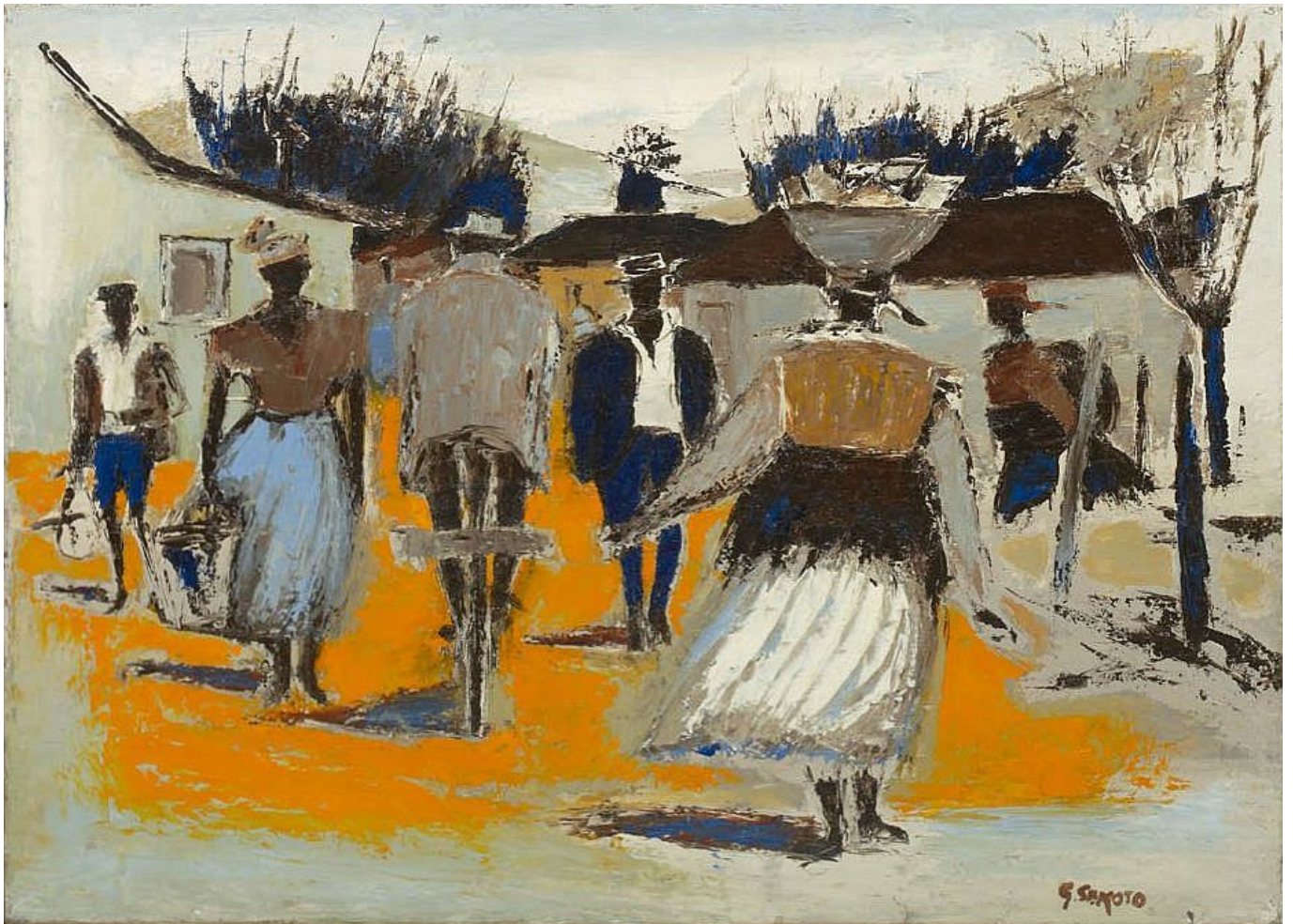
शहर की सड़क, गेराड सेकोटो (दक्षिण अफ्रीका), 1958.

इसीलिए मेहनतकश वर्ग की ताकत को फिर से खड़ा करना हमारे सामने सबसे महत्वपूर्ण काम है। इसमें केवल चुनावी गठबंधन या अभिजात वर्ग के बीच पर्दे के पीछे की बातचीत ही शामिल नहीं है, बल्कि श्रमिकों, बेरोजगारों, महिलाओं, छात्रों, अनौपचारिक श्रमिकों, किसानों और समुदायों के बीच जमीनी स्तर पर संगठित होना भी शामिल है। वामपंथ को राजनीतिक शिक्षा, लोकतांत्रिक जन संगठन, सामूहिक अनुशासन और अंतर्राष्ट्रीयता की परंपराओं को पुनः प्राप्त करना होगा। अंतर्राष्ट्रीयतावाद देशों के बीच की दानशीलता नहीं है, बल्कि यह समझ है कि दुनिया के मेहनतकश वर्ग पूंजी के संचय और साम्राज्यवादी प्रभुत्व की व्यवस्था के रूप में एक साझा दुश्मन का सामना कर रहे हैं।