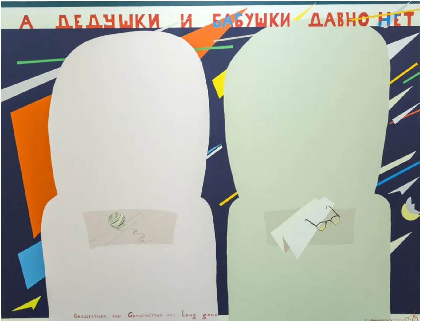
पावेल पेपरस्टीन (रूस), दादा-दादी कब के जा चुके हैं, 2013.