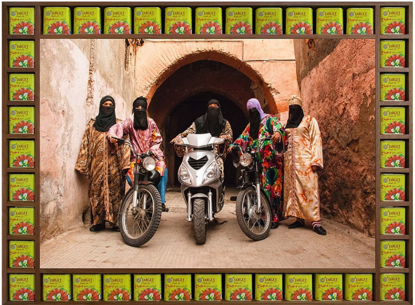
मेहंदी की परियाँ, हसन हज्जाज (मोरक्को), 2010.

हम एक ऐसी दुनिया चाहते हैं जहाँ हमारी अगली नस्लें बंदूकें सिर्फ अजायबघरों या संग्रहालयों में देखें।