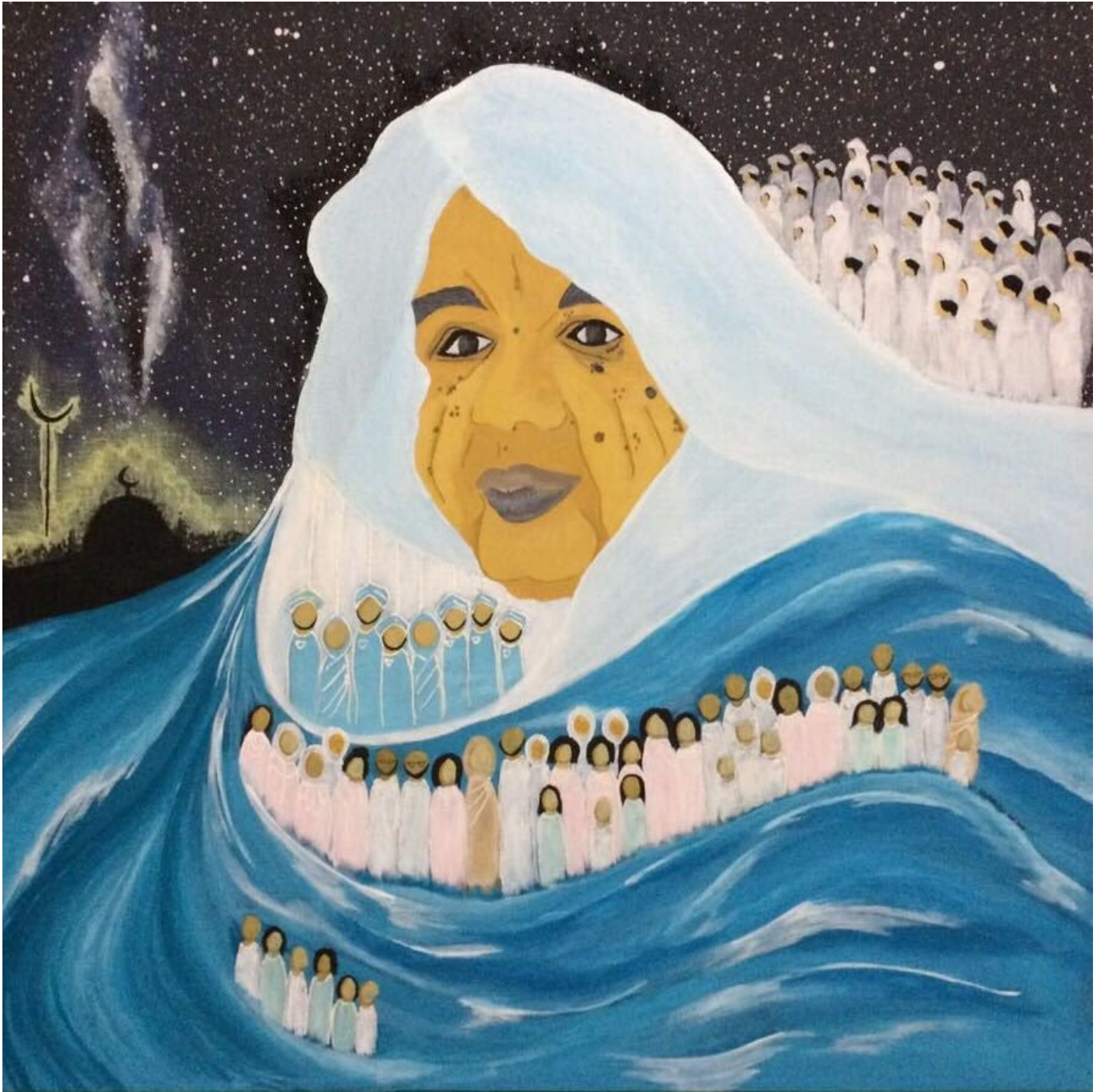
दाता समंदर, रीम अल जिआली (सूडान), 2016.

और संयुक्त राष्ट्र में सोवियत राजदूत वालेरियन ए. ज़ोरिन के बीच हुए बातचीत की अनुगूँज है। पूर्ण निरस्त्रीकरण के लिए मैक्क्लॉय-ज़ोरिन समझौता में जिन नियमों को स्वीकार किया गया उनमें दो अहम बिंदु थे : पहला, 'निरस्त्रीकरण हर समय और पूरी तरह' होना चाहिए तथा दूसरा, युद्ध 'अंतर्राष्ट्रीय समस्याओं को सुलझाने का ज़रिया' नहीं होना चाहिए। आज ये दोनों ही विचार अजेंडे से गायब हैं। यूएस के नेतृत्व में ग्लोबल नॉर्थ आग उगलते दानव की तरह बर्ताव कर रहा है और अपने विपक्षियों से बातचीत कर हल नहीं निकालना चाहता। 1991 में सोवियत संघ के विघटन के बाद जो अकड़ [यूएस में] आ गई थी वह अब तक गई नहीं है। कजान में हुई प्रेस वार्ता में रूस के राष्ट्रपति व्लादिमीर पुतिन ने बीबीसी के स्टीव रोसेंबर्ग को बताया कि ग्लोबल नॉर्थ के नेता अपनी मीटिंगों में 'हमेशा [रुसियों] को उनकी जगह दिखाना' चाहते हैं और 'रूस को दूसरे दर्जे का राष्ट्र' बना देना चाहते हैं। नॉर्थ और साउथ का रिश्ता इसी खुद को श्रेष्ठ समझने के अहसास से बयां होता है। दुनिया शांति चाहती है और शांति के लिए बातचीत ज़रूरी है जो खुले मन से और बराबरी से की जाए।