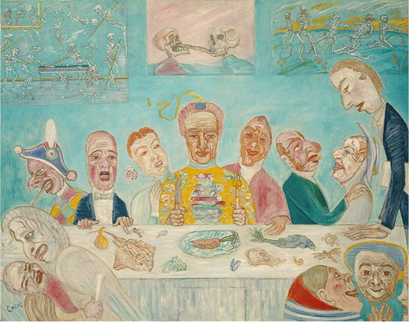
जेम्स एंसर, अनोखी दावत (भूखों का भोज), 1917-18

अंग्रेज़ी के पुराने श्रद्धेय थॉमस माल्थस ग़लत थे जब उन्होंने लिखा था कि अनंत काल के लिए, खाद्य उत्पादन समांतर रूप से (1-2-3-4) बढ़ेगा और आबादी गुणात्मक रूप से (1-2-4-8) बढ़ेगी, और आबादी की ज़रूरतें मनुष्य की भोजन पैदा करने की क्षमता से आगे निकल जाएँगी। जब 1789 में माल्थस ने अपना ग्रंथ लिखा था, तब पृथ्वी पर लगभग एक अरब लोग थे। आज पृथ्वी की आबादी आठ अरब है, और फिर भी वैज्ञानिक हमें बताते हैं कि सब को खिलाने के लिए पर्याप्त भोजन से ज्यादा भोजन का उत्पादन किया जाता है। लेकिन भुखमरी फिर भी है। क्यों ?