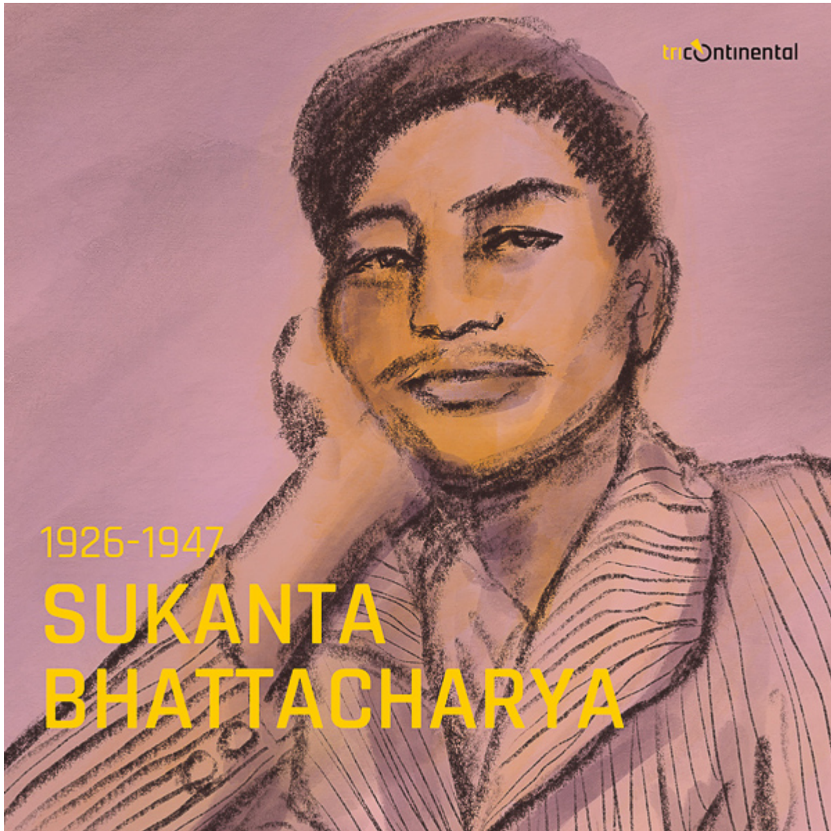
सुकांता भट्टाचार्य, 1926-1947

1943 में ब्रिटिश साम्राज्य के नौकरशाहों ने बंगाल से अनाज लेकर वहाँ के लोगों को भयानक अकाल से ग्रस्त होने के लिए छोड़ दिया। उस अकाल में दस से तीस लाख लोग मारे गए। भारतीय कम्युनिस्ट पार्टी के सदस्य सुकांता भट्टाचार्य, जो उस समय उन्नीस साल के थे, उन्होंने फासिवाद विरोधी लेखकों और कलाकार-संघ के लिए 'अकाल' काव्यशास्त्र का संपादन किया था। इस किताब में भट्टाचार्य की 'हे महाजीवन' कविता भी प्रकाशित है।