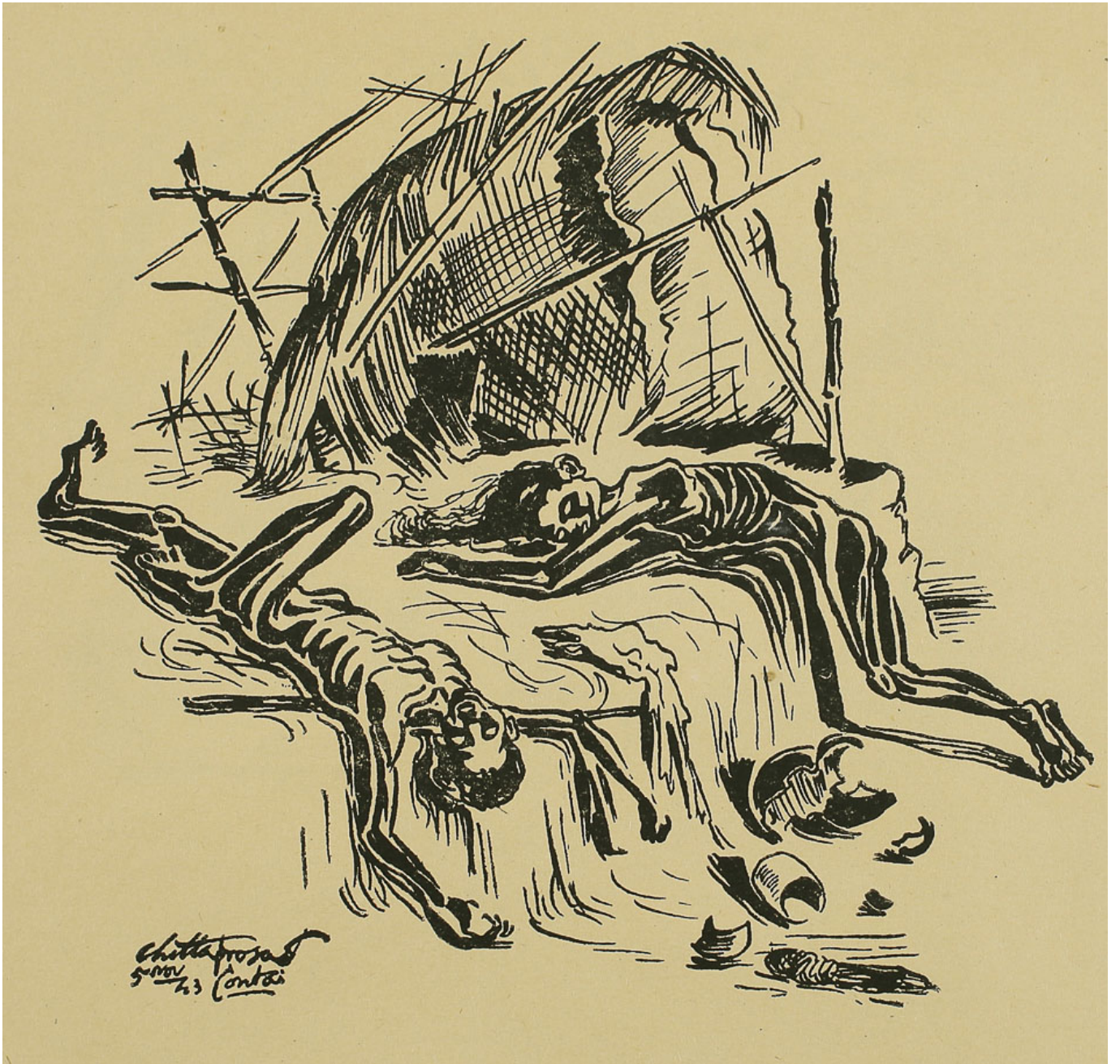
चित्तप्रसाद, भूखा बंगाल, 1943

यदि आप दुनिया के कृषि श्रमिकों, किसानों और सामाजिक आंदोलनों की सुनें, तो इस संकट के दौरान सिस्टम को पुनर्गठित करने के तरीके आप उनसे सीख सकते हैं। हमने उनसे जो कुछ सीखा है, उसका छोटा-सा हिस्सा पेश कर रहे हैं। इनमें तुरंत लागू किए जा सकने वाले आपातकालीन उपायों के साथ दूरगामी उपाय भी हैं जिनसे सतत खाद्य सुरक्षा की गारंटी और फिर खाद्य संप्रभुता—दूसरे शब्दों में, जनता द्वारा नियंत्रित खाद्य प्रणाली—क्रायम की जा सती है।