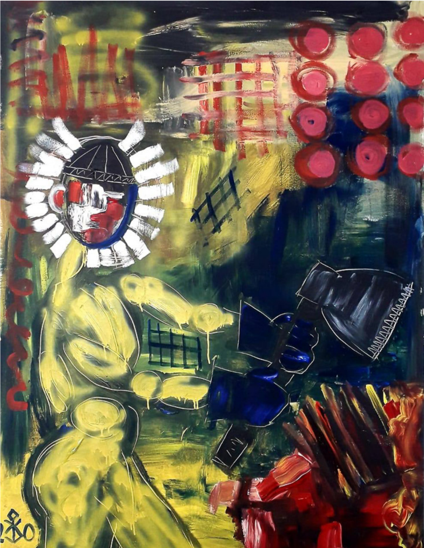
कनाट बुकज़ानोव, कोरोनावायरस, 2020