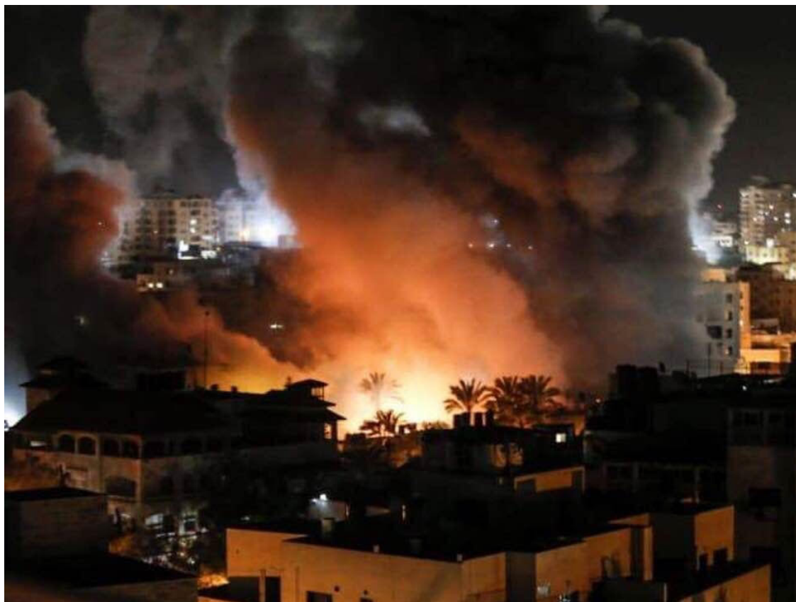
Gaza, le 25 mars 2019.

La position juste est en faveur d'une solution à un seul État, mais elle a été rejetée par les sionistes. La résolution 194 de l'ONU du 11 décembre 1948 affirmait que les Palestiniens expropriés avaient le droit de rentrer chez eux » le plus tôt possible « . On espérait que les différentes communautés trouveraient un moyen de vivre ensemble et qu'une solution politique laïque serait créée pour le peuple. Il ne devait pas en être ainsi. Aujourd'hui, cette solution est difficile à imaginer, car la droite sioniste devient l'extrême centre d'Israël. L'idée qu'Israël est un État juif rend impossible la solution d'un seul État. Le Premier ministre israélien Benjamin Netanyahu a déclaré publiquement qu'il préférerait » un État palestinien démilitarisé qui reconnaît un État juif, l'État nation du peuple juif « . Tant que la classe politique israélienne - qui domine la discussion - fera pression en faveur de cette identité ethno-nationale, l'option d'un seul État ne sera plus sur la table. Ce que vous avez, c'est l'apartheid. Israël est un État et une société d'apartheid. La classe dirigeante israélienne ne permettra pas aux Palestiniens d'avoir une citoyenneté à part entière dans un Israël-Palestine unifié. C'est ce qu'ils ont dit si clairement.