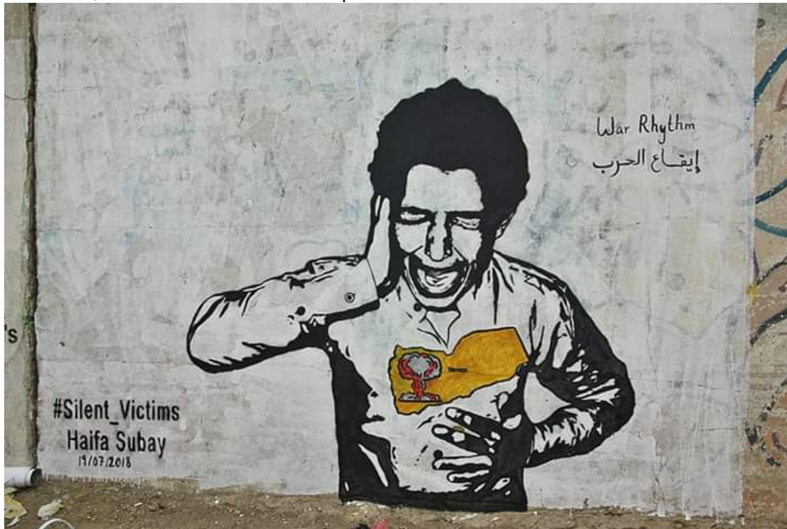
Haifa Subay, Les victimes silencieuses , 2018.

Que reste-t-il à la Palestine ? Si vous regardez le film de Larissa Sansour en neuf minutes, Nation Estate (2012), vous vous retrouvez dans un bâtiment qui est la Palestine, avec ses villes (Ramallah, Jérusalem) sur différents étages. C'est un tableau remarquable de science-fiction de la Palestine d'aujourd'hui et de demain. Nous sommes dans un état d'occupation sans fin. Ce n'est pas du futurisme, mais l'essence même du présent.